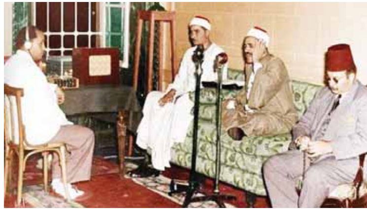
الشيخ طه الفشنى يتلو القرآن ويجواره الشيخ مصطفى إسماعيل والملك فاروق يستمع له