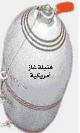
قنبلة غاز أمريكية