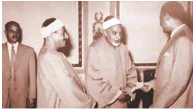
الرئيس جمال عبدالناصر يكرم الشيخين عبدالفتاح الشعشاعى وطه الفشنى

أصيب الشيخ بجلطة فى القلب، ومكث فى المنزل قرابة العامين بأمر الأطباء كما يقول نجله، ولهدا لم يستكمل تسجيل المصحف المرتل، رغم أنه بعد ذلك سافر إلى تركيا، وكانت آخر زيارة خارجية له فى السودان، وكان يوم الخميس صباحاً قد شعر بألم ونزف دماء من أنفه وكتف مقيماً معه، وكان الطبيب المعالج له هو الدكتور أحمد غريب، حيث ذهبت له فى مستشفى الدمرداش وشرحت له فطلب معرفة أسماء الأدوية ونقل دماء له فى أحد المستشفيات وأن يمتنع عن تناول أحد الأدوية، إلا أن الشيخ رفض الذهاب إلى المستشفيات وأحضرنا له الأجهزة فى المنزل، وكنا نجلس معه أنا وشقيقى وشقيقتى، والغريب أنه كان يتذكر كل شيء وكأنه يودع الدنيا، وفى المساء طلب منا الانصراف كل إلى شقتى وبقيت أختى نفيسة معه، وفى الصباح توفى رحمه الله، وانطلقت الجنازة من سيدنا الحسين بعد صلاة الجمعة وحضر نائب رئيس الوزراء عبد العزيز كامل، وأقيم سراقف الغزاء أمام منزله، ودفن فى الدراسة فى العاشر من ديسمبر عام ١٩٧١، وقد كان القارئ المفضل للزعيم الراحل جمال عبد الناصر الذى أهداه طيباً من القضاة الخاصة مهوراً بتوقيع ومن بعده الرئيس السادات وتكريماته بدعوة الرئاسة له فى الاحتفالات التى يحضرها الرئيس والصور التذكارية تشهد بذلك، وفى عام ١٩٩١ كرمته الدولة بمنح اسمه نوط الامتياز من الطبقة الأولى وإطلاق اسمه على أحد الشوارع الرئيسية فى مدينة نصر، كما كرمه زعماء رؤساء وملوك دول عديدة فى العالم.