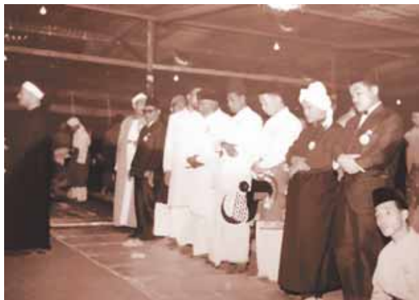
الشيخ طه الفشنى يوم المصلىين خلال إحدى زيارته الخارجية