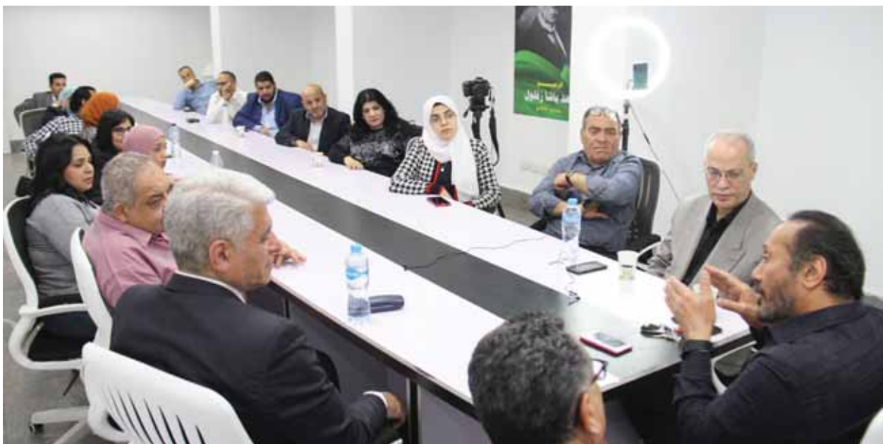
الحجار مع أسرة الوفد خلال أول صالون ثقافى

وعن رؤيته للفن في عصر الجمهورية الجديدة، قال: هناك إرادة من جانب القيادة السياسية، في خلق مناخ صحي، وعلمياً ن نستفيد جميعاً من هذا. وحول المعايير والشروط التي يضعها في تجربة التمثيل قال: معايير اختيارى للتمثيل لا تختلف كثيراً عن معايير اختيارى للكلمة واللحن، أبحت عن الورق الذي أقرأ فيه ذاتى.