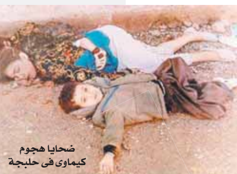
ضحايا هجوم كيمائوي في حلبجة

السامة، وفي الحرب العالمية الثانية استخدمت ألمانيا غاز الفوسجين وسيانيد الهيدروجين في قتل الملايين من المدنيين غير المرغوب فيهم من قبل منظمة حظر الأسلحة الكيمائية، لا ينجو الإنسان ولا البيئة من آثارها، فهي نفايات سامة، إذا ما تم دسها في الأرض لتولفها وتسمم وتلوث الزراعات، وتسمم المياه الجوفية، لذلك دونها والتخلص منها بصورة آمنة يتكلف المليارات من الأموال، فمن صنع الشر وأسباب القتل والدمار، لا يمكن إخفاء آثاره للأبد ونفض يديه بصورة خالصة.