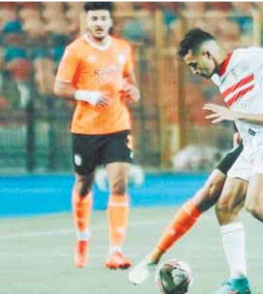
الزمالك فقد نقطتين هامتين بالتعادل مع فاركو

وستقوم بالتعويض في المباريات المقبلة، وأهنتى لاعبي الزمالك لأنهم أدوا ما عليهم». وشدد «فيريرا»: «طارق حامد قدم مباراة ممتازة أمام فاركو ولم أر منه أى عصبية في اللقاء، والبعض كان يتحدث عن أشرف بن شرقي بالسلب والآن يتحدثون حول افتقاد الزمالك له، كما أن رزاق سيميه غاب عن اللقاء بسبب تعرضه لإصابة عضلية». وواصل «فيريرا» حديثه: «شكيبالا شارك