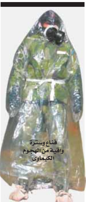
قناع وسترة واقية من الهجوم الكيمائوي

١٩٩٢ انطلقت معاهدة حظر الأسلحة الكيمائية، لحظر واستحداث وإنتاج وتكديس واستخدام هذه الأسلحة، وأصبح لتنفيذ المعاهدة منظمة في لاهي العاصمة السياسية لهولندا، ووقعت ١٩٢ دولة على المعاهدة، ومنذ يونيو ٢٠١٦ بدأت المنظمة في التفتيش على الدول الموقعة على المعاهدة، وأعلنت تبعاً لتمكينا من تدمير ٦٦٦٨ دولة ٧٢٥٢ طن متري، أي ما يعادل ٩٢٪ من مخزونات الأسلحة الكيمائية، وذلك وفقاً للمعاهد من الدول نفسها، لكن المنظمة وقفت دوماً عاجزة أمام السرية التي تلتزمها الدول خاصة الدول الكبرى في إخفاء مخازن الأسلحة الكيمائية، وعدم الإعلان عنها بشفاافية للمنظمة، وعلى رأس هذه الدول أمريكا وكوريا الشمالية، والثلاث تحتفظن بالآلاف الأطنان من مخزون الأسلحة الكيمائية، دون السماح للمنظمة بالوصول إليها، وتحتفظن به تحت زعم «حق الرد» ضد أي هجوم كيمائوي تتعرض له أي منهما.