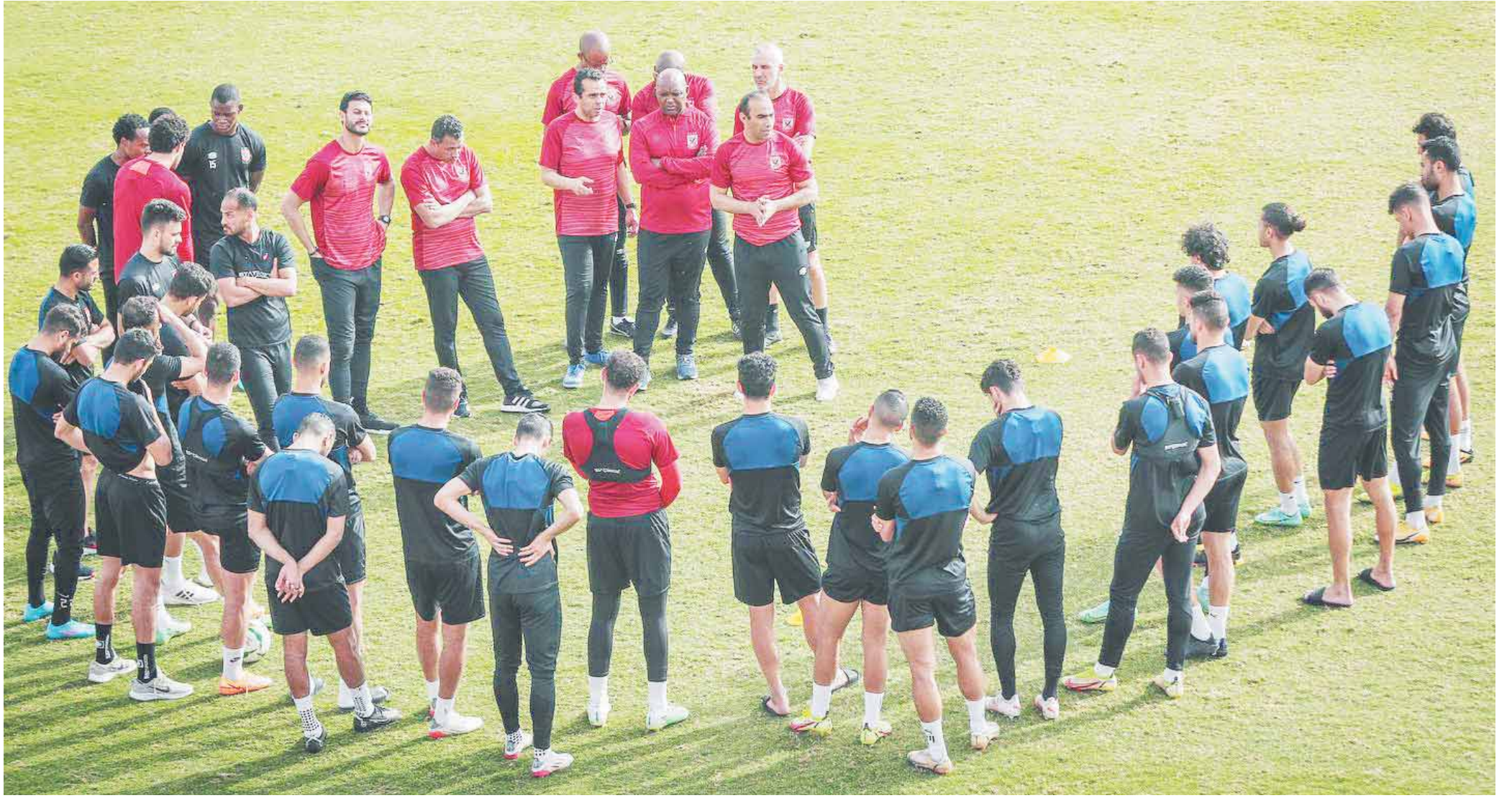
موسيماني طالب لاعبي الأهلي بعدم ارتكاب أى أخطاء أمام الرجاء

«أفشة» جاهز.. بشرى سارة بشأن «بانون».. «هانى» يلحق بمواجهة الإياب