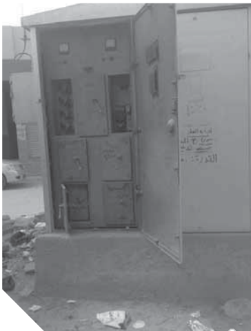
اكشاك الكهرباء مفتوحة