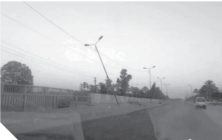
أعمدة الإنارة متهاكة بإحافظات