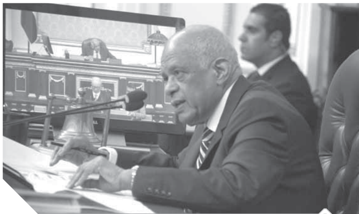
عبدالعال خلال الجلسة

وافق مجلس النواب برئاسة الدكتور على عبدالعال، على مجموع مواد مشروع قانون مقدم من الحكومة بشأن الإذن لوزير المالية في ضمان الشركة القابضة للقطن والغزل والنسيج لدى مؤسسة سيرى السويسرية (SERY) وساس (SACE) الإيطالية فيما تحصل عليه من تمويل وضمان الوفاء بالاتزامات المالية فيما تتعاقد عليه مع الشركات الأجنبية الموردة لألات ومعدات الغزل والنسيج، من خلال قرض قيمته ٥٥٠ مليون يورو.. وأحال المجلس المشروع إلى مجلس الدولة لمراجعته.