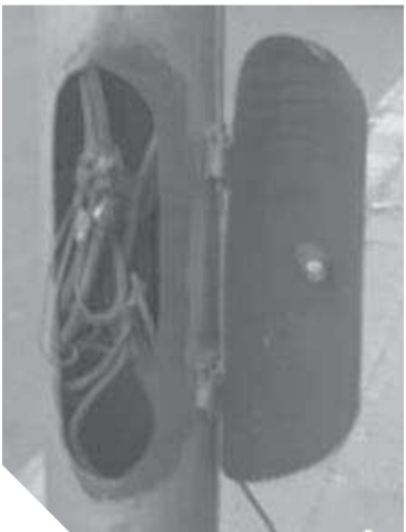
أسلاك عارية تهدد حياة المواطنين

أعمدة الإسكندرية متهاكة.. وأهالي الإسمايلية ينتظرون الموت.. وفي أسوان المحولات تهدد الجميع