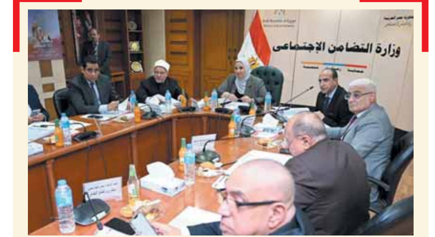
وزيرة التضامن خلال اجتماع مجلس إدارة البنك

وحرص البنك المتواصل على ضمان سرية البيانات، حيث يهدف هذا المعيار إلى توفير إطار