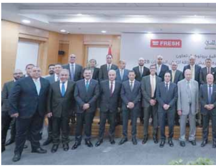
قيادات «الأهلى» و«فريش» خلال توقيع اتفاقية التعاون