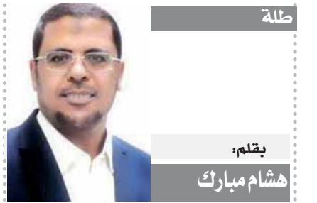
بقلم: هشام مبارك