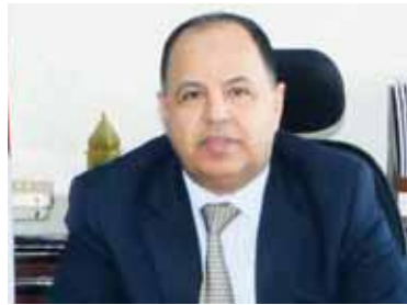
د. محمد معيط

نحجت وزارة المالية في تدبير تمويل جديد يبلغ نصف مليار دولار لتنفيذ مشروعات صحية وتعليمية، في شراكة جديدة مع بنكي «دويتشه بنك» و«بنك ABC» والمؤسسة العربية لضمان الاستثمار واثتمان الصادرات، «ضمان»؛ بما يسهم في تنوع مصادر التمويل، من خلال أدوات مبتكرة ومتنوعة وأكثر استدامة، واستجابة لمتطلبات البيئة والحوكمة.