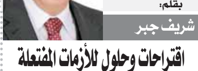
بقلم: شريف جبر

يقول فى إحدى رسائله مخاطبا صديقه الألمانية التى تحول إلى النازية: «قلت لى: عظمة بلادى لا تقدر بتمن. كل شيء جيد بسهم فى عظمتها. وفى عالم فقد فيه كل شيء، معنا، يجب على الذين مثلنا كشبان الممان، أن يضحوا بكل شيء، من أجل إسمائهم فى إعلارة شأن أمهم أحببتى فى ذلك الوقت، ولكن فى تلك اللحظة تبذلت الأمور بيننا.. لا، قلت لك،» «لا، يمكن أن أصدق أنه يجب أن يخضع كل شيء، لهدف واحد. هناك وسائل لا يمكن أن يبرر استخدامها، وأود أن أكون قاررا على أن أحب بلادى ومع ذلك أحب العدالة.. لا أريد أى عظمة لها أن تحافظ على حيويتها من الدم والكتب.» أرب فى أن أحافظ على حيويتها من خلال الحفاظ على العدالة، كان ذلك: حسنا، أنت فقط لا تحب بلادك.»