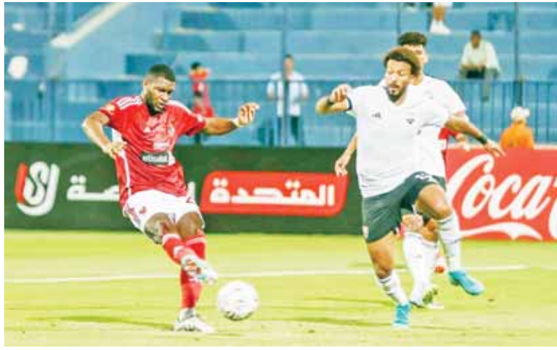
موديست سجل هدفا في لقاء الجونة

وقفت الأهل في صدارة الدوري الممتاز برصيد ١٢ نقطة ويشارك الأهداف عن بيراميدز، رغم فقدان أو تقطعت في مسيرة الموسم الحالي بالتعاقد مع الجونة. وتعلت الانتقادات إلى كولر، بسبب التراجع الشديد في مستوى الفريق في الموسم