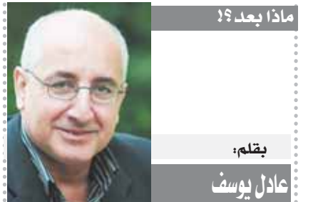
بقلم: عادل يوسف