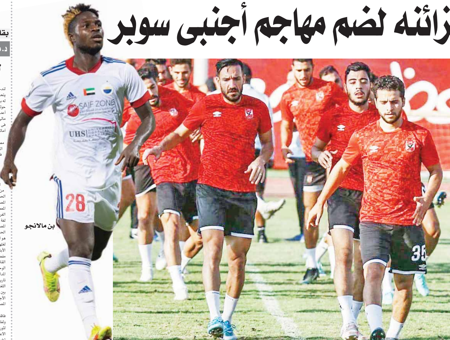
الأهلي يستعد بقوة لمواجهة المقاصة

ويختتم الفريق تدريباته اليوم السبت استعداداً لمواجهة مصر المقاصة غدًا الأحد في دور الستة عشر ببطولة الكأس بعدما استقر مسئولو الأهلي على خوض منافسات الكأس عقب إقالة رئيس لجنة الحكام عصام عبد الفتاح.