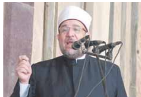
د. مختار جمعة

قال الدكتور محمد مختار جمعة وزير الأوقاف إن للمسجد رسالة عظيمة لا تقف عند إقامة الشعائر فلي المسجد رسالة إيمانية، وأخلاقية، وتربوية، وتثقيفية، ووطنية، وإنسانية، واجتماعية، وتكافئية، فما هي مساجد مصر في الجمهورية الجديدة تستعيد أداء رسالتها على الوجه الأكمل، ما بين تهيئة عمارة للائمة والساجدين بعمليات إحلال وتجديد وتطوير وصيانة غير مسبوقة لا مثيل لها. جاء ذلك خلال خطبة الجمعة بمسجد «السلطان حسن» بالقاهرة، بعنوان: «المسجد مكانته ورسالته ودوره في المجتمع». وأشار الوزير إلى أن المساجد عادت تفتح أبوابها، سواء لتعليم الناشئة في البرنامج الصيفي للطفل الذي