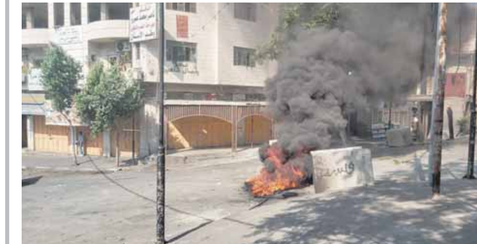
استمرار المواجهات في الضفة مع الاحتلال