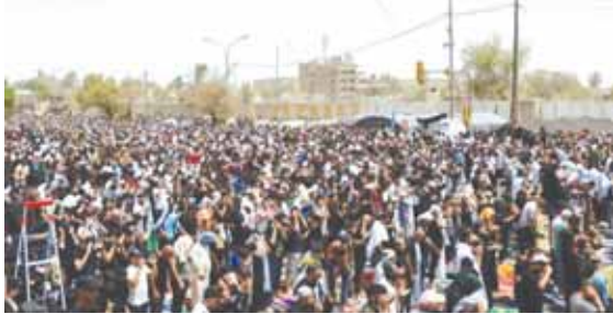
مظاهرات الغضب لانصار الخصوم السياسيين في العراق

شهد امس العراق مظاهرات غاضبة لملايين للتيار الصدري من جهة، بالمنطقة الخضراء بالعاصمة بغداد وخبرين للإطارات التنسيق في احتجاجات متفرقة، حيث طالب كل فريق بتحقيق مطالبه، وسط أزمة سياسية تشهدها بغداد. وأدى انصار التيار الصدري المتصنعون في محيط البرلمان العراقي صلاة الجمعة في المنطقة الخضراء، بالتزامن مع دعوات من الإطار التنسيق للظواهر، في ظل خلاف الطرفين على تشكيل الحكومة العراقية الدعوة لانتخابات مبكرة. وانطلقت المسيرات العامة من ساحة الفردوس وسط بغداد، وطالبت قوى التغيير في التيار المدني الديمقراطي، بحل البرلمان، كما شهدت محافظات: ذي قار وبابل وواسط والديوانية وميسان والبصرة والمثنى وديالى وصلاح الدين وبنينوى، انطلاق مظاهرات، دعما لمطلب حل البرلمان الذي رفعه زعيم التيار الصدري مقتدى الصدر. وتطالب المظاهرات بالاسراع في تشكيل حكومة خدمة وطنية كاملة الصلاحيات، ومن أجل الحفاظ على المكتسبات الوطنية التي تضمن حياة العراقيين وأمنهم، وتمنع كل أشكال الفوضى ومحاولات الإخلال بالنسب الأهل، وفقا لبيان الإطار. وقال «الكافى»، إن الأزمة التي تمر بها بلاده تحتاج إلى الحوار والحكمة، وشدد على ضرورة تجنب التصعيد، مؤكداً أن حكومته تعمل مع جميع الأطراف من أجل تهدئة الأوضاع. وجاءت دعوة التيار الصدري بعدما دعت ما تسمى اللجنة المنظمة للمظاهرات للدفاع عن الدولة - والتابعة للإطار التنسيقى - في بيان لها مساء أول امس الأربعاء اتباع الإطار إلى التظاهر اليوم الجمعة «للدفاع عن الشرعية» في مظاهرات عنوانها «الشعب يحمي الدولة».