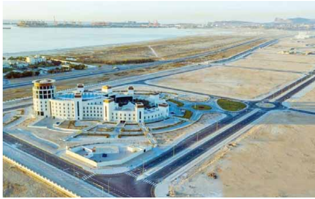
أحد المشروعات بسلطنة عُمان

تستهدف الوصول إلى ١٠٪ من الاستثمار الأجنبي المباشر وفق رؤية عمان ٢٠٤٠