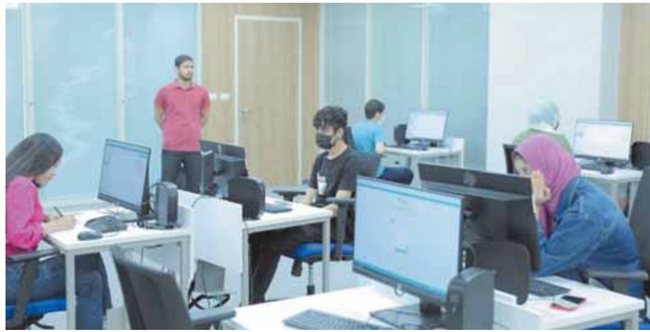
الأولى بالجامعات الحكومية؛ لمساعدة الطلاب في عملية التنسيق الإلكتروني من التاسعة صباحا وحتى الثالثة ظهرا طوال فترة التنسيق.

يوصل طلاب الثانوية العامة، تسجيل رغباتهم للالتحاق بالجامعات لليوم الثالث على التوالي بالمرحلة الأولى لتسجيل قبول الناجحين في الثانوية العامة بالجامعات والمعاهد. وشهدت عملية تسجيل رغبات امس إقبالا كبيرا من الطلاب في اليوم الثاني لفتح باب التسجيل، إلى جانب استمرار معامالت التسجيل بالجامعات الحكومية في مساعدة الطلاب لتسجيل رغباتهم. وأعلن السيد عطا، رئيس قطاع التعليم بوزارة التعليم العالي والبحث العلمي والمُشرف العام على مكتب التنسيق، عن أن عدد الطلاب المتقدمين لتسجيل المرحلة الأولى للقبول بالجامعات بلغ حتى الآن ٢٥ ألف طالب وطالبة على موقع التنسيق الإلكتروني: www.tansik.egypt.gov.eg للعام الجامعي الجديد. وأكد عطا على انتظام سير إجراءات إدخال الطلاب لرغباتهم عبر موقع التنسيق الإلكتروني، موجها الطلاب بضرورة كتابة رغباتهم بطريقة سليمة وصحيحة، مضيفا إمكانية تعديل الرغبات حتى الساعة من مساء بعد غد الاثنين ١٥ أغسطس الجاري. وأضاف د. عادل عبدالغفار، المُستشار الإعلامي والمُتحدث الرسمي لوزارة، أنه تم فتح معامالت الحاسب