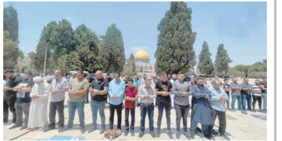
صلاة الجمعة من الأقصى