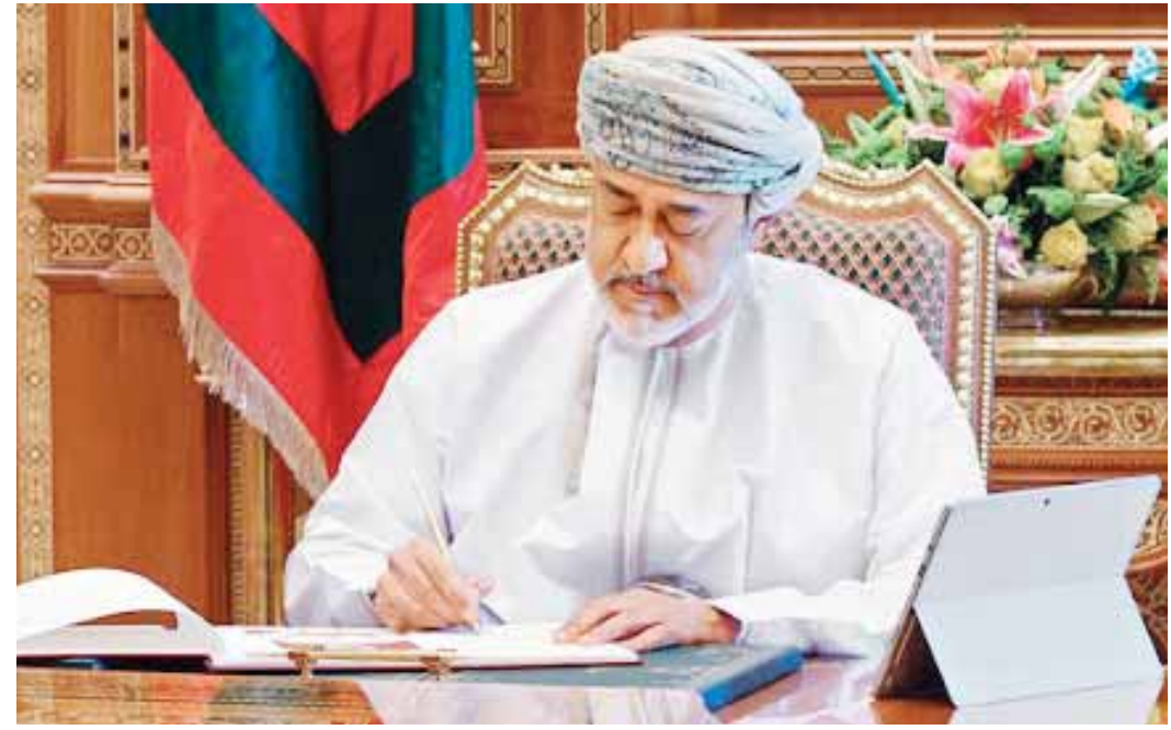
السلطان هيثم بن طارق سلطان عُمان