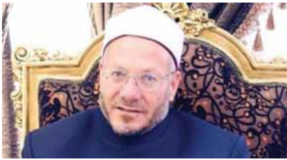
د. شوقي علام

توجه فضيلة الأستاذ الدكتور شوقي علام مفتي الجمهورية، رئيس الأمانة العامة لدر وهيات الإفتاء في العالم الشكر والتقدير إلى الرئيس عبدالفتاح السيسي رئيس الجمهورية على قراره المُد لفضيلته في مهام منصبه مفتيا للجمهورية لمدة عام تبدأ من يوم ١٢ أغسطس. وقال فضيلة المفتي «إن قرار الرئيس السيسي يعكس مدى اهتمامه بالمؤسسة الدينية المصرية، ودعم جهوده في تجديد الخطاب الديني، مؤكداً أن قرار التجديد له للمرة الثانية يمثل شهادة ووساماً ودافعا قويا لبذل المزيد من الجهود لضبط بوصلة الإفتاء وتحقيق الريادة الدينية والإفتائية المصرية في الداخل والخارج. وأضاف المفتي «نحن لا زلنا على العهد مستميرين في جهودنا التي بدأناها قبل سنوات في دار الإفتاء المصرية من أجل مواجهة جماعات التطرف والإرهاب ونشر صحيح الدين والشريعة الوسطية للأهوية التي تتميز بها مصر، والتي تحفظ استقرار المجتمعات». جدير بالذكر أن الرئيس عبدالفتاح السيسي قد أصدر قرارا جمهوريا رقم ٢٥٤ لسنة ٢٠٢٢ بمدّ خدمة فضيلة الأستاذ الدكتور شوقي علام، مفتي الجمهورية، لمدة عام مفتيا لجمهورية مصر العربية حتى ١٢ أغسطس ٢٠٢٣، وتمّ نشر القرار في الجريدة الرسمية.