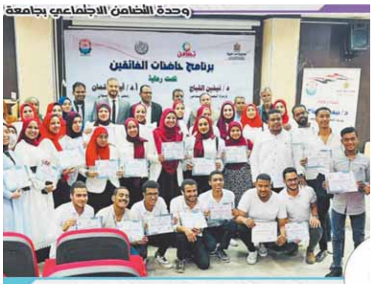
طبص بمصانع الأخبار،

نفذت وحدات التضامن الاجتماعي منذ تواجدها بالجامعات خلال الفترة من مارس ٢٠٢١ حتى يونيو ٢٠٢٢، برنامج «حاضنات الفائقين»، وأعطت الوحدات اهتماماتها بالطلبة المتفوقين، من خلال منح مكافآت مادية شهرية للطلاب الجامعيين بالسنوات الدراسية المختلفة تحفيزاً وحرصاً على تشجيع الطلاب على مواصلة تفوقهم الدراسي وزيادة روح التنافس بين الطلاب، وتقديراً وتكريماً للطلاب المتفوق خلال سنوات دراسته الجامعية. كما أمندت منح الفائزين لتشمل الباحثين (الماجستير- الدكتوراه) من خلال منح مادية شهرية وسنوية، بالإضافة إلى تسهيلات بحثية وشراء كتب واشترك في دورات تدريبية، وذلك تشجيعاً لهم لاستكمال مسيرتهم البحثية وتخفيف العبء المادي الذي يتحملة الباحثون خاصة في الكليات العملية.