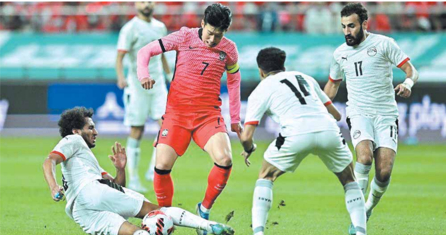
نتائج المنتخب السينة استدمت تغيير الجهاز الفني

ومن هناك تولى تدريب نيفيكا الذى قاده للفوز بالدورى البرتغالى موسمين متتاليين وفى الموسم الثانى توج بالثنائية