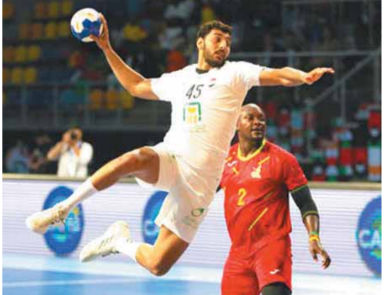
منتخب اليد اكنتسح الكامبيرون ويسعى للفوز على المغرب