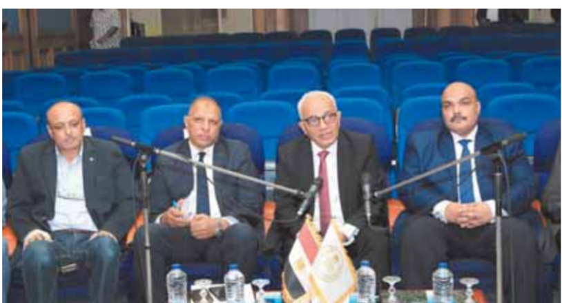
الوزير أثناء الاجتماع عبر الفيديوكونفرانس

حلها على الفور وبشكل احترافي. وأكد الوزير بأن يتم توزيع كتيب المفاهيم على لجان الامتحانات قبل الامتحانات، مؤكداً بضرورة التنبيه على الطلاب بعدم الكتابة على كتيب المفاهيم وعدم اتلافه، وتسليمه للمراقبين بعد انتهاء الامتحان يومياً، مشيراً إلى أن كتيب المفاهيم سيتم استخدامه للسنوات المقبلة، والتأكد من إعادة تدوير العمال داخل الإدارات في لجان الثانوية العامة، واتخاذ الإجراءات المشددة لمنع الغش في اللجان. وأوضح الوزير أنه سيتم تغذية مختلف لجان الامتحانات بمختلف أنحاء الجمهورية بكاميرات مراقبة لرصد أي أعمال غش داخل اللجان، ورصد أية مخالفات في حينها، وذلك من خلال غرف العمليات؛ لضمان انضباط سير الامتحانات.