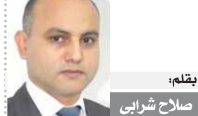
يقلم: صلاح شرابي