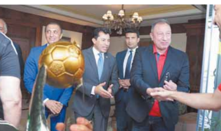
وزير الرياضة مع الخطيب

استقبل الدكتور أشرف صبحى، وزير الشباب والرياضة، بعثة الأهلى فى مطار القاهرة الدولى، بعد عودتها باللقب الغالى من المغرب.