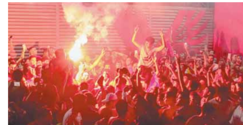
احتفالات الجماهير الأهلاوية باللقب