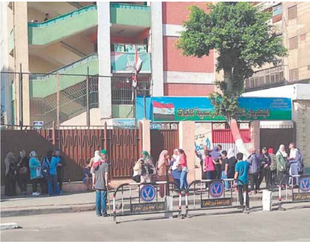
طلاب الثانوية العامة أمس أمام المدارس