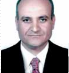
بقلم: صلاح صيام