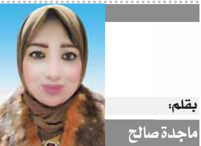
بقلم: ماجدة صالح