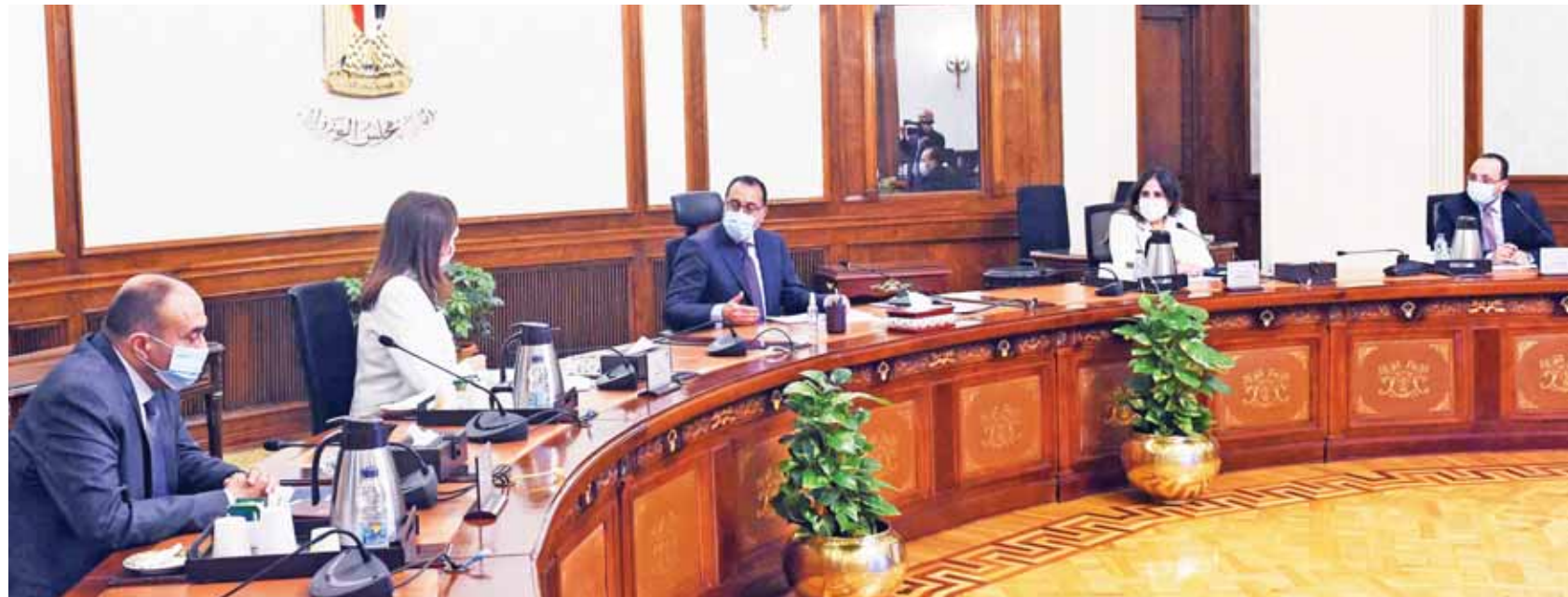
اجتماع الدكتور مصطفى مدبولي لبحث إجراءات الخروج من الأزمة الاقتصادية الحالية