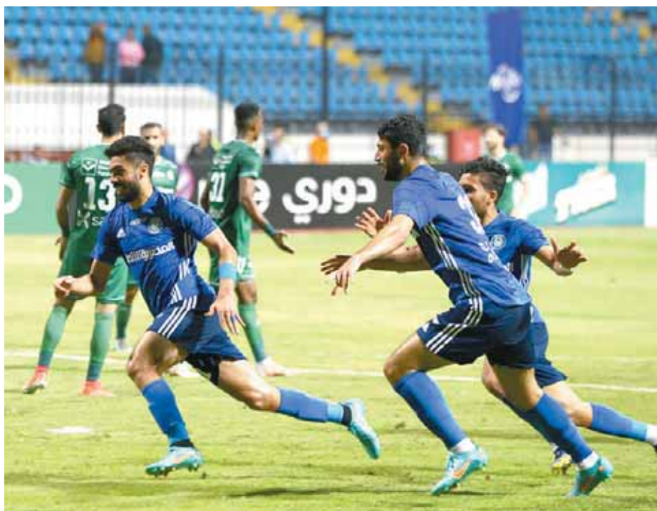
سموحة اكتسح الاتحاد بالخمسه