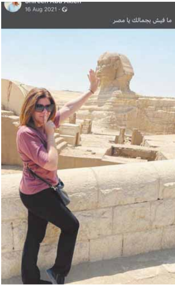
ما فيش بجمالك يا مصر