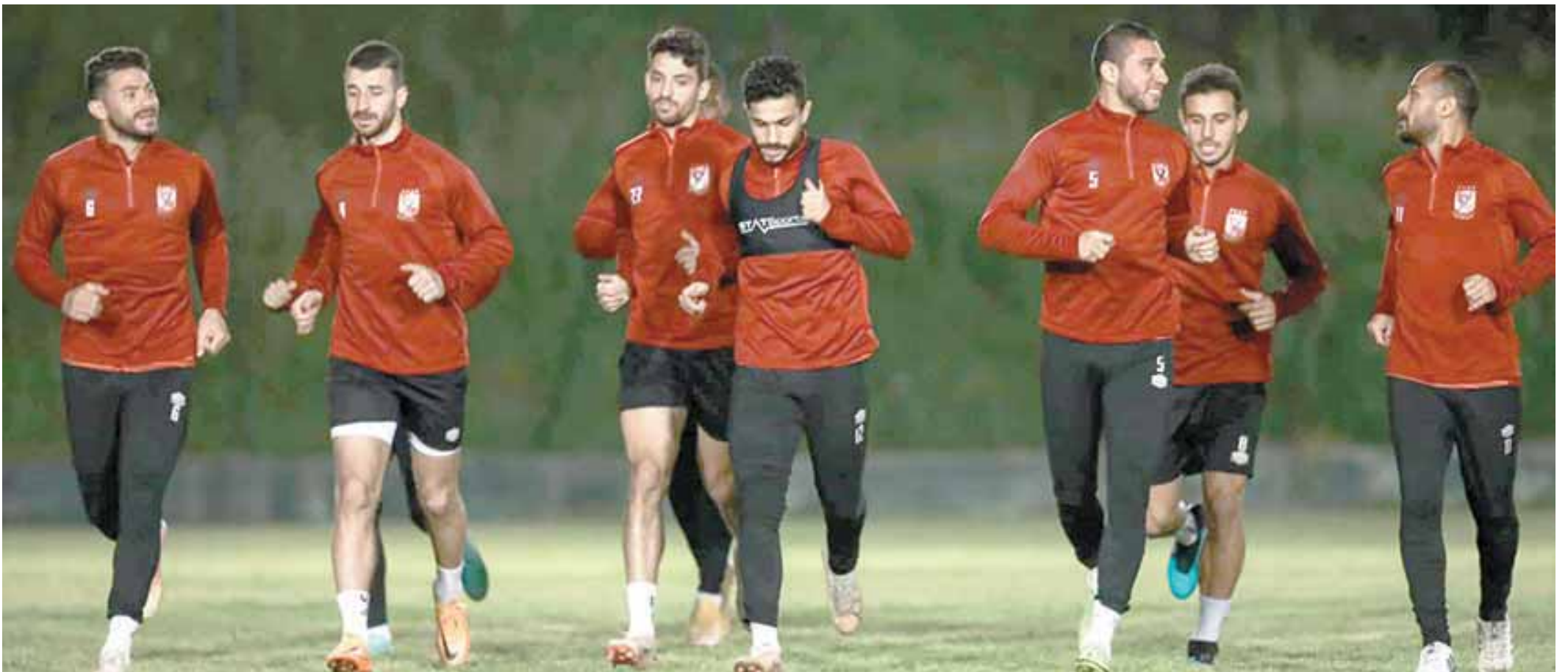
التناؤل يسيطر على فريق الأهلي قبل مواجهة وفاق سطيف