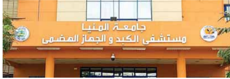
جامعة المنيا مستشفى الكبد و الجمز المضمي

١٠ ملايين جنيه لمستشفى الطلبة للإنفاق على مُتطلبات الرعاية الصحية لطلاب الجامعة بشكل متكامل. وشهد قطاع المستشفيات الجامعية بجامعة عين شمس تطوراً كبيراً، فى إطار سعى الجامعة لتنفيذ مشروع المدينة الطبية التي تشمل العديد من المستشفيات بكافة التخصصات، فقد بدأ العمل بمبنى جراحات الأطفال التخصصية، ومبنى مستشفى الطوارئ الجديدة، فضلاً عن العمل فى ١١ مشروعاً تضمنتها المدينة الطبية، ومشروع بنك الدم الجديد. كما تم تدشين المرحلة الأولى من مستشفيات الإصابات والطوارئ الجديد بجامعة أسيوط، وافتتاح قسم للعظام، بطاقة إجمالية ١٩٦ سريراً لتقسم العظام، و١٠ غرف عمليات، ويخدم المستشفى الجامعي قطعاً كبيراً من سكان صعيد مصر. وحظيت مستشفيات جامعة الإسكندرية باهتمام مكثف خلال الفترة الماضية، حيث تم تطوير وحدة قسطرة القلب للأطفال التابعة لمستشفى سموحة، وتطوير غرفة عمليات القلب المفتوح.