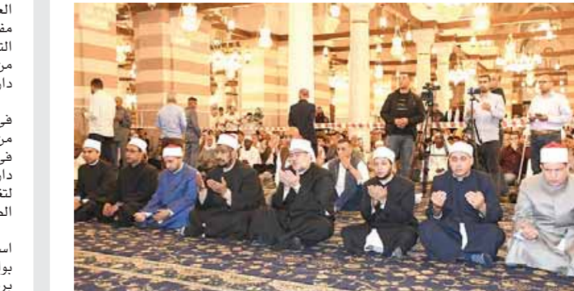
رسول الله. من هم؟ قال: هم أهل القرآن، أهْلُ الله وخاصَّته، ومن ذاق حلوة القيام أدرك أن ركعتين فى جوف الليل خير من الدنيا وما فيها، ومن ذاق حلوة الإنفاق فى سبيل الله (عز وجل) لا يمكن أن يحنو على الفقراء فى رمضان ثم

وأكد وزير الأوقاف من مسجد السيدة زينب: «إنها المؤمنون الذين إذا ذكر الله وجلت قلوبهم، وإذا تليت عليهم آياته زادتهم إيماناً وعلى ربهم يتوكلون»، فمن ذاق عرف ومن عرف اغترف، ومن ذاق حلوة الطاعة والعبادة لا يمكن أن ينقطع عنها بل إن الطاعة تزيد طاعة، يقول نبينا (صلى الله عليه وسلم): «من صام رمضان وأتبعه بست من شوال فكأنما صام الدهر»، ومن ذاق حلوة القرآن فى الشهر الكريم لا يمكن أن يتخذ القرآن مهجوراً لا فى شوال ولا فى ذى القعدة ولا فى أى يوم من الأيام، فاهل القرآن ليسوا أهل القرآن فى رمضان فحسب، فهم أهل الله وخاصته، وأهل الله وخاصته دائماً مع عباده على كل وقت وحين، يقول نبينا (صلى الله عليه وسلم): «إن لله أهلين من الناس قالوا: يا