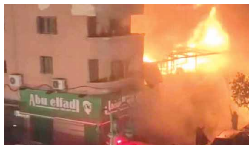
الأمنية بمديرية أمن الإسكندرية، إخطاراً من قسم شرطة الدخيلة يفيد بنشوب حريق بمنطقة البيطاش غربى المحافظة، وعلى الفور انتقلت