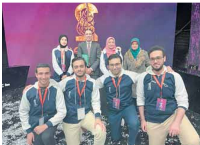
فريق جامعة كفر الشيخ