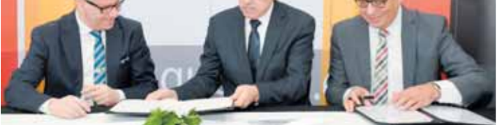
جانب من توقيع البروتوكول

رئيس الاتحاد العربي للتعليم الخاص يطالب بتوحيد المناهج العلمية في الجامعات العربية