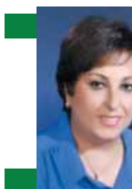
د.عزة أحمد هيكل

من تشخيصها الفنان الشاب «طه سوقي» كانت حكاية جميلة ولكن منقوصة لا تشمل جوانب عديدة من حياة الطفل اليتيم الذي فقد والديه صغيرًا فإذا به محام بارع بعد سنوات سقطت من ذاكرة السيناريو.. وإن كانت شخصية «رام الله» هاجر السراج الفتاة السورية الجميلة التي تلاعب ثلاثة رجال في آن واحد لتحصل على الحب والإقامة من خلال ياسر زوج رئيسها في مكتب المحاماه أو الإقامة والزوج والوظيفة عبر تواصلها مع «خالد» نائب أماني التجار أو الإقامة والزواج المؤقت في سفينة سيئة السمعة مع «نديم» الذي يحييها في صمت ولا يعرف كيف يكون الحب والزواج.. أما بقية شخصيات العمل فمعلمها ظهر دون أي عمق فتى يعبر عن التصرفات والسلوك وإن كانت شخصية «عم جميل» صاحب المكتبة والتي قدمها الفنان «نبيل على ماهر» من أجمل الشخصيات مثالية ونقاء وعطاء إلا أنها في النهاية غير واقعية ولا تتحمل التفسير الدرامي سوى لمعلمة الخير في مقابل عبثية الحياة والقدرة.. تكتيك المزج بين الماضي والطفولة مع الحاضر والواقع تقنية فنية أضافت بعض العمق للعمل مع تلك الموسيقى الرائعة في الخلفية واستخدام أغنيات شهيرة لملء فراغات الحوار وتعد الأغاني والموسيقى من أقوى عناصر المسلسل الذي ظهرت أجواءه النقية الأنيقة جدًا بالتوازي مع حالة الشاب نديم المتوحد مع ذاته وهو يجاهد ليخرج من شرفة الذات التي خضمه الضغب والتنافس والغيرة والحب في حياة فرضت عليه وعيلينا.