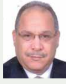
بقلم: حسين حلمي