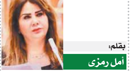
بقلم: أمل رمزي