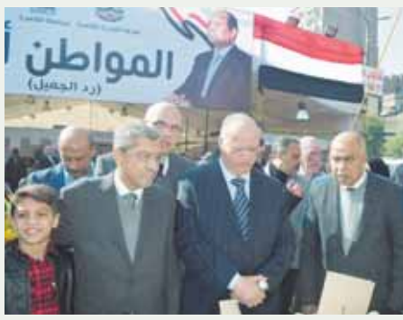
محافظ القاهرة ورئيس «الغرف التجارية» يتفقان معرض السلع «المواطن أولاً»

كتبت - جيهان موهوب: تفقد اللواء خالد عبدالعال، محافظ القاهرة والمهندس إبراهيم العربي، رئيس الاتحاد العام للغرف التجارية ورئيس غرفة القاهرة أمس الخميس معرض السلع «المواطن أولاً» الذي تنظمه غرفة القاهرة التجارية بالتعاون مع محافظة القاهرة بحسب باب الشرعية بالقاهرة للإطمئنان على توافر السلع لدعم المواطنين بمنتجات ذات أسعار مخفضة لتخفيف العبء عنهم؛ تنفيذاً لتوجيهات الرئيس عبدالفتاح السيسي، وأشاد محافظ القاهرة بالتعاون مع الغرفة التجارية بالقاهرة،