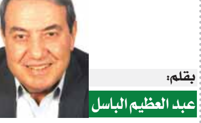
بقلم: عبد العظيم الباسل