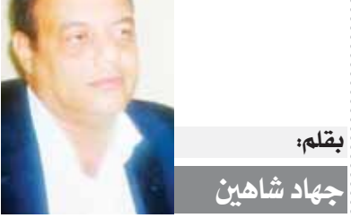
هذه الدنيا بقلم: جهاد شهابين