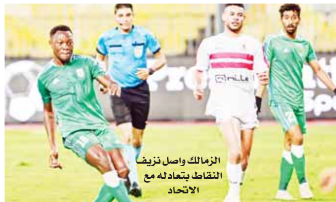
الزمالك واصل تزييف النقاط بتعادله مع الاتحاد