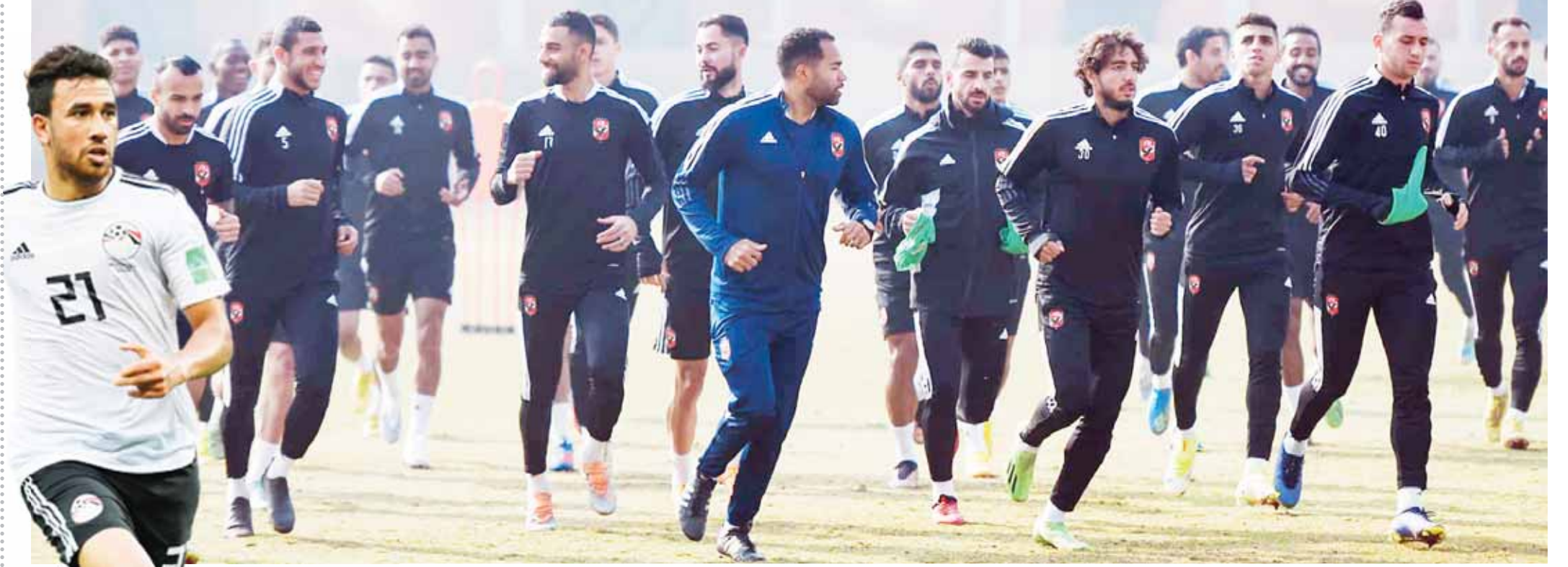
الأهلي يستعد بقوة للمباريات القادمة