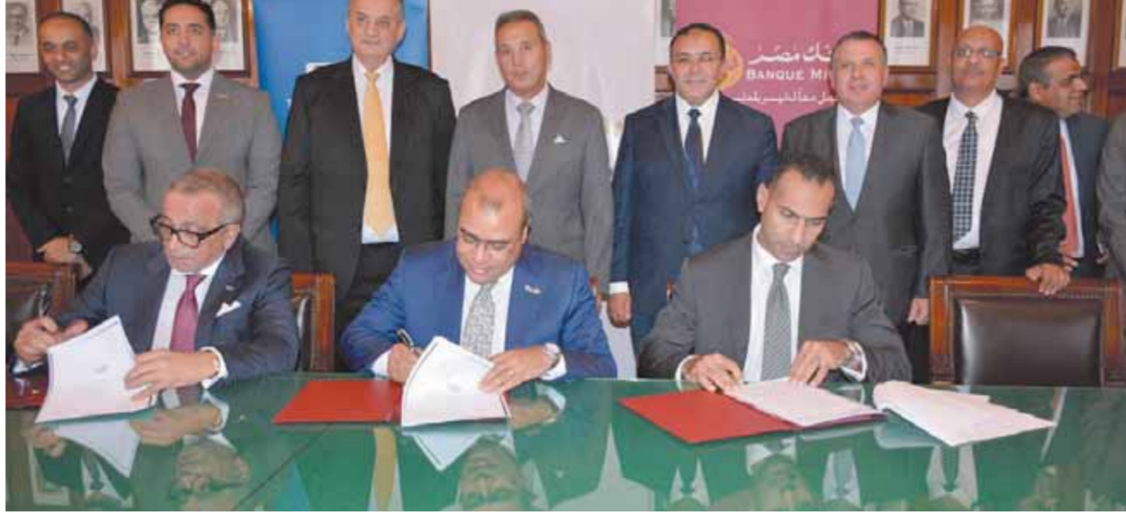
قيادات البنك خلال توقيع العقد

ويسعى البنك إلى تقديم الخدمات المصرفية والمالية بصورة ميسرة ومتطورة، حيث يعمل البنك على تعزيز تميز خدماتها والحفاظ على نجاحها طويلاً المدى والمشاركة بناعية في الخدمات التي تلبي احتياجات عملائها، حيث أن قيم واستراتيجيات عمل البنك تعكس دائماً التزامها بالتنمية المستدامة والرخاء لمصر.