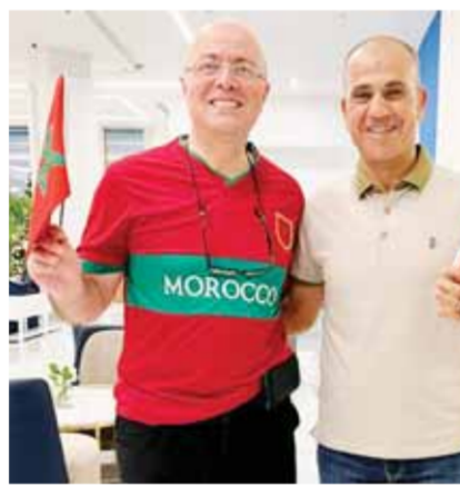
سفير المغرب يحتفل بفوز بلاده فى الفردقة

شهدت مدينة الفردقة احتفالات أحمد التازى سفير المملكة المغربية، بتأهل المنتخب المغربى لنصف نهائى المونديال بعد الفوز الكبير على منتخب البرتغال. وششارك المصريون المقيمون فى المنتجع السفير المغربى فى الاحتفالات، وعمت الفرحة مدينة الفردقة بهذا التأهل التاريخى الذى يحققه أول منتخب عربى فى تاريخ المونديال.