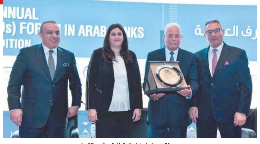
مندی رؤساء إدارات المخاطر بشرم الشيخ

وقال البنك إن هذه الجوائز تمنح لأفضل علامة تجارية بموجب أدائها في كافة القطاعات. وتعتمد التقييمات الخاصة بالفوز لجميع المؤسسات الفائزة بتلك الجوائز على مجموعة من المعايير المتخصصة والمربطة بالأداء والاستراتيجية التي تتبناها المؤسسات.