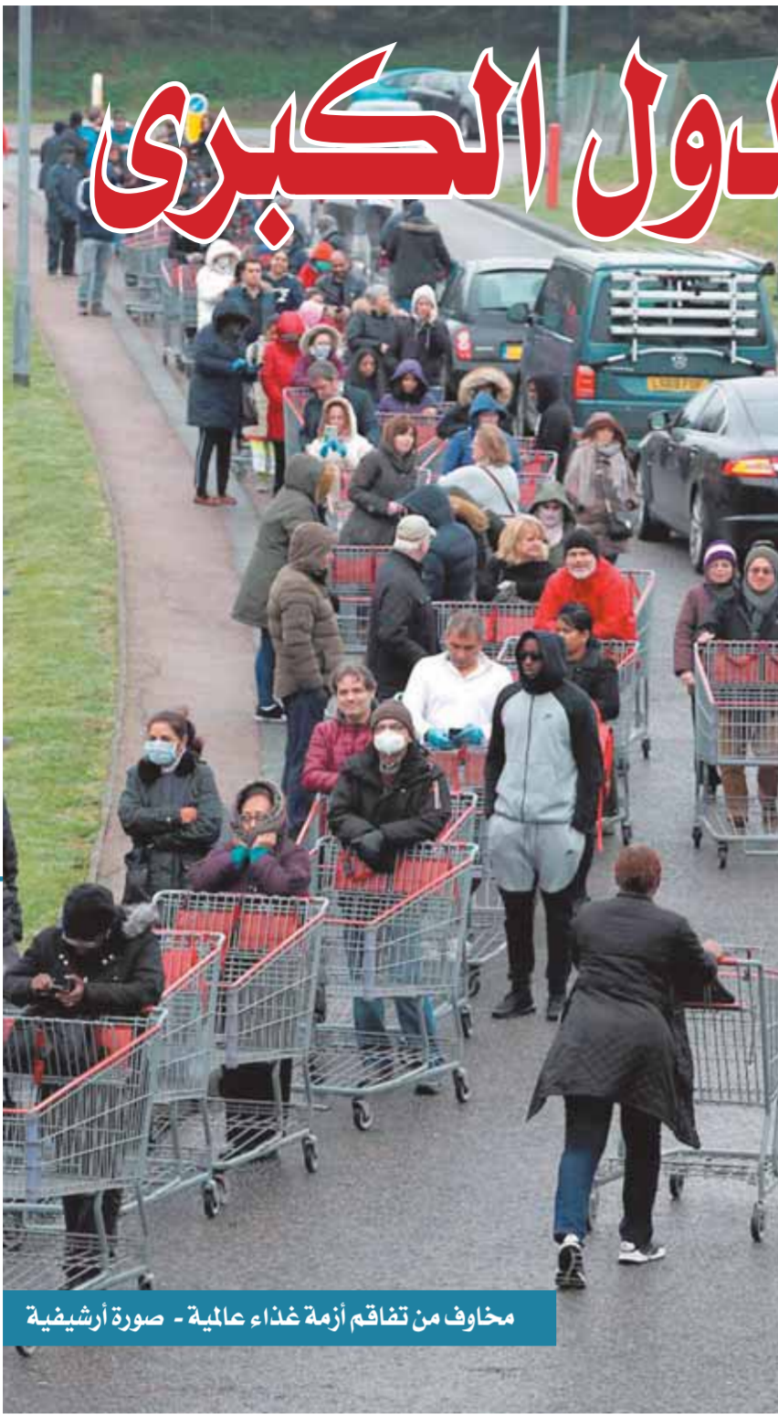
مخاوف من تفاقم أزمة غذاء عالمية - صورة أرشيفية

وقد أعرب ٤١% من مواطنى فرنسا عن معاناتهم للتأقلم مع ارتفاع مستويات الأسعار الحالية، وقد تساوت هذه النسبة تقريباً مع المبحوثين فى بولندا ٤٠%، يليهم ألمانيا ٢٧% وبريطانيا ٢٦%. من جانبه حذر صندوق النقد الدولى والبنك الدولى وجهات أخرى من مخاوف بشأن تدهور الآفاق العالمية، رغم أمالهم فى أن تساعد إعادة فتح الصين اقتصادها فى دعم النمو العالمى.