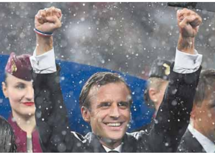
طبع بمطابع الأخبار

الاولى في تاريخ المنتخبات العربية والإفريقية، بعد فوزه على البرتغال بهدف نظيف. واتجه أشرف حكيمي إلى والدته الحاضرة في المدرجات عقب إطلاق صافرة نهاية المباراة مباشرة من أجل تقبيلها بعد التأهل. فيما ذهب سفيان بوفال إلى والدته بعد نهاية اللقاء لكي تدخل معه