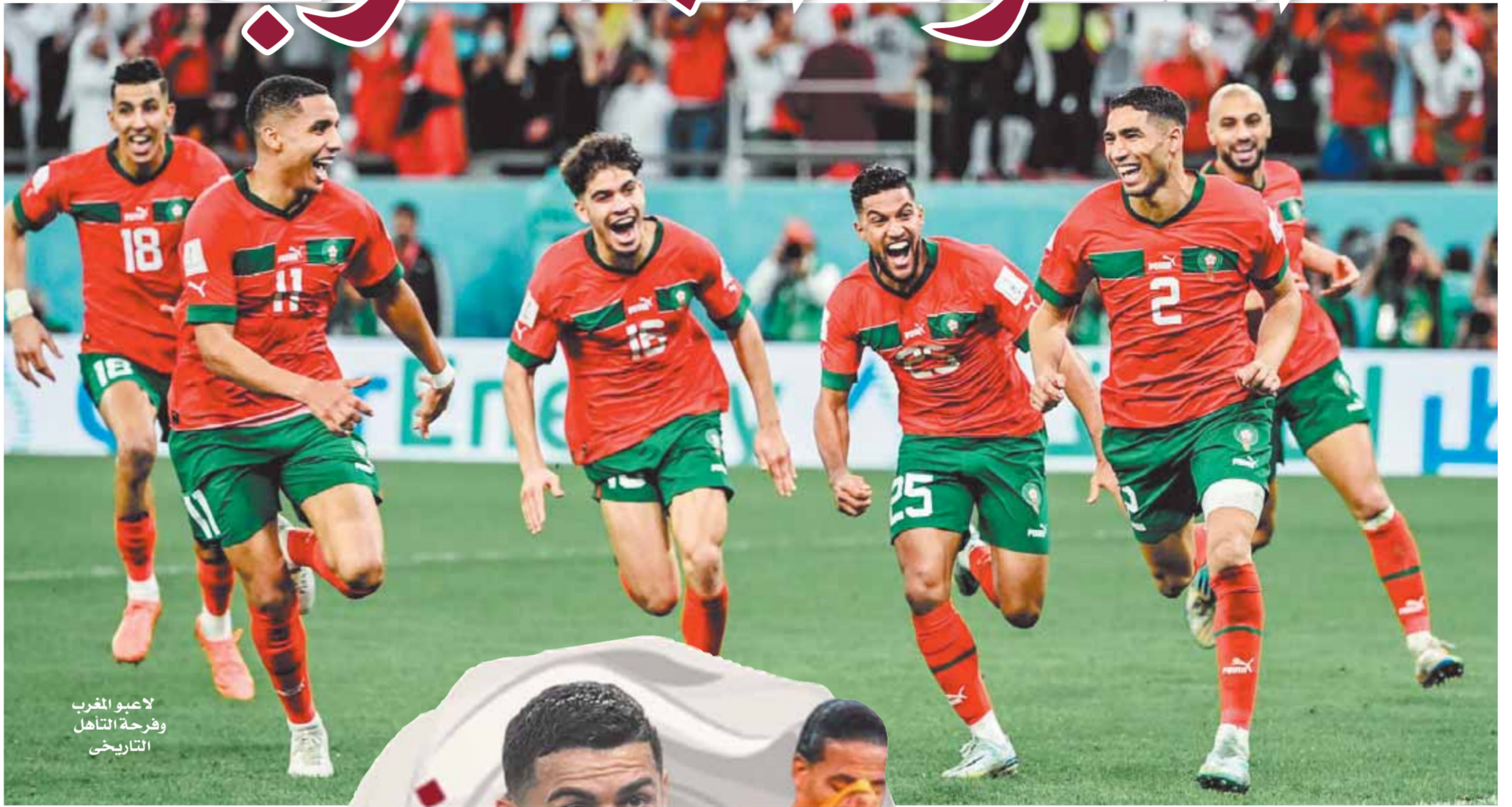
لاعبو المغرب وفرحة التأهل التاريخي