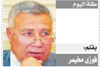
قلم اليوم بقلم: فوزي مخيمر