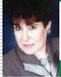
يقلم: سواء السعيد