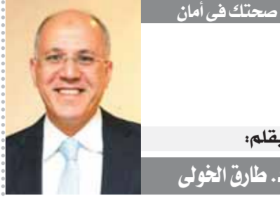
صحتك في أمن