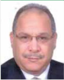
بقلم: حسين حلمي