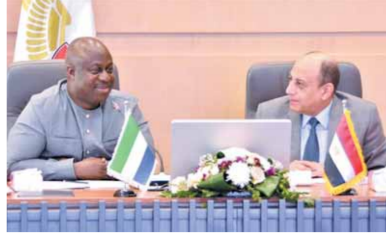
وزير الطيران ووزير النقل السيراليونى خلال المباحثات الثانية بين مصر وسيراليون