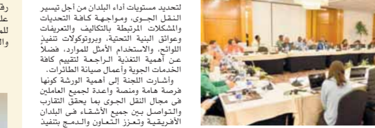
وفود الدول الأعضاء بالكوميسا خلال ختام جلسات ورشة عمل المنظمة

انتهت آخر جلسات ورشة عمل منظمة الكوميسا التى استضافتها وزارة الطيران المدنى بالقاهرة للمرة الثانية على التوالى لهذا العام تحت عنوان «المصادفة حول مراجعة القوانين والقواعد والنواج والسياسات الوطنية للطيران المدنى»؛ وذلك بحضور مشاركن من الدول الأعضاء فى المنظمة وممثلى النقل الجوى والملاح الجوية بسطة الطيران المدنى المصرى والشركات التابعة للوزارة.