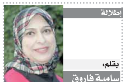
إصطالة بقلم: سامية فاروق

♦♦ مصر القوية، ومخلفات الغرب وجرأتهم تثار العصر أنت غابتي والمار، رغم الصعاب والأزمة التي تلت بظلالها في كل يوم مصر، فإن الجميع يتفق على أن أمن وسلامة مصر هو الغاية والمراد، والحيث المصري والذي هو من نبت هذه الأرض الطيبة، يقف ضامًا أمام أي محاولات لتليل من تراب الوطن.