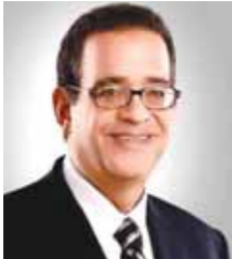
بقلم: طارق عبد العزيز

المصرية. الجندي المعلوم وليس مجهول، الذي نجده حاضراً وبقوة في كل لحظة يستدعيه فيه الوطن. أخذت وزارة الداخلية بقيادة الوزير الكفاء اللواء محمود توفيق، على عاتقها تحمل المسؤولية والعمل دون صخب أو ضجيج، فلقد اعتمدت الوزارة خطة استراتيجية شاملة بكل شفافية وحيادية، تتوعت ما بين عدة محاور منها الاستعدادات والتجهيزات اللوجستية، بالتعاون مع الهيئة الوطنية للانتخابات، أو الخدمات