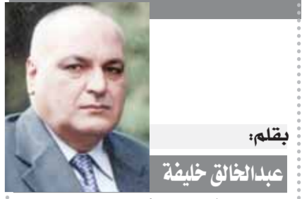
بقلم: عبدالخالق خليفة

عفوًا.. حزب أعداء النجاح شدد الرئيس السيسى على ضرورة أن يحرس المواطن فى أى جهة عمل على مواصلة العمل لتبسيط الدولة قوية وقادرة ولها مكانة بين الأمم وقال: لكن تقدم وتصيح لنا مكانة على الأرض يجب أن نواصل العمل بشكل صادق ونحافظ على كل مبلغ مالى ليكون فى مكانه الصحيح فالدولة مستحبة قوية وقادرة بشعبها وليس فقط بحكومة أو رئيس، جاء ذلك خلال انطلاق فعاليات المنتدى والمعرض الدولى السنوى للصناعة فى دورته الثانية التى نظمه اتحاد الصناعات المصرية فى مركز المنارة للمؤتمرات الدولية.