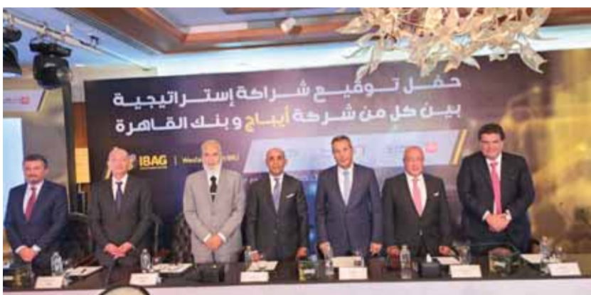
بنك القاهرة ينضم إلى شركة IBAG

الجمهورية وبما يسهم في زيادة تدفقات الأموال الأجنبية بشكل عام وتحسينات آمال المصريين بالخارج بشكل خاص، مع تقديم الخدمات المصرفية لعملاء التحويلات، موضحاً أنه من المقرر بدء الخدمة كمرحلة أولى في مجموعة من فروع البنك على أن يتم تقديم الخدمة بكافة فروع البنك خلال المراحل التالية بما يدعم جهود البنك لتحقيق الشمول المالي وتقديم أفضل مستوى من الخدمات المصرفية للعملاء. وهذا يعزز من البنك تعزيز التكامل بين إبياج والشركات التابعة للبنك في إطار استراتيجية البنك لتنمية وتوقيع الخدمات المقدمة للعملاء.