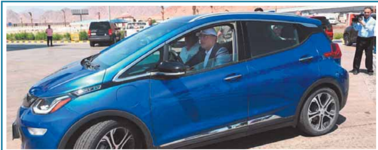
رئيس الوزراء يقود سيارة كهربائية بد شرم الشيخ، فى إطار الاستعداد لقمة المناخ

الإعدام شنقاً لقاتلى الإعلامية شيما جمال 03 الفوضى تتحدى تطوير الدائرى 05