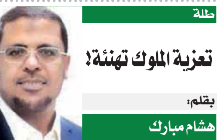
تلمة تعزية الملوك تهنتة! بقلم: هشام مبارك