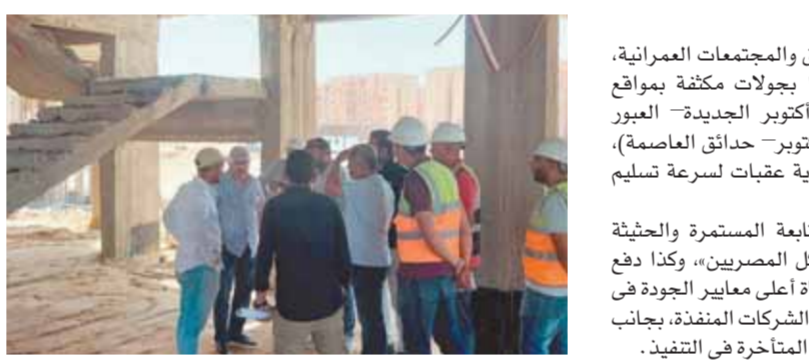
الدكتور عاصم الجزار، وزير الإسكان والمرافق والمجمعات العمرانية، مع وفد من الجهات المختصة فى زيارة لمتابعة أعمال البناء فى إحدى وحدات مشروع «سكن لكل المصريين».