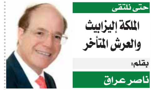
حتى نلتقى الملكة إليزابيث والعرش المتأخر بقلم: ناصر عراق أخيراً خلف الأمير تشارلز قاعة العرش وصار ملكاً لبريطانيا، بعد أن ظل منتظراً هذه اللحظة من قرن إلى آخر، فالرجل بات ولياً للعهد ووريثاً للعرش منذ خمسين عاماً، أما والدته فقد أضحت ملكة بريطانيا العظمى في فبراير ١٩٥٢، وهكذا ظلت إليزابيث الثانية تستمتع بأبهة الملك وسحره بامتداد سبعين سنة متواصلة حتى رحلت في ٨ سبتمبر الجاري بعد أن بلغت ٩٦ عاماً، بينما انبثاقاً في كرسى ولي العهد نصف قرن بأكمله. والسؤال: لماذا لم تتنازل الملكة إليزابيث الثانية عن العرش لأنها قبل عشرين سنة أو حتى عشر سنوات؟ أي وهي في عمر الخامسة والسبعين أو الخامسة والثمانين، حتى يستطيع ابنها ممارسة مهامه الملكية وهو في عمر أكثر حيوية وشباباً. لقد شغلني هذا السؤال وأنا أتابع بثفت أخبار رحيل الملكة، وما استبحت ذلك من تقاليد صارمة في الإعداد للجنائز، مع مراسم صمود ولي العهد إلى كرسى العرش أول أمس. هل خشيت الملكة أن ترتبك أحوال البلاد التي ترأسها لو تنازلت عن العرش؟ إن تاريخ المؤسسة الملكية البريطانية ينفي ذلك، إذ إنه تاريخ راسخ وعتيق منذ قرون، والتقاليد التي تنظم انتقال العرش من ملك إلى آخر مستقرة وثابتة، فلو قررت الملكة التنازل عن العرش لأنها قبل عشرين سنة مثلاً، بسبب اعتلال الصحة أو ما شابه، لطن يلومها أحد، ولعلنا نتذكر أن الملك جورج الثامن تنازل عن العرش عام ١٩٢٦ من أجل الزواج بحيبته المعلقة واليس سيميسون! اللائح أن الملكة إليزابيث لو كانت تنازلت عن العرش لأنها لكانت وفرت عليه توشيح المشاعر الذي اعتراه، حيث اختلط الحزن الشديد بالفرحة الغامرة، فيوم وفاة أمه هو اليوم الذي سيدور فيه ملكاً بنعم بالصلوحيان والجاه والعظمة. ومع ذلك، لم تهب الملكة إليها النعمة التي لا تقدر، وهي أن يحزن على رحيلها بعمق، ويحزن فقط لا أن تختلط مشاعره وتغترتها الفرحة لأنه أمسى ملكاً يوفها! في ظني أن الملكة رفضت أن تهدى ابنها العرش وهي حية لأنها متشبثة بالسلطة، والسلطة شهوة عظيمة من النادر جداً أن يعاندها الإنسان، رجلاً كان أو امرأة، والتاريخ يذكر لنا كم من الأبناء الذكور طردوا أبائهم من عرين السلطة، كما يحدث لنا أكثر من حاكم قتل ابنه، نعم قتل ابنه، حين شعر أن هذا الابن يعمل سراً على إزاحة والده والوقوف إلى كرسى العرش (تاريخ السلطنة العثمانية يحتشد بجرماته مهولة من أجل كرسى العرش، فالسلطان محمد الثالث (١٥٩٥/١٦٠٣) قتل ١٩ من إخوته في يوم واحد. لعل ذلك يفسر إصرار الملكة إليزابيث الثانية على البقاء فوق عرش الملكة حتى رحيلها غير مكتربة برغبات ابنها. إنها الملكة... وما أدراك ما السلطنة!