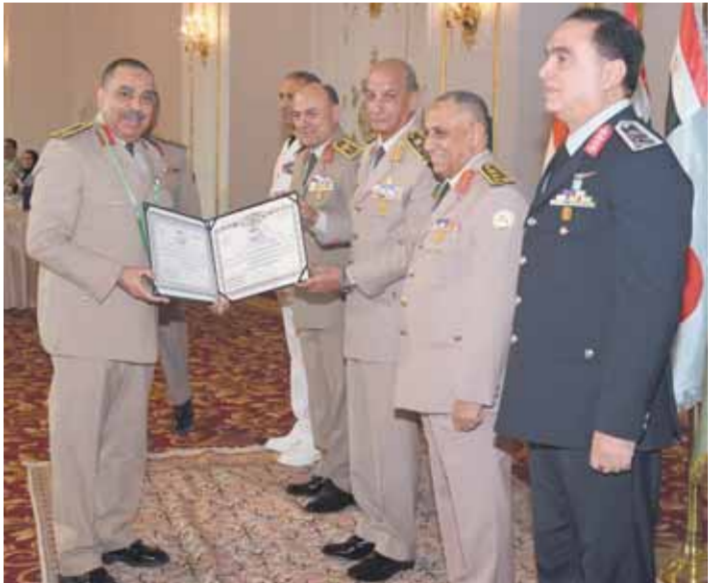
القائد العام للقوات المسلحة الفريق أول محمد زكى يكرم قادة القوات المسلحة المحالين للتقاعد.

والتقى أقدم القادة المكرمين كلمة قدّم خلالها الشكر والامتنان للقوات المسلحة لرعايتها المستمرة والدعم المتواصل الذى تقدمه لهم ولأسرهم، مؤكداً أن القوات المسلحة ستظل دائماً عوناً للقطاعات والوفاء جيلاً بعد جيل، وقام الفريق أول محمد زكى بتقليد القادة المكرمين وسام الجمهورية من الطبقة الثانية، الذى صدق على منحه لهم الرئيس عبدالفتاح السيسى، رئيس الجمهورية القائد الأعلى للقوات المسلحة، تقديراً لجهودهم وتقانيهم فى أداء مهامهم الوطنية طوال مدة خدمتهم بالقوات المسلحة. والتقى القائد العام للقوات المسلحة كلمة نقل خلالها تحيات الرئيس عبدالفتاح السيسى، رئيس الجمهورية القائد الأعلى للقوات المسلحة، وقدم لهم هدايا تذكارية من صنع القوات المسلحة.