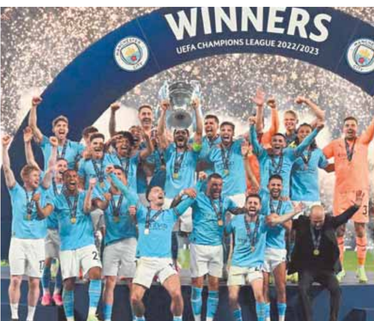
مانشستر سيتي يحصد لقب دوري أبطال أوروبا

وخسر فريق روما أمام نظيره إشبيلية الإسباني في نهائي الدوري الأوروبي، كما خسر فيورنتينا نهائي دوري المؤتمر الأوروبي أمام وست هام يونايتد الإنجليزي، وأخيراً خسر قلب ميلانو أمام بطل البريميرليج، وأكد الإيطالي سيموني إنزاجي مدرب إنتر ميلان، أن فريقه قدم مباراة مثالية رغم الخسارة، ولكننا فخورون بما قدمناه أمام بطل البريميرليج والتشامبيونليج.