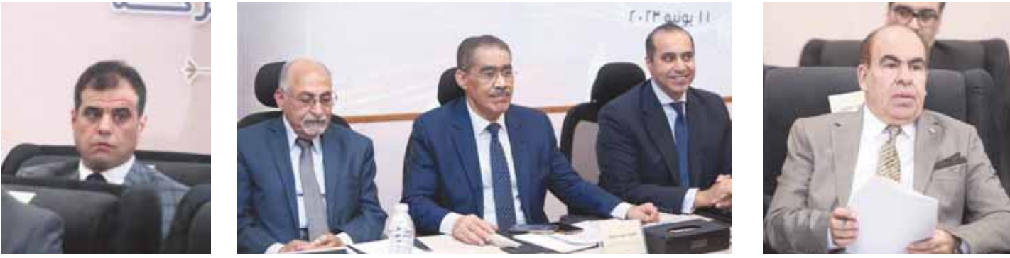
محمد مبروك / تصوير - ملاحث ماهر / د. ياسر الهضيبي