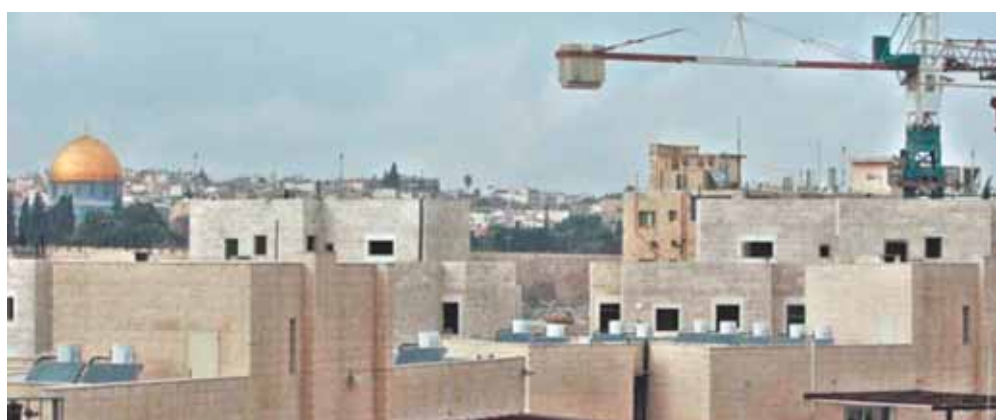
مشاريع الاستيطان تآكل الأراضي الفلسطينية المحتلة

من المستوطنات غير الشرعية، تمتد من القدس المحتلة إلى الحدود الأردنية، مما سيعيق التواصل الجغرافي بين شمال الضفة المحتلة وجنوبها، ويفصلها بشكل تام، وبالتالي يجعل إمكانية قيام دولة فلسطينية أمراً مستحيلًا. وأضاف المكتب الوطني التابع لمنظمة التحرير الفلسطينية: إن هذا البناء يؤكد أن خيار حل الدولتين لم يعد مطروحاً على الطاولة. وحذر التقرير من أن لهذه الخطط عواقب محتملة على التسوية السلمية في المستقبل، لأنها ستشكّل سلسلة من المستوطنات من وسط الضفة الغربية إلى القدس، على نحو