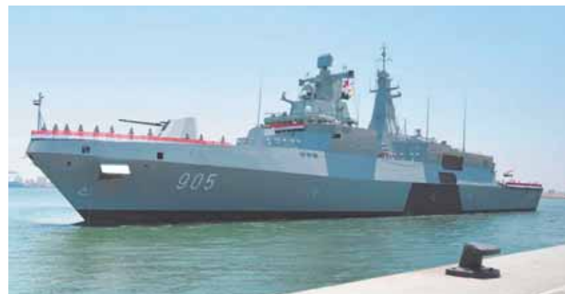
الطائرات الهليكوبتر في تنفيذ استعراض بحري أمام ساحل مدينة الإسكندرية احتفالاً باستقبال الفرقاطة «القهار» كتقليد بحري أصيل. وألقى الفريق أشرف عطوة، قائد القوات

الحربية، لتطابق الفرقاطة لما وصلوا إليه من مستوى متميز خلال فترة الإعداد، والذين أثبتوا أن لدينا من الكوادر من هم قادرين على استيعاب التكنولوجيا الحديثة في تشغيلها وصيانتها والعمل بكفاءة تامة على انظمتها، كما هانهم على سلامة الوصول إلى أرض الوطن، وأوصاهم بأهمية الحفاظ على وحدتهم الجديدة والتدريب الجيد للوصول لأقصى درجات الاستعداد.