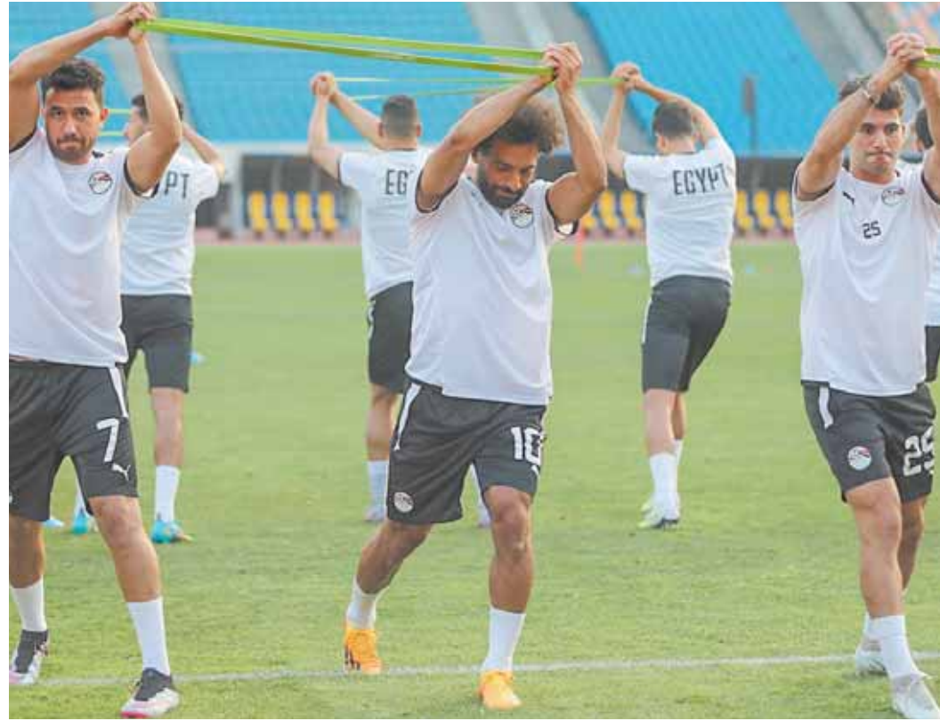
المنتخب جاهز لمواجهة غينيا

ومن المنتظر أن ينضم لاعبو الأهلي اليوم إلى معسكر المنتخب، لكنهم يحصلون على فترة راحة قصيرة وبرنامج استشفاء خاص لتخليصهم من إجهاد مباراة نهائي الأبطال، على أن ينضموا للتدريبات غدًا الثلاثاء.