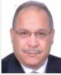
بقلم: حسين حلمي