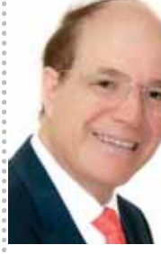
بقلم: ناصر عراق