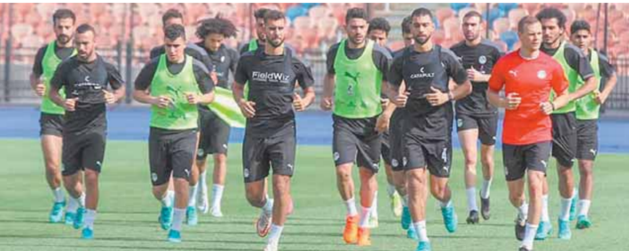
المنتخب يواصل التدريبات استعداداً للقاء كوريا