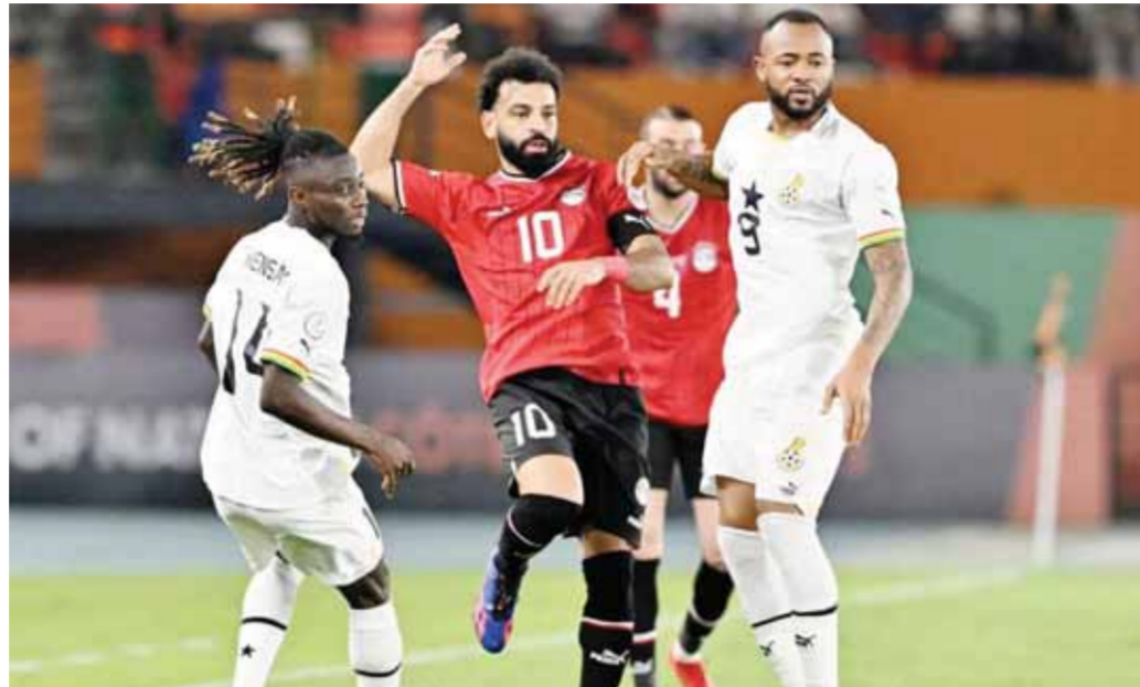
محمد صلاح يقتررب من العودة إلى قائمة المنتخب

اعتقد أن العبث ببرميل بارود الأقصى سيحرق الجميع ولن تقوم لهذا الكيان الغاصب قائمة بعدها، فهذه ليست قضية فلسطينية فقط وإنما قضية عقيدة لاكثر من مليار ونصف مسلم فهل يستطيع عقلاء العرب لحم كياج أولئك الاغبياء المتورطين، قتل الإنسان مآ أخفراً.