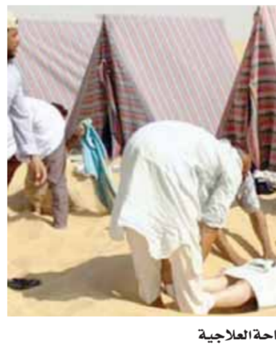
نوع من أنواع السياحة العلاجية