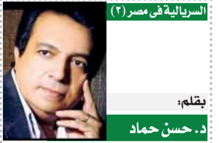
السيرالية في مصر (٢)

أطلقت الفنانة الدكتورة إيناس عبدالدايم، وزيرة الثقافة، والدكتور سالم بن محمد الملك، المدير العام لمنظمة العالم الإسلامى للتربية والعلوم والثقافة «إيسيسكو»، واللواء خالد عبدالعال، محافظ القاهرة، فعاليات الاحتفالات باختيار القاهرة عاصمة الثقافة لدول العالم الإسلامى التي تمتد طوال ٢٠٢٢، وذلك في احتفالية كبرى أقيمت على المسرح الرومانى بسور القاهرة الشمالى بحضور مجموعة من سفراء ومثلى الدول المشاركة في الفعاليات وعدد من أعضاء مجلسى النواب والشيوخ. وقالت عبدالدايم خلال الاحتفالية: اليوم نحتضن بالقاهرة المحروسة عاصمة الثقافة لدول العالم الإسلامى، فهي بلد الألف مئذنة، القاهرة العز، ساحرة الشرق، فجميعها أسماء وألقاب تشير لبقعة مضيئة في خارطة العالم، تحمل شعلة الحضارة، وأمجاداً حية، وهي حاضنة تنوع ثقافى فريد، قدمت للعالم نموذجاً حضارياً في التعايش الإنسانى باقياً حتى اليوم، فاستمتقت أن تكون منارة الثقافة والتثوير عبر العصور. وأضافت عبدالدايم أن وزارة الثقافة المصرية