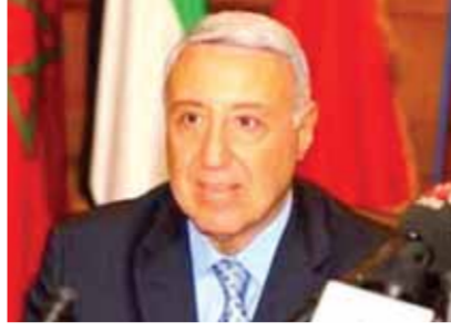
المستشار بولس فهمي

كتبت - إيمان إبراهيم: أصدرت المحكمة الدستورية العليا بجلستها أمس برئاسة المستشار بولس فهمي، عدداً من الأحكام المهمة، حيث أقرت المحكمة بأن قواعد التوزيع الإقليمي للطلاب الحاصلين على الشهادات التوزيعية المتقدمين للالتحاق بالجامعات الحكومية في العام الجامعي ٢٠١٤/٢٠١٥، تناقض أحكام الدستور.