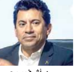
د. أشرف صبحي

من جميع محافظات الجمهورية، سعيًا لمواجهة الشائعات وإعلاء لروح الولاء والانتماء لدى الشباب من خلال التدريب المكثف على مواجهة الشائعات، ونشر ثقافة الأمن القومي، وذلك على أيدي نخبة من الأساتذة المتخصصين في تلك المجالات، ودعا الوزير الشباب للمشاركة في وحدة «تصدوا معنا» من خلال المنصات الإلكترونية الرسمية التابعة للوزارة، في إطار تكوين قاعدة عريضة من الشباب المُتدرب على التحليل والتدقيق من كل ما يتم عرضه وتداوله من معلومات وأخبار بعيدة كل البعد عن الحقيقة، ونشر التوعية بين نظراتهم الشباب بأليات مواجهة الشائعات، في ضوء بناء الدولة المصرية والتوجه للجمهورية الجديدة.