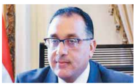
د. مصطفى مدبولي

والرهن عقود وتسجيل الأراضي، وتخفيض الرسوم الحكومية من ٧٥٪ إلى ٢٪ على الآلات والمعدات اللازمة للتشغيل، واتاحة نسبة ٢٠٪ من الأراضي الشاغرة في المناطق الصناعية والساحية والمجمعات العمرانية وأراضي الاستصلاح الزراعي. وفي إطار مبادرة «دعم الصناعة الوطنية وإقامة المجمعات الصناعية الجوهزة» التي أطلقها السيد الرئيس عبدالفتاح السيسي في شهر أبريل ٢٠٢٢، أكد ياسر رحمن، في تقريره، أن جهاز تنمية المشروعات يوفر كافة أوجه الدعم لأصحاب المشروعات الصناعية المتوسطة والصغيرة داخل المجمعات الصناعية وخارجها، وتشمل المساعدة في استخراج المستندات القانونية والتراخيص، وتقديم قروض ميسرة لتلك المشروعات، وخدمات تنمية الأعمال، فضلاً عن وضع آلية لإقالة التعثر من حيث إعادة الجدولة وتقديم قروض مكملة وإضافية. ويسهم جهاز تنمية المشروعات في تنفيذ المبادرة الرئيسية «حياة كريمة»، حيث يرأس الجهاز «لجنة التنمية الاقتصادية والصغيرة» وتوفر فرص العمل، وإن لجنة فرعية تابعة للجنة الرئيسية لتتبع تنفيذ المبادرة، ويقوم الجهاز بإعداد دراسات ميدانية حول ١٥٠ قرية مستهدفة من المبادرة، وإعداد ١٥٠ دراسة جوي للمشروعات الصغيرة التي يمكن تنفيذها في المحافظات المستهدفة كمرحلة أولى، وأوضح ياسر رحمن، أن