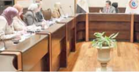
وزير الصحة يبحث مع الوكالة الأمريكية للتنمية مجالات التعاون الطبي

كتب- إيمان الجندى: ناقش الدكتور خالد عبدالغفار، وزير الصحة والسكان، مع ليزلى ريد، مدير الوكالة الأمريكية للتنمية الدولية في مصر (USAID)، والوفد المرافق لها، مجالات بحث التعاون في القطاع الصحي. تم خلال اللقاء مناقشة أوجه التعاون والدعم القائم مع الوكالة منذ ٤٠ عاماً، ومواصلة التعاون في مزيد من المشروعات التي تقدم خدمات الرعاية الصحية المستدامة بما يعود بالنفع على الصحة العامة والمواطن المصري.