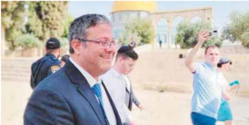
وين غفير يواصل تهديده ضد الفلسطينيين

وأوضح الجنرال المتقاعد حالوتس: «معروف أن بن غفير ارتدى ملابس تشبه ملابس المجرم