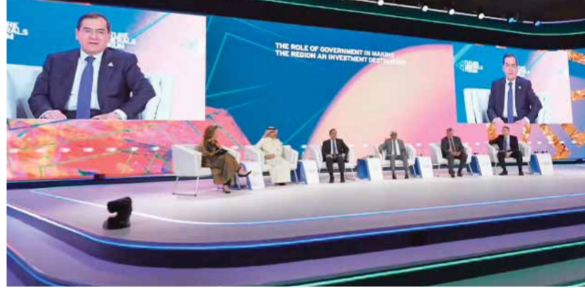
وزير البترول طارق الملا في جلسة وزارية

قال المهندس طارق الملا، وزير البترول والثروة المعدنية، إن قطاع التعدين المصري مستمر في عمليات التطوير، ويسعى لأن يصبح ٢٠٢٣ عاماً مميزاً في هذا المجال، وجذب المزيد من شركات التعدين العالمية وتطوير الشركات مع المستثمرين العالميين في مجال التعدين والاستثمار في إجراء عمليات تطوير البنية التحتية التي تعد عاملاً جاذباً للاستثمارات. وأكد الوزير، خلال مشاركته في جلسة وزارية بعنوان «دور الحكومات في نهضة المنطقة كوجهة جاذبة للاستثمار في إنتاج المعادن» ضمن فعاليات مؤتمر التعدين الدولي الثاني الذي يقام حالياً بالمملكة العربية السعودية، أن مصر مهتمة بالتوسع في مشروعات التصنيع من الخامات