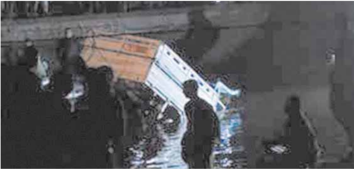
حطام السيارة بعد انتشالها

وتقدم مجلس إدارة الاتحاد العام لبرئاسة جبالى المراغى بالزعامة إلى أسر العمال ضحايا غرق السيارة، وجاء فى بيان رسمى أن الضحايا من العمال كانوا فى طريق عودتهم من مزرعة يعملون بها، فصعد قائد السيارة «معبراً غير مرخص» فوق مياه النهر «معدية»، ولم يتمكن من السيطرة على السيارة فسقطت بالمياه، وحسب المعلومات الأولية أسفر الحادث عن وفاة اثنين من مستقليها، وفقد ثمانية آخرين ما زال البحث جارياً عنهم، بينما انتشل أربعة عشر آحياء.. وقد ألت قوات الشرطة القبض على قائد السيارة وثلاثة من العاملين بالمعبر غير المرخص، وجار ضبط مالكه.