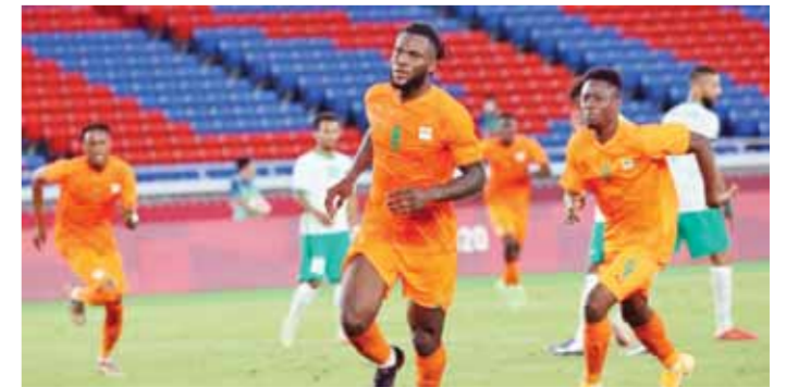
الأفيال الإفريقية تبحث عن ضربة بداية قوية