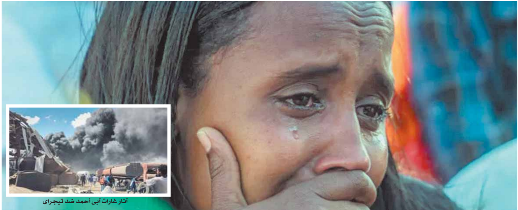
انار غارات أبي أحمد ضد تيجراي