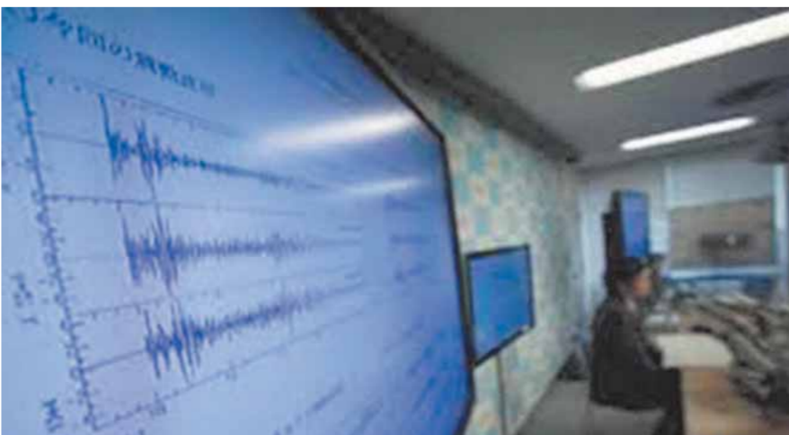
مركز رصد الزلازل

أتمنى أن تصل هذه الرسائل المهمة إلى الفريق كامل الوزير وزير النقل، لسرعة التدخل وإصلاح عيوب الطريق الإقليمى الأسبوطى، وطريق مصر أسبوط الزراعى مع سرعة استئناف العمل بكوبرى التناجزة المؤدى إلى المربوطية، وعمل مخرج لطريق المربوطية لتخفيف الضغط المرورية على طريق مصر أسبوط، حيث إن عدم إتمام الكوبرى تسبب فى زحام يومية بالساعات أمام كوبرى الدكى بأبورجوان القبلى بالبدريشين.