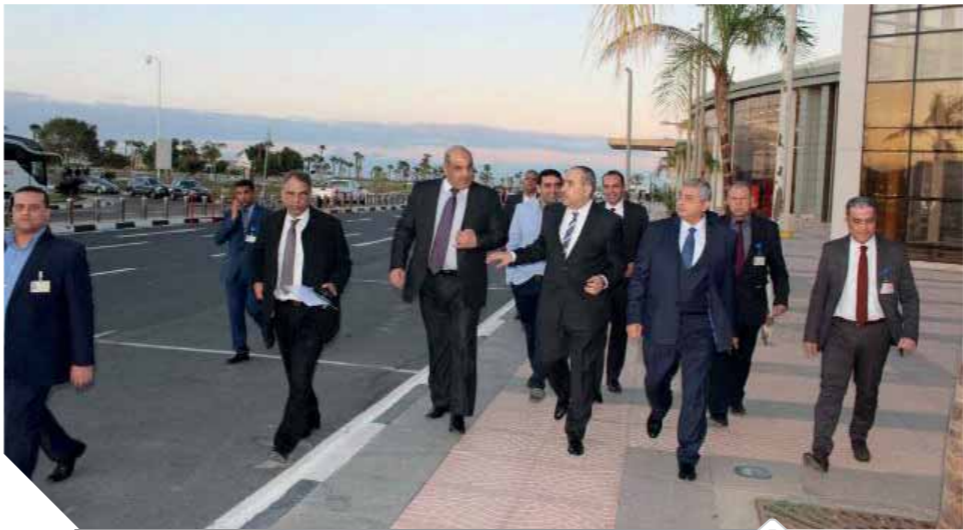
وزير الطيران ونائبه ومدير مطار شرم الشيخ خلال تفقدهم المطار