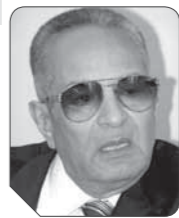
بهاء الدين أبوشقة

ومن خلال العرض السابق للإصلاح القضائي الذي تناولناه، لا بد أن ندرك أن الهدف الرئيسي من هذا الأمر هو خدمة المواطن بالدرجة الأولى، وحدث انضباط في الشارع، وهذا لن يحدث إلا من خلال النصوص التشريعية التي تحقق الفلسفة العقابية المبنية على الردع والزجر، وهذا الانضباط المطلوب في الشارع له جوانب عديدة وكثيرة، بحيث يحقق ما يريده المواطن والدولة فيما تصبو إليه من المصلحة العامة. من هذه الجوانب المهمة التي يجب أن تشملها الثورة التشريعية وضع النصوص التي تحمي المواطن من الارتفاع في الأسعار ووقف الانفلات الشديد في الأسواق. وهذا ما قامت به اللجنة التشريعية في قانون حماية المستهلك لأن النصوص القانونية لا بد أن تحكم العلاقة بين المواطنين والأسواق وبين التاجر والمنتج بعيداً عن العشوائية الموجودة الحالية التي أرهقت المواطنين بشكل خطير. كما أنه لا بد من وجود نصوص تشريعية جديدة تمنع هذا الجشع الذي يمارسه التجار جهاراً ليلاً ونهاراً، ويصاب في نهاية المطاف بحالة إحباط شديدة.