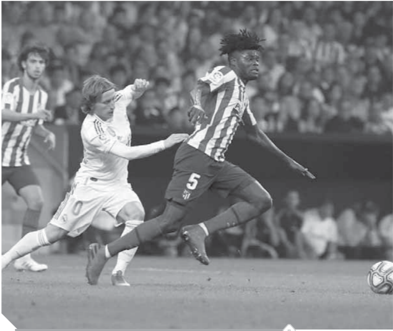
مواجهات ريال مدريد وأتلتيكو تتسم بالندبة