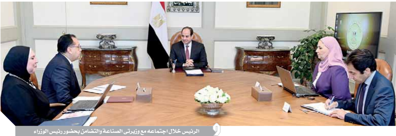
الرئيس خلال اجتماعه مع وزيرتى الصناعة والتضامن بحضور رئيس الوزراء