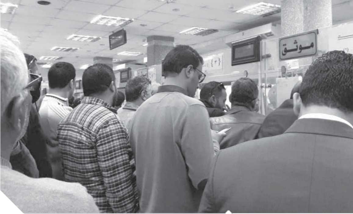
زحام كبير داخل مكاتب الشهر العقاري