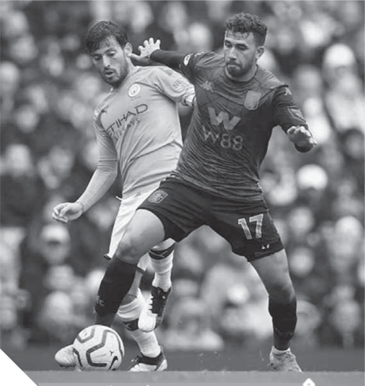
تريزيجه، يسعى لمواصلة تألقه مع أستون فيلا

بينما يتوقع أن يدخل أتلتيكو مدريد بتشكيل مكون من: يان أوبلاك فى حراسة المرمى، وفى الدفاع: رينان لودى، فيليبى، ستيفان سافيتش، كيران تريبييه، وفى الوسط: ساؤول، توماس بارتى، هيكتورهيريرا، أنخيل كوريا، وفى الهجوم: جواو فيلكس، ألفارو موراتا.