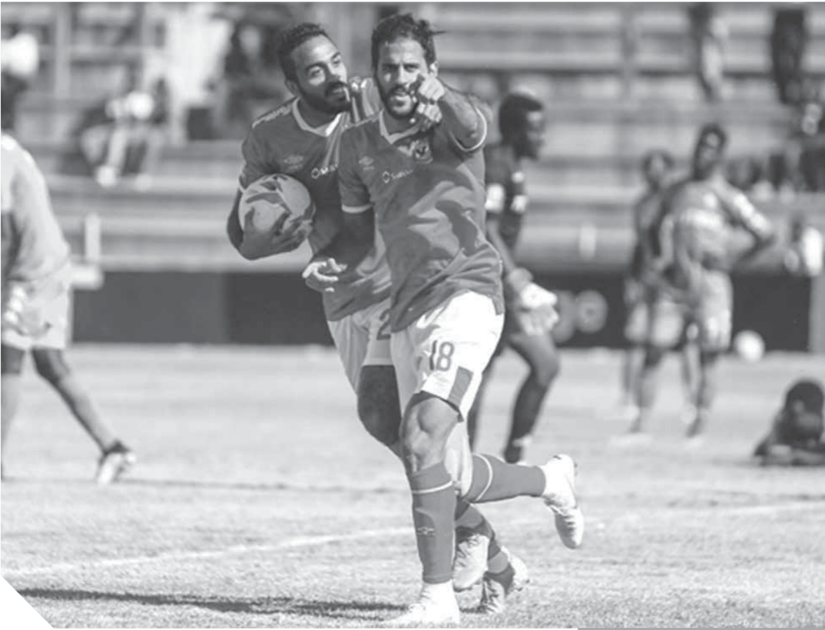
أداء متواضع للأهلى أمام بلاتينيوم

الشياك وهات وخد بين كهربا ومروان محسن ويسدد الأخير تلمس أحد المدافعين إلى الركنية.