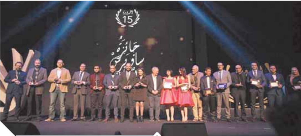
الفازون بجوائز مسيح ساويرس الثقافية