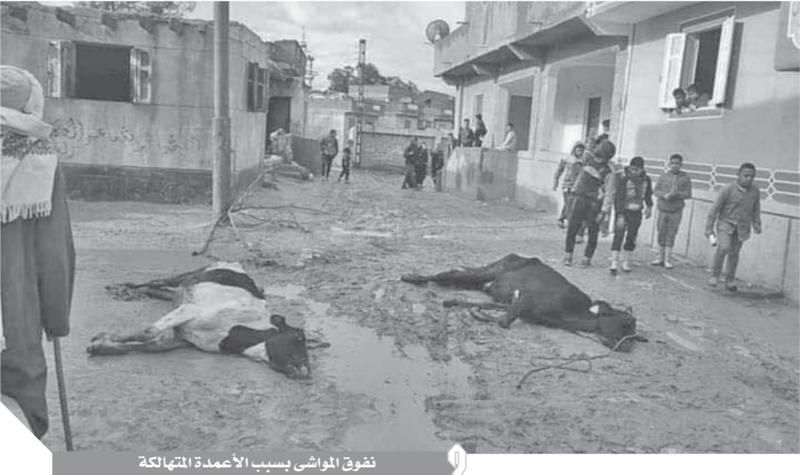
نثوق المواشى بسبب الأعمدة المتهاكة

الذين يعيدون الكرة مرة أخرى مطالبا بسن قوانين صارمة لأسحاب التوصيلات الكهربائية العشوائية حفاظا على أرواح الأهالى.