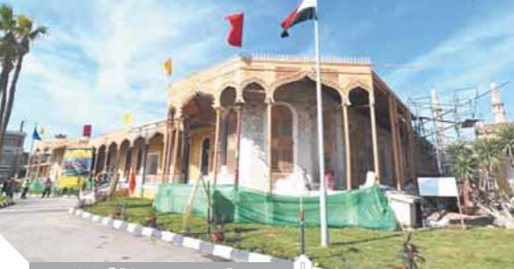
استراحة ديليبس بيئنة قناة السويس

ويشمل المشروع أعمال مدنية وترميم أثرى للحوائط والشبكات الأرضية، وإزالة المبانى المستحقة وإقامة إنشاءات جديدة بجانب ترميم وتركيب واستبدال التالف من القرميد المبنى بمسطح ٦٠٠٠ متر مربع، والتحويل المبنى من ١٤٥ قاعة إلى ٨٥ قاعة بجانب الأعمال الكهروميكانيكية.