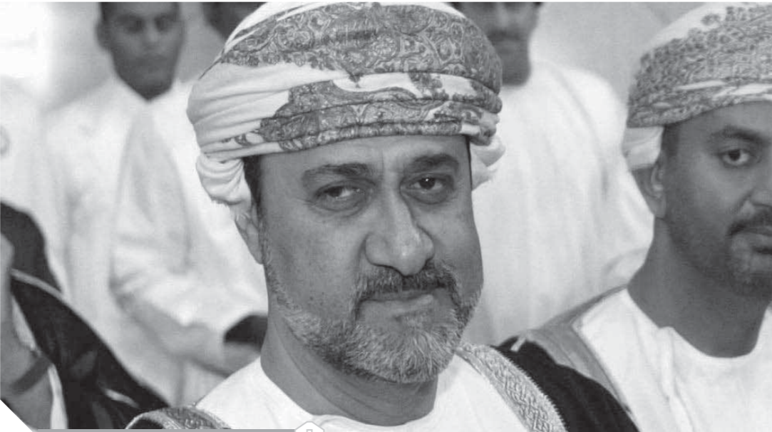
السلطان هيثم بن طارق آل سعيد

لواء سعد الجمال عضو مجلس النواب نائب رئيس البرلمان العربي