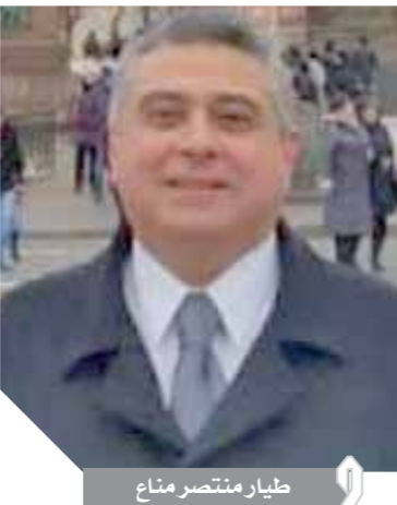
طيار منتصر مناع

إعادة تشغيل خط الطيران بين مدينة شرم الشيخ ولندن لتشجيع الحركة السياحية الإنجليزية والتي تعد مقصداً سياحياً هاماً للشعب البريطانى وذلك بعد قرار استئناف الرحلات البريطانية إلى شرم الشيخ. كما اتفق الوزيران على التعاون والتنسيق المستمر وتسخير كافة الجهود من أجل الترويج السياحى الدائم ودفع الحركة السياحية الوافدة من خلال إطلاق المبادرات وبرامج التحفيز لشغلى الرحلات والوكلاء السياحيين. ومن جانبه أكد الطيار محمد منار أن وزارة الطيران المدني وشركاتها التابعة تحرص على تطوير الخدمات المقدمة للمسافرين عبر المطارات المصرية لإظهار الوجه الحضارى المشرف الذى يليق بمكانة مصر أمام العالم، مشيراً إلى أن السياحة والطيران وجهان لعملة واحدة حيث يعدان من أهم مصادر الدخل القومى المصرى، مؤكداً ضرورة وضع أجندة مشتركة خلال الفترة القادمة وتوحيد الجهد والفكر والتعاون الوثيق مع جميع الشركاء المعنيين بهذه الصناعة لضمان منتج سياحى متميز والنهوض بقطاعى السياحة والطيران. وأضاف أن القيادة السياسية تولى اهتماماً كبيراً بتذليل جميع العقبات أمام المستثمرين بقطاعى الطيران والسياحة والآثار والعمل على حلها بشكل سريع من خلال اللقاءات الدورية والتعاون بين الوزارات المعنية والمستثمرين من أجل زيادة الحركة السياحية وتقديم برامج سياحية متنوعة ومكاملة ترضى جميع ضيوف وزائرى جمهورية مصر.