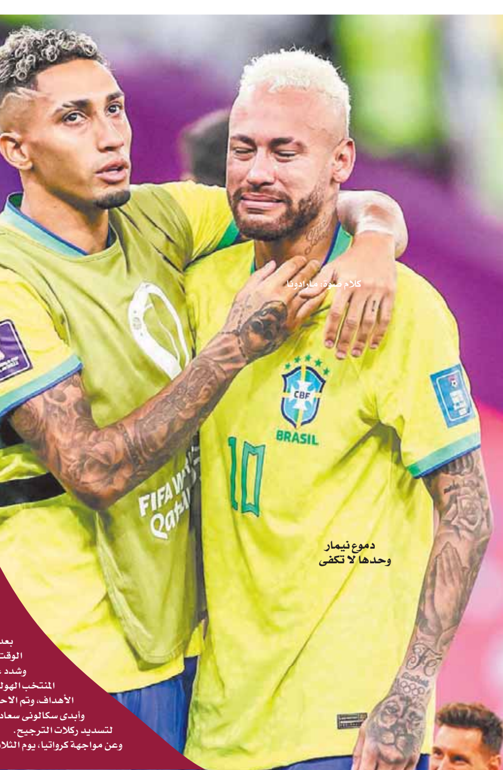
كلام مع نيمار

«تيتي» يختار الرحيل.. و«نيمار» يلّمح للاعتزال الدولي