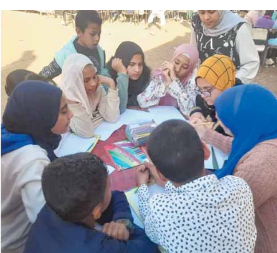
تحت إشراف: خالد حسن