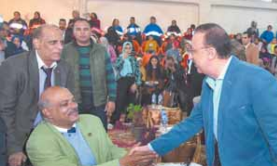
تحت إشراف: خالد حسن

الإسكندرية - شيرين طاهر: افتتح اللواء محمد الشريف محافظ الإسكندرية، اليوم العالمى لذوى الهمم لعام ٢٠٢٢ تحت عنوان «المجتمع المدنى ومكتسيات قانون الأشخاص ذوى الاعاقه» والتي تم تنظيمها تحت رعاية وزارة التضامن الاجتماعى ومحافظة الإسكندرية بالتعاون مع إحدى مؤسسات المجتمع المدنى (جمعية قرية الأمل للتنمية والتأهيل الاجتماعى للمعاقين) وذلك بإستاد الإسكندرية الرياضى الدولى. أكد اللواء محمد الشريف أن الرئيس عبدالفتاح السيسى، كان له الفضل الأول فى الاهتمام بذوى الهمم على مستوى المؤسسات والوزارات والمحافظات والمجتمع المدنى، مشيراً إلى الدعم الذى توليه الدولة وخاصة بعد إطلاق الرئيس عام ٢٠١٨ عاماً لذوى الهمم. وأضاف أن المحافظة حرصت على اتخاذ العديد من المبادرات الرائدة للاهتمام بذوى الهمم وتوفير احتياجاتهم على كافة الأصعدة، لافتاً إلى أن ما تم تنفيذه لصالح ذوى الهمم بالمحافظة هي حقوق لهم وليست مكتسيات. وقدم المحافظ الشكر لمؤسسات المجتمع المدنى المتمثلة فى جمعية قرية الأمل وجميع المشاركين فى الفعاليات وكل من ساهم بجهود رمزية لصالح ذوى الهمم، مشيداً بدور المجتمع المدنى فى دعم جهود الدولة.