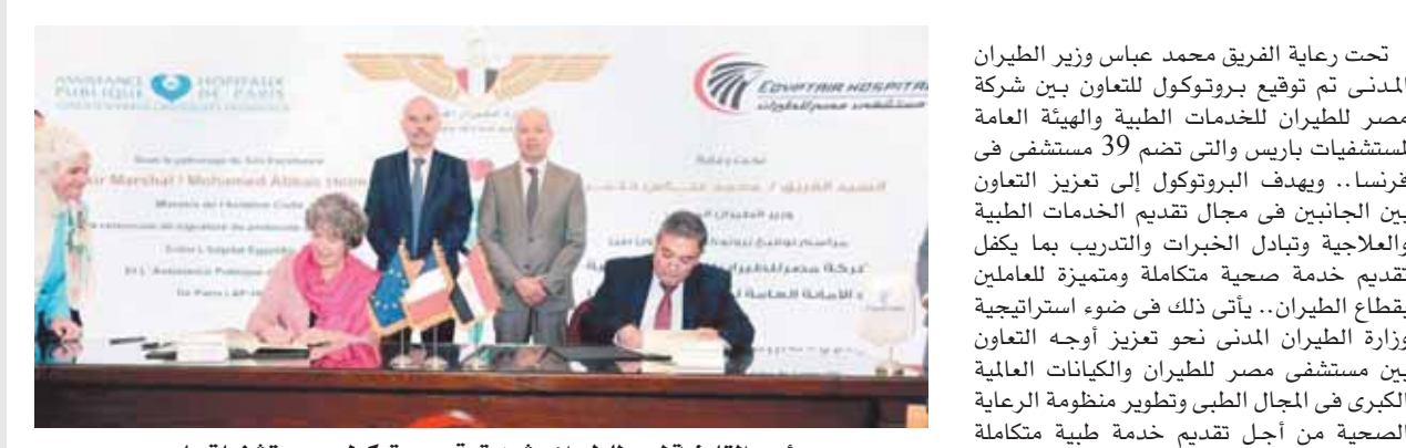
رئيس القابضة لمصر للطيران يشهد توقيع بروتوكول مع مستشفيات باريس