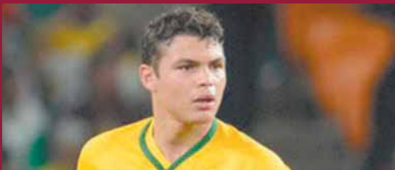
أكد تياجو سيلفا، مدافع منتخب البرازيل أن راقصى السامبا لا يستحقون الخسارة بأي حال أمام كرواتيا.

وأشار سيلفا في تصريحات لـ«الوفد»، إلى أن الأرقام تؤكد أن فريقه صنع العديد من الفرص أمام مرمى كرواتيا. وأضاف: «سجلنا هدفاً من عدة فرص سحقت لنا بينما سجل منتخب كرواتيا هدفاً من هجمة مرتدة ولكن هذه كرة القدم».