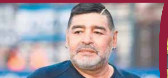
يقا تل لاديو منتخب الأرجنتين من أجل استعادة بطولة كأس العالم الغائب منذ عام ١٩٨٦.

وتخفي منتخب الأرجنتين عقبة هولندا بضربات الترجيح بنتيجة ٣-٤ بعد التعادل بنتيجة ٢-٢ في ربع النهائي ليضرب راقصو التانجو موعداً مع كرواتيا في نصف النهائي.