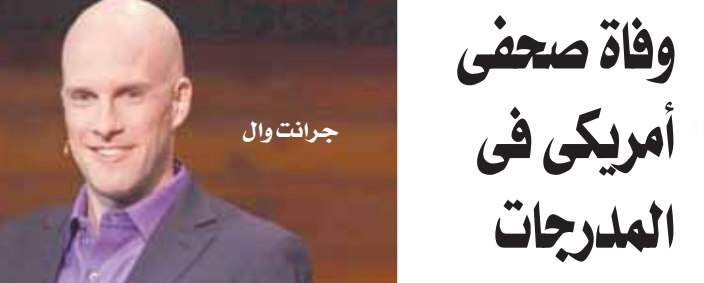
توفي الصحفي الرياضي الأمريكي الشهير جرانت وال، أثناء تغطيته لمباراة الأرجنتين وهولندا في دور ربع نهائي كأس العالم قطر ٢٠٢٢، في ستاد لوسيل.

خطف الأخطبوط الكرواتي دومينيك ليفاكوفتش حارس مرمى منتخب بلاده الأضواء بعدما تعلق للمباراة الثانية على التوالي وقاد الكروات للوصول إلى نصف نهائي كأس العالم. وتعلق ليفاكوفتش في مباراة اليابان وتصدى لثلاث ركلات ترجيح ليقود المنتخب الكرواتي إلى ربع النهائي ثم تصدى لمحاولات برازيلية خطيرة قبل أن يتلقى في ركلات الترجيح وتصدى لضربة ويساهم في تأهل منتخب بلاده.