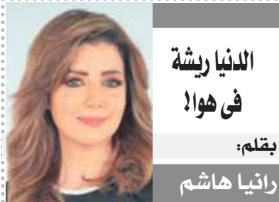
الدنيا ريشة في هواها بقلم: رانيا هاشم

من أجمل الكلمات التي عبرت عن الدنيا بصورة حقيقية.. كلمات أغنية الدنيا ريشة في هوا.. لأنها تشعرك أن الدنيا تأخذك وتطير بك وتحركك كيفما تشاء!! وللأسف كثيرون يترون الدنيا تحركهم بعيداً ويساراً مستمتعين بها وكل تركيزهم عليها وعلى المنافسة بينهم وبين الآخرين، بمعنى من سيتحرك أكثر ومن سيكون الأبرز والأفضل في الدنيا فيجري ويجري لكي يقدم أكثر، ومن أن ينهت أن الدنيا فانية وأن الأخرة أبقي وأغنى وأعلى هنا أتنا نسعى في الدنيا ونشعر بتسويق الوقت، وقد ننسى مواعيد عائلتي نجتمعنا بأسرنا بحجة أن الوقت ضيق للأسف أحياناً تأخذنا الدنيا ونساع الأخرة.. فننظر للارض.. ولا ننظر للسماء.. ونساع في الحياة وننسى أن الفرح والحل كله بيد الله!