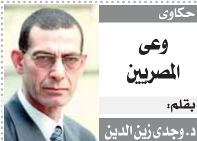
حكاوى وعى المصريين بقلم: د. وجدى زين الدين

وأنهار وال في منصبه الإعلامي في الدقائق الأخيرة من المباراة التي حسمتها الأرجنتين بركلات الترجيح بسبب الإعياء.