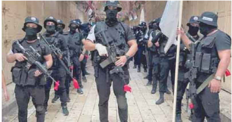
عرين الأسود تستعرض قوتها وتواصل مقاومتها ضد الاحتلال الإسرائيلى

الأنحاء البيقطة وإبقاء الأيدي على الزناد، مضيفة: «سناحورهم بالدم والرمصاص بالغة التى لا يفهمون غيرها، هذا هو العهد، وهذا هو التسليم، ونقسم بالله العظيم لن نترك السلاح حتى آخر مقاوم منا وآخر جندي وآخر رصاصه، هذا قسم من يعلمهم العدو من جنودنا ومن لا يعلمهم». وكشفت مصادر إسرائيلية عن أن تل أبيب هدت الحكومة اللبنانية بصفحة مطار بيروت، إذا جرى استخدام لعماله لقتل ما وصفته بتهرب إسرائيلى، مثلما فعلت مع سوريا. وقالت المصادر الإسرائيلية إنها كانت على علم بأن إيران تحاول استخدام ممر تهرب جديد عبر بيروت بعد فشل ممر دمشق، وإن تل أبيب تتحرى عن محاولة طهران تهرب أسلحة من خلال رحلات مدنية على طائرات إيرانية إلى مطار بيروت.