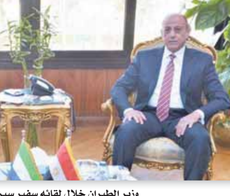
وزير الطيران خلال لقائه سفير سيراليون بالقاهرة

سفير سيراليون، نتطلع لعلاقات تعاون والاستفادة من الخبرات المصرية في ظل النهضة الشاملة للدولة المصرية