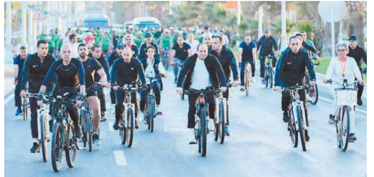
كتب - ناصر عبدالمجيد: قام الرئيس عبدالفتاح السيسي، أمس، بجولة تفقدية بالدراجة في مدينة شرم الشيخ، تفقد خلالها المنطقة الخضراء الصديقة للبيئة التي تشهد العديد من الفعاليات والأنشطة خلال انعقاد القمة العالمية للمناخ.