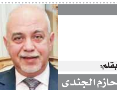
بقلم: حازم الجندى