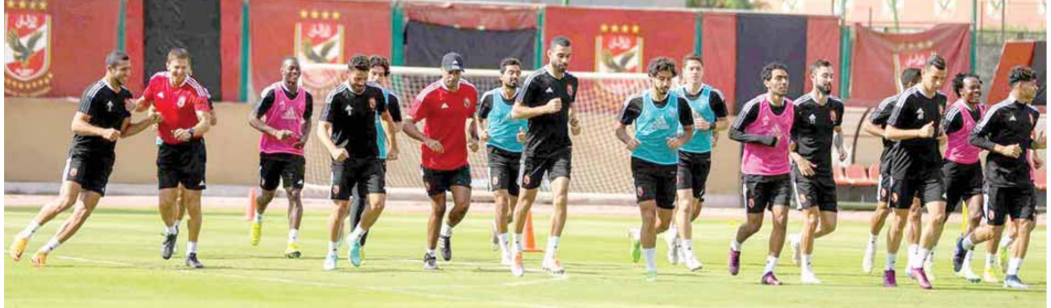
الأهلي يستأنف تدريباته الأحد