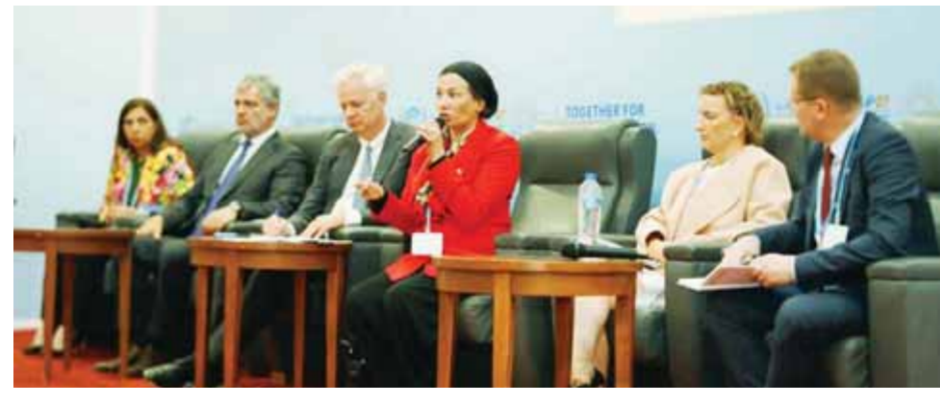
البيئة المنسق الوزارى ومبعوث مؤتمر المناخ COP27، مركز الاستدامة، شنائير إلكتروك، نيابة عن رئيس مجلس الوزراء، وذلك على هامش مؤتمر المناخ COP27 المعقود في مدينة شرم الشيخ بحضور اللواء خالد فودة، محافظ جنوب سيناء، والفريق كامل الوزير، وزير النقل، ومارك باريتي، السفير الفرنسى، والمهندس خالد عباس، نائب وزير الإسكان والرئيس

التفندي لشركة العاصمة الإدارية الجديدة، وعدد من مثلى رجال الأعمال والقطاع الخاص وشركاء التنمية والإعلاميين. وأكدت وزيرة البيئة أن إطلاق مركز الاستدامة يؤكد أن الدولة المصرية بكل أجهزتها تعطي نماذج تنفيذية للعالم على كل السنوات للتصدي لأثار التغيرات المناخية، وبمبادرة الجهود المصرية لتسريع وتيرة العمل المناخي من خلال دمج وإشراك القطاع الخاص والعام. وشاركت الوزيرة في الحدث الجانبى المقام بالمنطقة الخضراء «الشباب والابتكار». طلاب الجامعات والعمل المناخي، بمشاركة مجموعة من شباب الجامعات وممثلي الوكالة الأمريكية للتنمية وممثلي جامعة القاهرة، كإحدى الفعاليات التي تعكس اليوم الموضوعى للشباب الذى تدور والتقت وزيرة البيئة مع مايكل ريجان، مدير وكالة حماية البيئة الأمريكية (EPA)، ضمن فعاليات اليوم الرابع من مؤتمر المناخ. وأوضحت الدكتورة ياسمين فؤاد، وزيرة البيئة، أن الاجتماع بحث التعاون بين الجانبين للإعلان عن تعزيز تعاون مشترك بين الجانبين المصرى والأمريكى في مجال حماية البيئة ومكافحة التغيرات المناخية، وأكد الطرفان التزامهما بأهمية التعاون الثنائى لتحسين الوضع البيئى على أساس إقليمي أو متعدد الأطراف، وتعزيز التعاون بين الجانبين لتطوير حلول مستدامة ودائمة لحماية البيئة والتصدي لتغير المناخ.