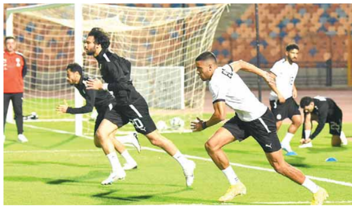
جدية في تدريبات المنتخب قبل موقعة بلجيكا