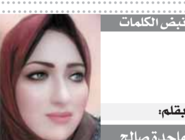
بقلم: ماجدة صالح