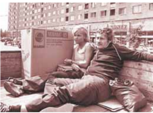
من فيلم «الناس الجاهزة»

لازال تار يعمل أكثر من أي وقت مضى في مصنع الأفلام التابع لإكاديمية سراييفو للأفلام، وهو مختبر لصانعي الأفلام الشباب الذي أسسه في عام ٢٠١٢ بهدف تثقيف صانعي الأفلام الناشئين، الذين يتكرومون موسوية، بروح الإنسانيته، الفنانون الذين لديهم نظرة فريدة، وشكل فردي للتعبير ويستخدمون قوالبه الإبداعية في الدفاع عن كرامة الإنسان داخل الواقع الذي يحيط بنا.