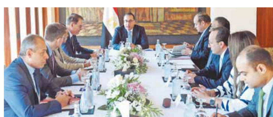
مصر، لتحويل المبنى الجديد لديوان عام محافظة جنوب سيناء، وبنى مستشفى شرم الشيخ، إلى مباني ذكية مستدامة لتحقيق أعلى معدلات الفاعلية، وتقليل معدلات إهدار الطاقة للمباني، من خلال المساهمة في تحقيق

التميز التشغيلي، وبما يضمن الاستدامة الإدارية والبيئية للمؤسسات الحكومية. كما شهد رئيس مجلس الوزراء توقيع مذكرة تفاهم لاستضافة مصر وتنظيمها لأعمال الدورة العاشرة لقمة المدن الإفريقية عام ٢٠٢٥. بحضور فاطمة عبدالمالك، رئيسة منظمة المدن والحكومات المحلية المتحدة الإفريقية، ووزير الدولة هشام أمانة، وزير التنمية المحلية، ممثلًا للحكومة المصرية، ورجان بيبر مباسي، الأمين العام لمنظمة المدن والحكومات المحلية المتحدة الإفريقية، ممثلاً للمنظمة. وأعرب رئيس الوزراء عن سعادته باستضافة مصر لأعمال الدورة العاشرة لقمة المدن الإفريقية عام ٢٠٢٥، مؤكداً أن ذلك يأتي لدعم وتعزيز أطر التعاون والتنسيق على المستوى الإفريقي في مختلف المجالات والموضوعات ذات الأهتمام المشترك، وتنفيذاً لتوجيهات الرئيس عبدالفتاح السيسي، رئيس الجمهورية، مشيراً إلى دور تلك القمة في دعم جهود التوسع في تطبيق مفاهيم اللامركزية على مستوى قارة إفريقيا، وذلك بما يعزز دور الحكومات في جهود تنمية القارة في مختلف المجالات، ويسهم في تحسين إدارة الشؤون العامة على مستوى المدن والأقاليم.