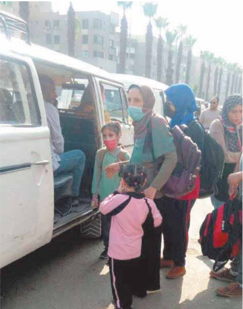
تكدس أولياء الأمور والطلاب لركوب الميكروباص من أمام إحدى المدارس