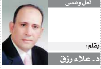
بقلم: د. علاء رزق