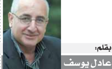
بقلم: عادل يوسف