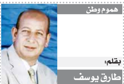
بقلم: طارق يوسف

وأوضح المستشار النمساوي كارل نيهامر أن بلاده ترتب لإجلاء مواطنيها من إسرائيل، وقاتم هنغاريا بإجلاء ٢١٥ مواطناً من تل أبيب على متن طائرتين عسكريتين. قال وزير الخارجية الهنغاري بيتر سيارتو عبر «فيسبوك» إن الطائرتين التابعتين للقوات الجوية