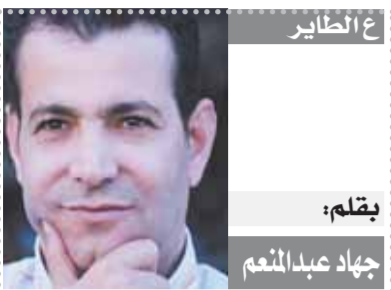
بقلم: جهاد عبد المنعم