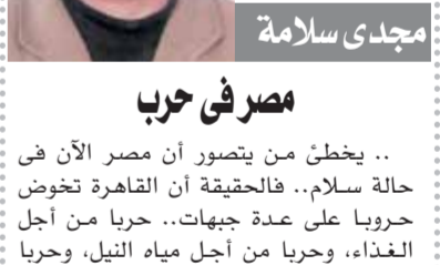
بقلم: مجدى سلامة