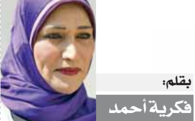
بقلم: فكرية أحمد