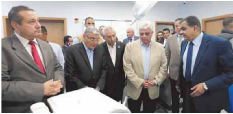
د. أيمن عاشور وقيادات الوزارة أثناء جولة المنيا أمس

وقال الدكتور أيمن عاشور، وزير التعليم العالى والبحث العلمى إن الوزارة تسعى لتطبيق الاختبارات الإلكترونية فى كافة الجامعات والمعاهد الحكومية قبل القبول بها. جاء ذلك خلال تقعد الوزير أمس مركز الاختبارات الإلكترونية بجامعة المنيا، والذي يأتي في إطار خطة الجامعة المتكاملة نحو التحول الرقمى، مؤكداً أهمية تطوير وتحديث برامج الامتحانات والخدمات الخاصة بها؛ بما يتوافق مع أعداد الطلاب، وتنظيم وعقد الامتحانات الإلكترونية للمقررات الدراسية بكليات الجامعة، إضافة إلى تأهيل الكادر الإدارى والفنى على ما يستجد من