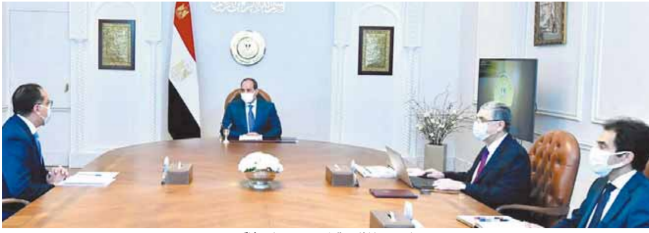
السيسي خلال اجتماعه مع مديولي وشاكر

وأضاف المتحدث الرسمي أن وزير الكهرباء استعرض كذلك التدرج الزمني لأعمال الكهرباء بالمشروع الزراعي العملاق «الدلتا الجديدة»، فضلا عن الموقف التنفيذي لإمدادات التغذية الكهربائية للمشروع القومي لتنمية سيناء، وذلك في ضوء ما يمثله قطاع الكهرباء من مكون أساسي لتلبية الاحتياجات التنموية خاصة فيما يتعلق بمشروعات قطاع الإنتاج الزراعي. كما تم خلال الاجتماع استعراض الموقف التنفيذي الخاص بإنشاء مركز التحكم الرئيسي في الشبكة القومية لنقل الكهرباء بالعاصمة الإدارية الجديدة، فضلا عن الجهود التي تقوم بها مصر لتصبح ممرًا لعبور الطاقة النظيفة، ومن ثم مركزاً محورياً للربط الكهربائي بين أوروبا والدول العربية والإفريقية، إلى جانب دعم جهود الدول الإفريقية لنفاذ إلى الطاقة النظيفة من المصادر المتجددة.