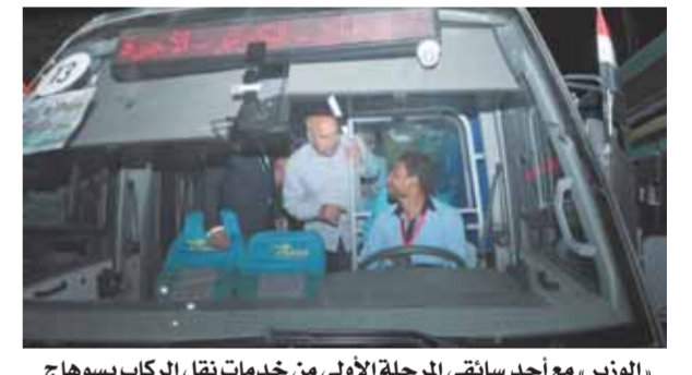
الوزير، مع أحد سائقي المرحلة الأولى من خدمات نقل الركاب بسوهاج

أكد الدكتور محمد معيط وزير المالية، أن الاقتصاد المصري يمتلك القدرة على التعامل المرن مع التحديات الخارجية الحالية، في ظل ما تشهده الساحة العالمية من تداعيات للأزمة الروسية الأوكرانية التي تبعها اضطراب في سلاسل التوريد، وارتفاع حاد في أسعار السلع الأساسية، والمواد البترولية، وتكاليف الشحن، نتيجة للتنفيذ المتقن لبرنامج الإصلاح الاقتصادي خلال السنوات الماضية، وأن الحكومة مستمرة في مواصلة الإصلاحات الهيكلية بمختلف القطاعات الحيوية للحفاظ على المكتسبات الاقتصادية التي تمكن من