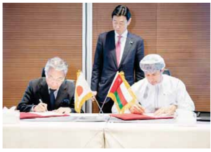
مجلس الوزراء في سلطنة عُمان

●● في إطار تطوير قطاع الغاز وزيادة الطلب عليه، وقعت سلطنة عُمان في سبتمبر الماضي، اتفاقية مع شركة شل عُمان لاستكشاف والإنتاج، وشركائها أوكيو الألمانية وتوتال انرجي الفرنسية للتتبع