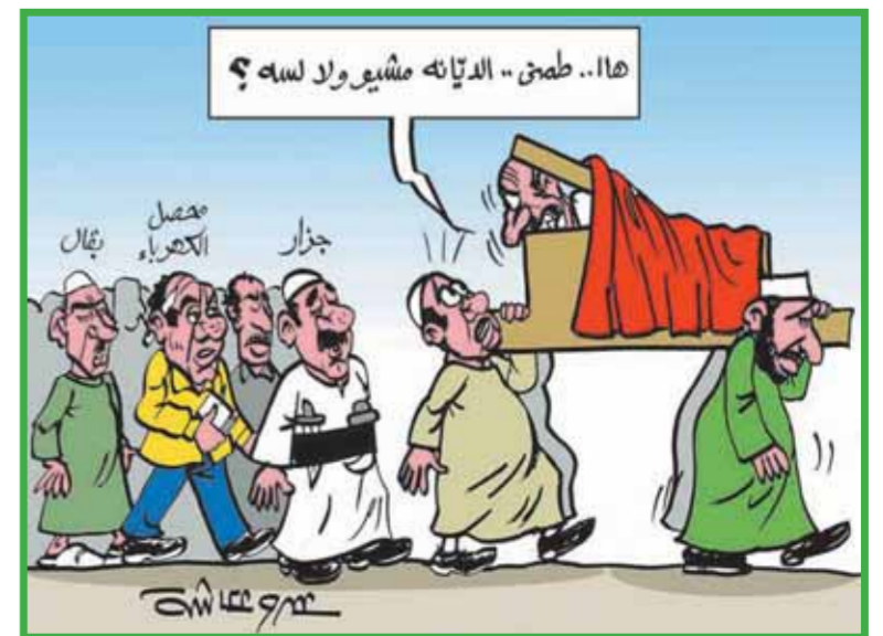
ها.. طمن.. الديانة مشيولاد لسه؟