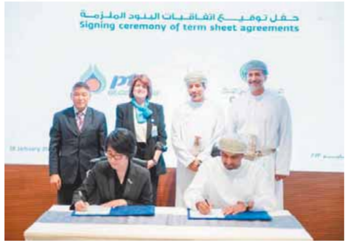
مجلس الوزراء في سلطنة عُمان