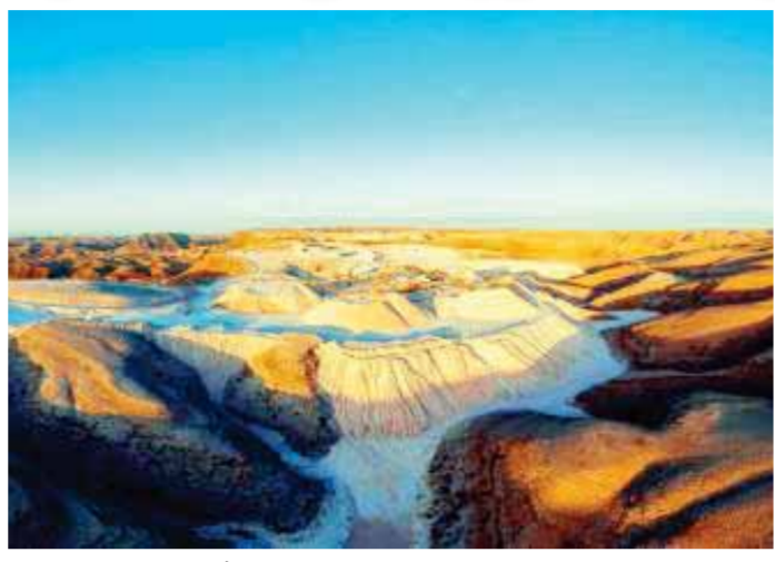
مشروعات التعدين في سلطنة عُمان