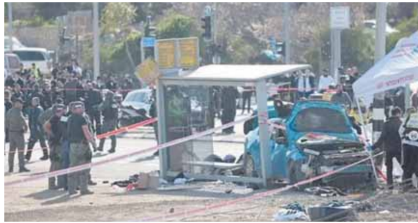
موقع العملية الفدائية بالقدس

فيما قعمت قوات الاحتلال المصلين المتصممين بمعيط النبية المهدة بالهدم داخل حي واد قديم في سلوان جنوبي المسجد المبارك واندلعت المواجهات بين شباب المقاومة الفلسطينية وقوات الاحتلال قرب جبل صبيح في بيتا جنوب نابلس وتواصل مصر جهود الوساطة بين الفلسطينيين وإسرائيل في محاولة لوقف العنف في القدس بالضفة المحتلة ومنع انتشاره إلى قطاع غزة قبل حلول شهر رمضان المبارك. واستضافت القاهرة الأسبوع المنى قادة من حركة «حماس» التي تدبر قطاع غزة ومن حركة «الجهاد» كما أجرى وفد أمنى مصري رفيع المستوى محادثات مع ممثلين لإسرائيل في وقت سابق. وتسارعت وتيرة أعمال العنف في الضفة المحتلة، التي تصاعدت العام الماضي مع تنفيذ إسرائيل لعدة مذبوح في جنين ونابلس وسلسلة غارات على قطاع غزة المحاصر منذ أن أدت الحكومة الإسرائيلية اليمنية المتشددة اليهين في ٢٩ ديسمبر الماضي وأعرب مستولان ريفيا المستوى عن أن القاهرة تعتقد