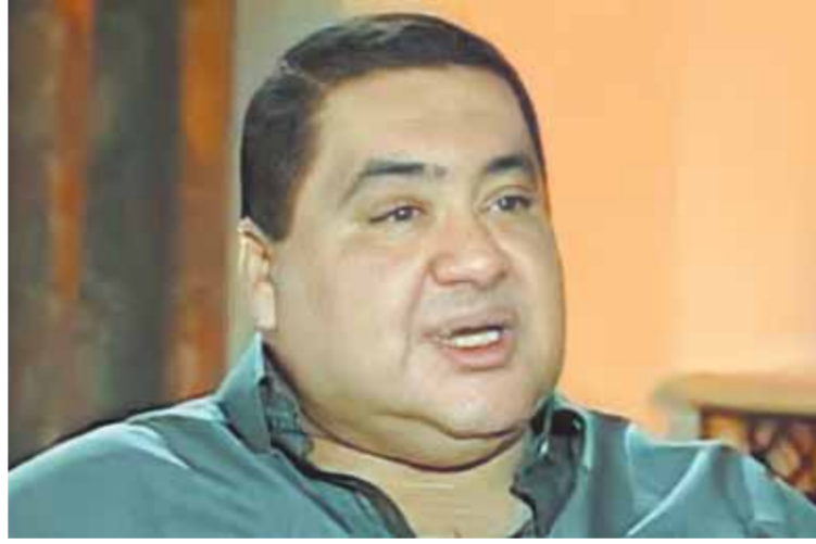
كتب - أمجد مصباح:

يمر اليوم ٢٠ عاماً على رحيل الفنان الكوميدي علاء ولي الدين، الذي كان بلا شك فناً يتمتع بموهبة فطرية وملامح بريئة، مشواره الفني الحقيقي لم يتجاوز ١٥ عاماً، حيث بدأ مشواره مع مطلع التسعينيات بأدوار مساعدة في أفلام «الأرهاب والكتاب - أيام الغضب - المنسى - بخيت وعديلة». بداية انطلاقه كانت في فيلم «حلق حوش» مع ليلى علوي ومحمد هندي، ووصل لقمة التوهج حينما قام ببطولة فيلم «عبود على الجدود» عام ١٩٩٩، ثم فيلم «الناظر» وآخر أفلامه «عربي تعريف»، كما قام الفنان الراحل ببطولة عدد من المسرحيات منها: «الجميلة والنوحين - الأبنود»، بالإضافة إلى عدد محدود من الأعمال التلفزيونية، ورحل يوم ١١ فبراير عام ٢٠٢٣، عن عمر لم يتجاوز ٤٠ عاماً.