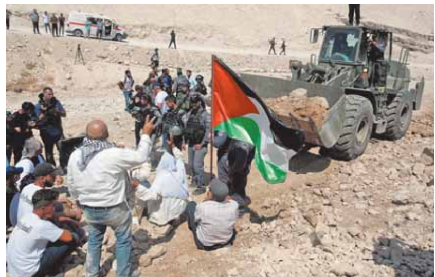
الفلسطينيون يواجهون الاحتلال لوقف هدم منازلهم