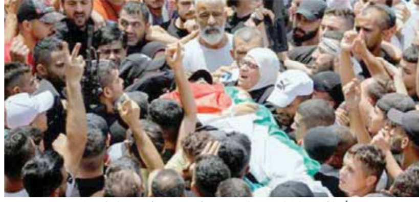
أم الشهيد النابلسي حملته جنيناً في رحمها وشهيدا على كتفها