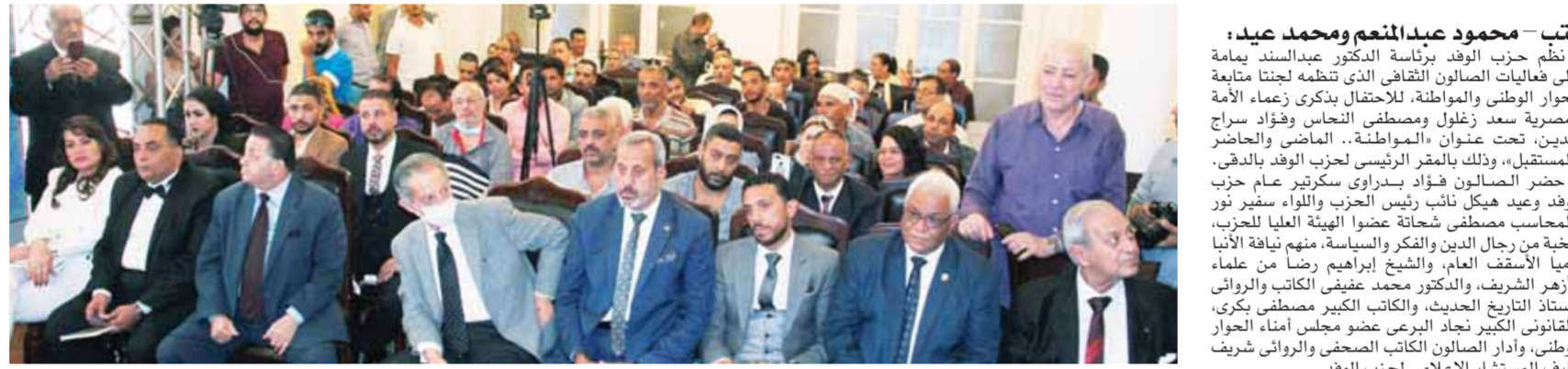
قيادات الوفد المشاركون في الصالون الثقافي