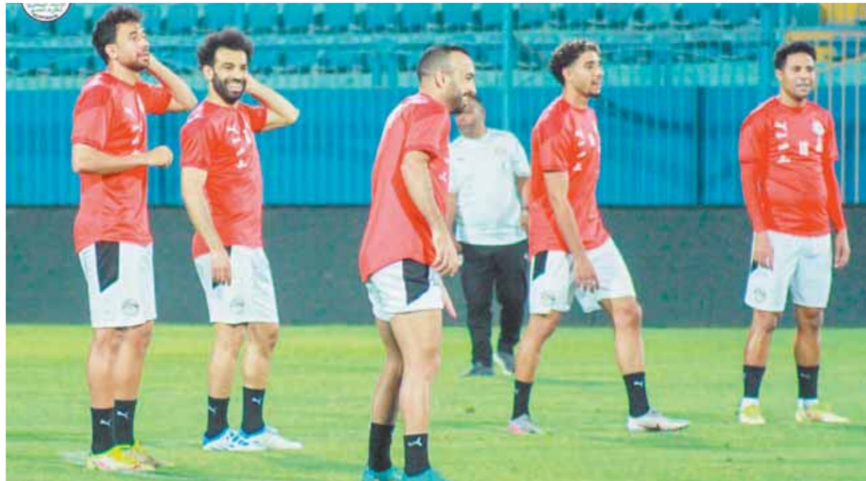
المنتخب في انتظار مرانه الأول مع فيتوريا

على أن يكون الدوري في الموسم الجديد بنظام الدور الواحد مع إجراء دورتين لتحديد البطل وأخرى لتحديد الثلاثي الهابط إلى دوري الدرجة الأولى، حيث يصبح الموسم مكوناً من ٢٤ جولة، ويبدأ في أكتوبر المقبل، لينتهي بعد أقصى في مايو ٢٠٢٣، ويصبح منظماً مع الدوريات على مستوى العالم، ويمتد فرصة للاعبين من أجل التعافي والراحة بعد تلاحم الموسم الثلاثة الماضية.