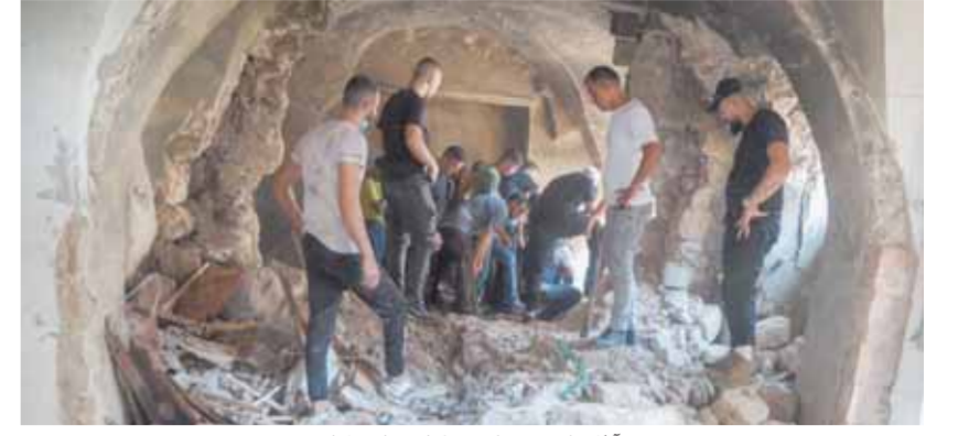
آثار القصف الإسرائيلي على نابلس

«السياسي» و«تميم» يتوافقان على التنسيق في مواجهة التحديات الإقليمية