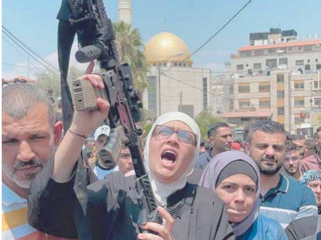
أم الشهيد النابلسي تحمل السلاح لتكمل المسيرة حسب وصيته لا تتركوا الباردة