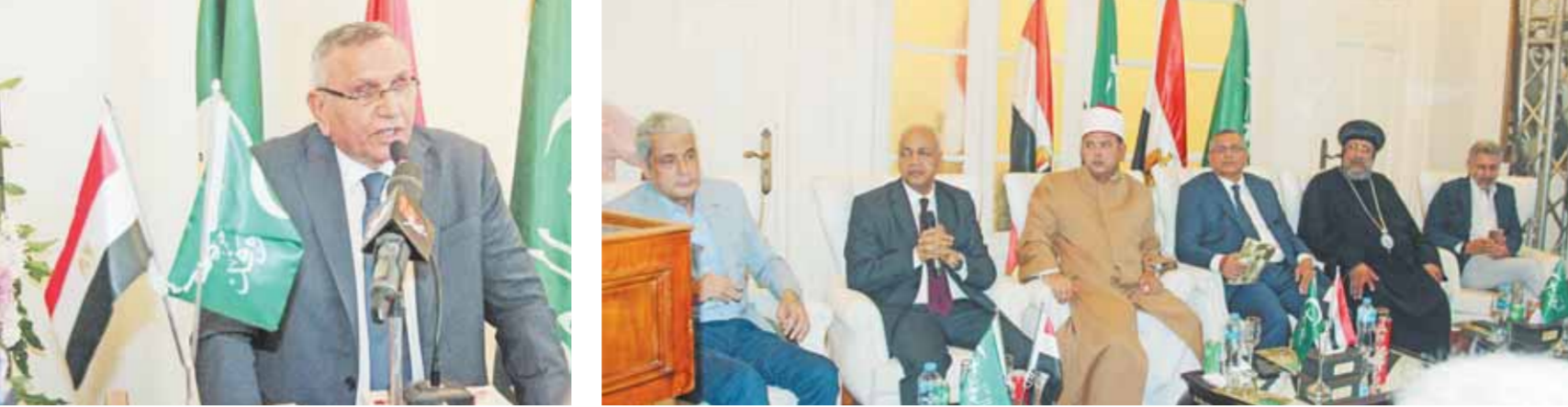
رئيس الوفد يتوسط المتحدثين في الصالون د. عبدالستد يمامة خلال إلقاء كلمته