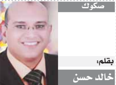
يقلم: خالد حسن

العالم الذي اجتمع في نوفمبر الماضي، وانفضاضه دون نتيجة، لا يحتمل الأمر نفسه في مؤتمر شرم الشيخ، ولا سبيل إلى إنجاح مؤتمر شرم إلا بأن يكون الأمريكيون والصينيون جادين في التعامل مع القضية!