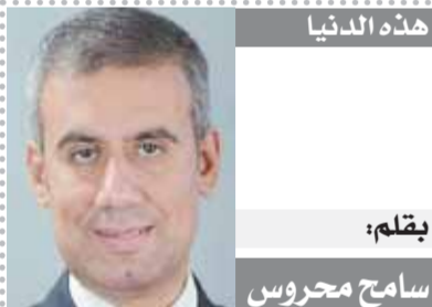
هذه الدنيا بقلم: سامح محروس