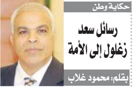
رسائل سعد زغلول إلى الأمة بقلم: محمود غلاب

استقبل الفريق عبدالمنعم التراس رئيس الهيئة العربية للتصنيع، وزير الدفاع وشؤون المحاربين القدماء بجمهورية بوركينا فاسو، والوفد المرافق له، وبحضور سفير جمهورية بوركينا فاسو بالقاهرة. تم خلال اللقاء استعراض أوجه التعاون بين الجانبين في مجال الصناعات الدفاعية والأمنية المختلفة والساليب تدعيمها، والاستفادة من الإمكانيات المتطورة بالهيئة العربية للتصنيع لتلبية احتياجات المشروعات التنموية بجمهورية بوركينا فاسو الشقيقة.