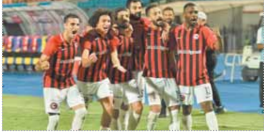
فرحة فيوتشر بالتتويج بكأس الرابطة