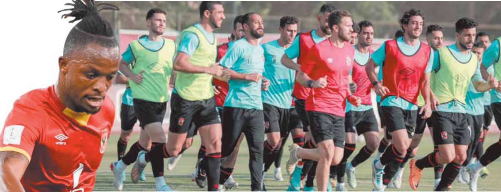
الأهلي يستأنف تدريباته لمواجهة فيوتشر