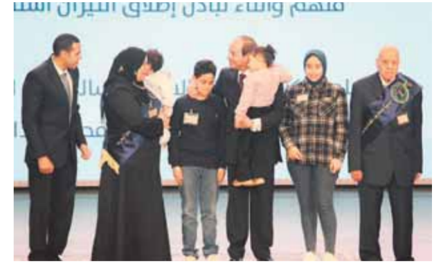
تسلم من وراء بديل إصقح البيرن استا