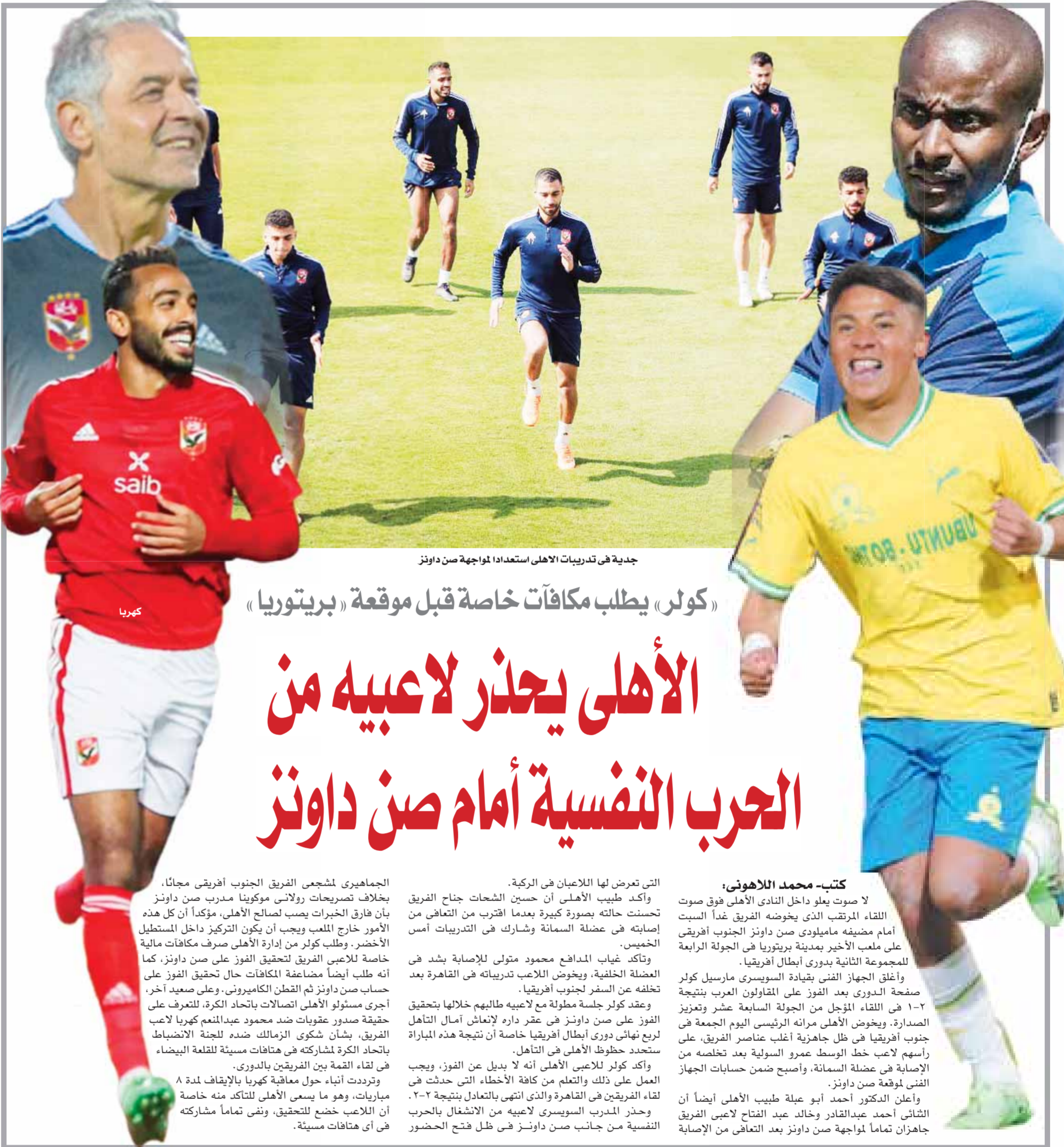
جديدة في تدريبات الأهلي استعدادا لمواجهة صن داونز

«كولر» يطلب مكافآت خاصة قبل موقعة «بريتوريا»