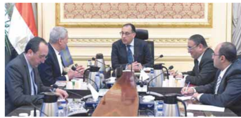
ومصانع الأدوية العالمية؛ من أجل العمل على توطيد صناعة عدد من الأدوية. وأشار رئيس مجلس الوزراء إلى أنه يتم تدبير التمويل اللازم لتوفير الاحتياطات الاستراتيجية من الأدوية ومختلف أنواع المستلزمات الطبية اللازمة، أما فيما يخص خطة التنفيذ المرحلي

مشروع المخازن الاستراتيجية للمنتجات والأجهزة الطبية، فأشار رئيس هيئة الشراء الموحد إلى أنه جار العمل حالياً، بالتنسيق مع الجهات المعنية، لبدء تنفيذ هذا المشروع الحيوى خلال الفترة المقبلة، والذي تكمن أهميته في أنه يعتبر أحد المشروعات القومية التي تتبناها القيادة السياسية والحكومة المصرية؛ من أجل النهوض بقطاع الرعاية الصحية، كأحد القطاعات الحيوية بالدولة، وذلك سعياً لزيادة قدرات التخزين، ومواجهة الجوائح والأوبئة، ومواكبة النمو السكاني المطرد، كما يأتي في ضوء تحقيق «رؤية مصر ٢٠٣٠». وأكد اللواء بهاء الدين زيدان أن المشروع من شأنه أن يساهم مرحلياً في سد الفجوة في الطاقات الاستيعابية للمخازن الحالية بمختلف الجهات الحكومية، شارحاً مراحل تنفيذ المشروع، والمخطط الزمنى للتنفيذ، والتكلفة المقترحة لذلك.