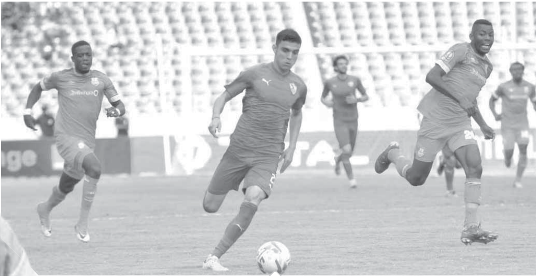
الأهلي يخوض مرانته الأخيرة في زيمبابوي

وأشار الشناوي إلى أن تحقيق ١٠ انتصارات متتالية في الدوري يحمل الفريق مسئولية كبيرة في كل البطولات الأخرى، فالجميع بالأهلي، سواء إدارة أو جهازاً فنياً ولاعبين وجماهير هدفهم المكسب فقط: لذلك نخوض أي مباراة باحطين عن الفوز، كما أن تحقيق العلامة الكاملة بالدوري يمنح الفريق مزيداً من الثقة، من أجل مواصلة سلسلة الانتصارات، وتحدث الشناوي عن تألقه على مدار الموسم الأخيرين مع الأهلي ومنتخب مصر، مؤكداً أنه نتاج تعب وجهد كبير له ولزملائه بالأهلي والمنتخب، والمدربين الذين عمل معهم، مؤكداً أن المنافسة قوية للغاية مع شريف إكرامي وعلي لطفى وهو ما يزيد