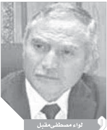
لواء مصطفى مقبل

أحد من الجيران، كما لم نتبين غياب شيء من محتويات الشقة حتى نرجح أن تكون الجريمة بدافع السرقة، مما جعل عملية كشف الجريمة أمراً معقداً، وكادت القضية أن تقيد ضد مجهول لولا عناية الله التى شاءت ألا تضع دماء هذه السيدة الشابة هدراً، وأن ينال المجرم عقابه على أيدي العدالة.