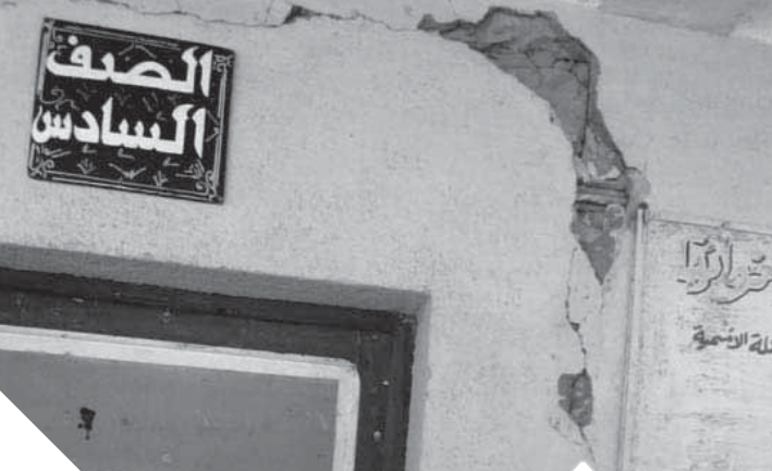
الشروخ تملأ حوائط مبنى المدرسة بمركز نصر النوبة