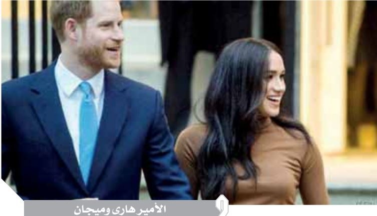
الأمير هارى وميجان

مثيرة، لكن لم يتضح بعد كيف يمكن أن يصبح الزوجان «نصف ملكيين» على حد توصيف كتاب السير الذاتية للأسرة المالكة، ومن سيدفع تكاليف معيشتهم فى أميركا الشمالية. وقارن معلقون وضع الزوجين بأزمة الملك إدوارد الثامن، الذى تخلى عن العرش