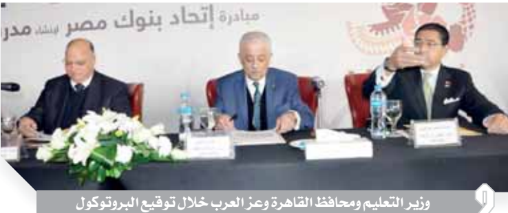
وزير التعليم ومحافظ القاهرة وعز العرب خلال توقيع البروتوكول