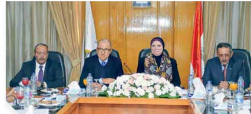
وزيرة الصناعة خلال لقائهما بمجلس الاتحاد

وأضافت الوزيرة أن الحكومة تبذل جهودا كبيرة لتهيئة بيئة الأعمال الصناعية وتذليل العقبات والقضاء على البيروقراطية وميكة الخدمات