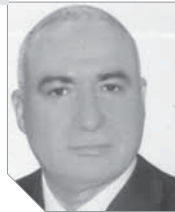
لواء صلاح الدين الشربيني