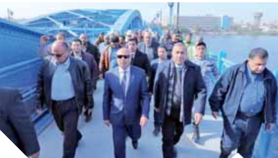
«الوزير، يتفقد كوبرى إمبابية

أكدت مصر أنها تتابع بقلق بالغ التطورات الراهنة بالعراق ومنطقة الخليج والتصعيد الحالى فى استخدام القوة العسكرية. وأكد بيان لوزارة الخارجية أن مصر تتأشد كافة الأطراف ضرورة الامتناع عن الانزلاق إلى دوائل العنف المتبادل، وتقدير العواقب الوخيمة التى تترتب على ذلك من زعزعة أمن المنطقة واستقرارها، وما تتحمله شعوبها من معاناة ومزيد من فقدان للأرواح والخسائر المختلفة.