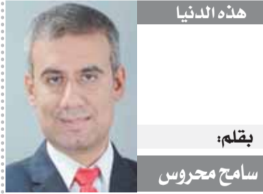
هذه الدنيا بقلم: سامح محروس