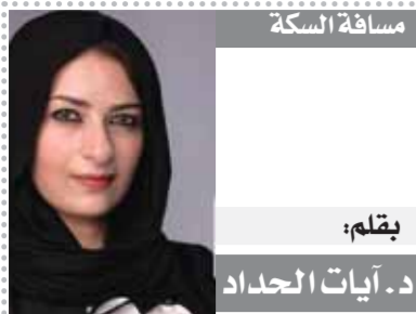
مسافة السكة بقلم: د. آيات الحداد