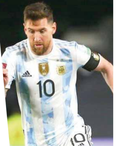
يملح لوسيل، تدور مواجهة كلاسيكية بين منتخب هولندا والأرجنتين ستكون محورا اهتمام المتابعين خاصة أن هذه المباراة دائماً عنوان لكرة الجميلة.