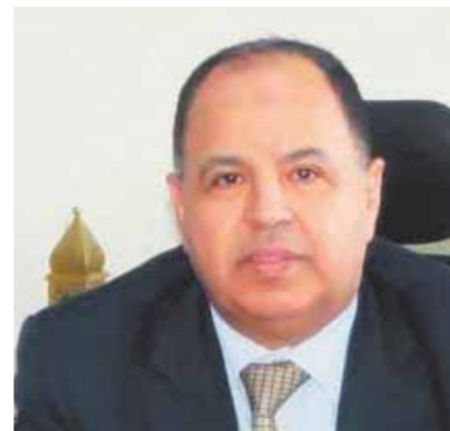
د. محمد معيط

وأوضح أن الوضع المالى للهيئة العامة للتأمين الصحى الشامل جيد ومحفز لاستكمال مسيرتنا التاريخية، وأن المبادرة الرئاسية «حياة كريمة» تساعده على اختصار الزمن اللازم للانتهاء من تعميم المنظومة الجديدة حيث إن رفع كفاءة البنية التحتية والمنشآت الصحية بالمناطق المحرومة، تسجعتنا على التوسع الجغرافى بمختلف المحافظات، ومن المقرر الانتقال خلال الأشهر القليلة المقبلة إلى باقى محافظات المرحلة الأولى: جنوب سيناء وأسوان والسويس، ثم