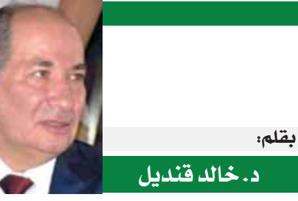
بقلم: د. خالد قنديل

ولا تزال التحديات البيئية واقعا وفضية خطيرة تفرض نفسها وتحتاج إلى استعداد متكامل، لأنها بمثابة أزمة شاملة للجميع خصوصا دول الشرق الأوسط، وبالتالى تأتى خضوة استضافة مصر قمة مؤتمر الأطراف لاتفاقية الأمم المتحدة لتغير المناخ COP ٢٧ فى قلب من القلب من هذا المسعى الدبوى، لتبني جميع الأطراف نحو استكمال مسارات التنمية المختلفة، وتظل الحاجة ضرورية إلى استمرار التعاون بين جميع الأطراف فى اتجاه دعم وتبوية الاقتصاد الوطنى، وتأتى هذه اللقاءات الحيوية فى سياق إنجاز للدولة المصرية بأهمية التكامل بين مبادرات التنمية المختلفة، كالتكاس متجدد للدرر المحورى الذى تقوم به مصر إقليميا ودوليا.