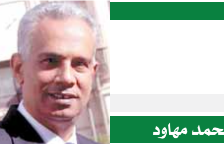
بقلم: محمد مهاد

إننى مازلت أرى أن مشكلات الصناعة المصرية تتخطى مسؤولية التعامل معها حدود وزارة التجارة والصناعة، لأنها مشكلات ممتدة ومتراكمة منذ عشرات السنين، فالصناعة تواجه مشكلات عديدة بعضها تخص الجمارك والضرائب، وبعضها تخص البيئة، وبعضها تخص التراخيص الصناعية، وبعضها تخص قطاعات أخرى، وهو ما يعنى أن حل هذه المشكلات يستلزم تصورات فوفية توازن بين الصلحة العامة ومصالح الاستثمار الصناعى بما يخدم الهدف الرئيسى للدولة وهو تعميق الصناعة وزيادة الصادرات. أتذكر أننى كتبت من قبل أن طيب النوايا، وجهود المسؤولين وحماهم وقائهم بمستقبل الصناعة شىء عظيم، لكن الأهم منه هو اتخاذ خطوات جادة وعملية وفعالة فى طريق تنمية الصناعة والنهوض بها.