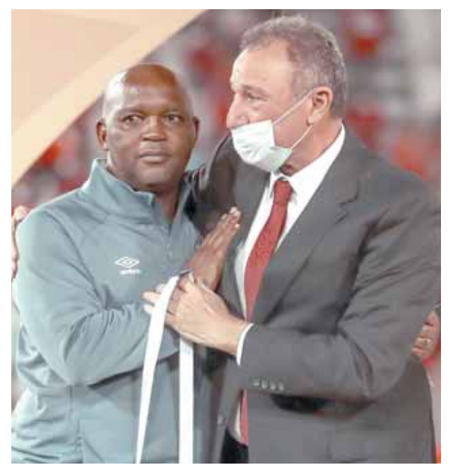
هل انتهى شهر العسل بين الخطيب وموسيمانى؟

وزادت الخلافات في ظل توالى تصريحات المدير الفني للأهلئى والذى تفجر الجدل بين الآن والأخر خاصة أن موسيمانى يخرج يومياً بتصريحات وأحاديث للإعلام الجنوب إفريقياي. وكانت آخر هذه الأحاديث ما قاله موسيمانى لصحيفة (Prime sport) أن الأهلي لا يقبل سوى بالفوز وهو ما لا يحدث لأى مدرب في العالم فالجميع يفوز ويخسر حتى بيبي جوارديولا ويورجن كلوب. ودافع موسيمانى عن لاعبه بيرسى تاندرود أبناء قومية حول توصل الأهلي لاتفاق لضم اللاعب أحمد تادرس نجم خط وسط وفنك سطيف في الموسم المقبل بعد أن نال إعجاب مسئولى القلعة الحمراء.