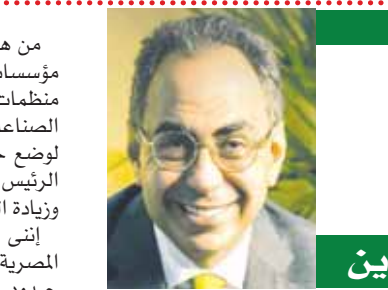
بقلم: د. هانى سرى الدين