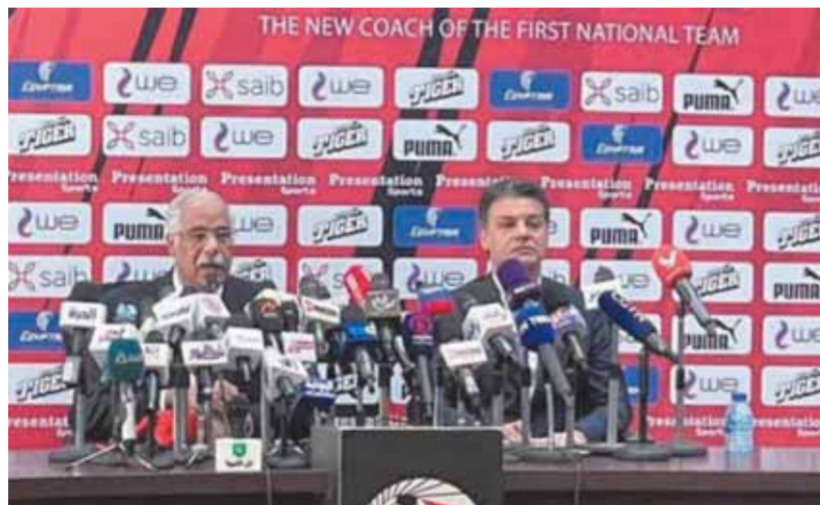
المنتخب يبدأ عهداً جديداً تحت قيادة وطنية

على اللقب القارى الذى كان قاب قوسين أو أدنى من تحقيقه فى النسخة الأخيرة بالكامرون، لولا الخسارة من السنغال بركلات الترجيح. وقال جلال «نحن فى مرحلة تحتاج إلى تكاتف الجميع، لأننا فى مهمة شاقة لكنها تمثل شرفا كبيرا لأنه منتخب بلدنا ويضع علينا مسؤولية كبيرة، حيث تولينا المهمة بعد مدرب كبير، حقق إنجازا مهما مع الجوهري».