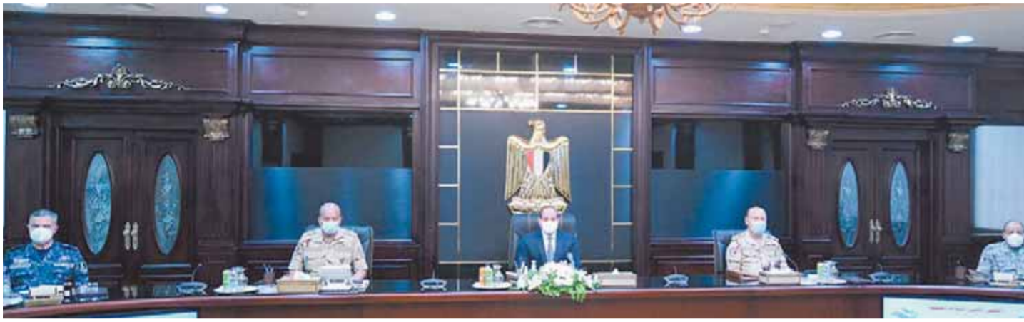
السياسي يترأس اجتماع المجلس الأعلى للقوات المسلحة

كتب - ناصر عبدالجيد ومحمد صلاح وأبو زيد كمال وسامية فاروق: