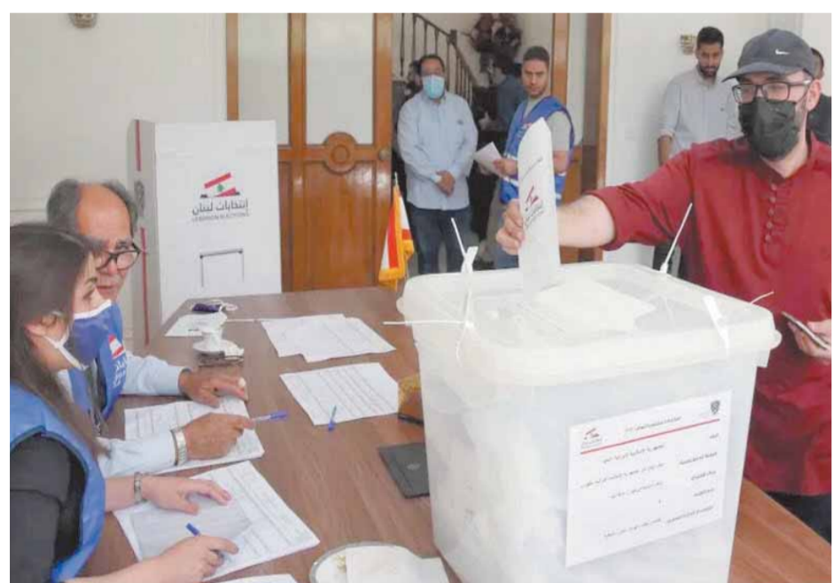
لبنانيون يدلون بأصواتهم في الانتخابات البرلمانية