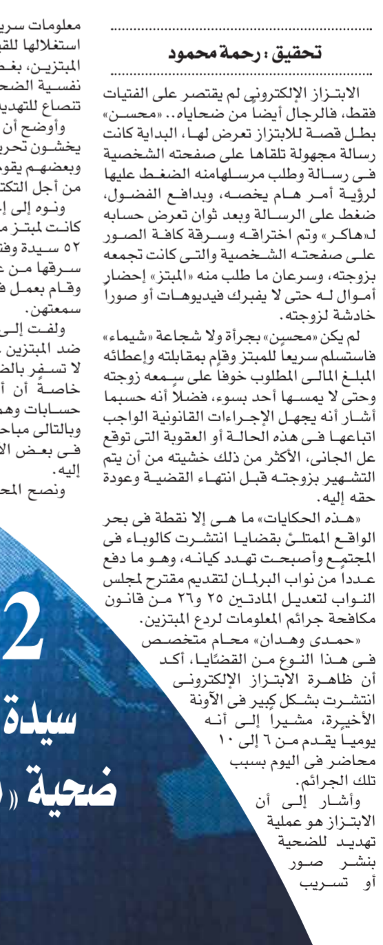
بنست خالد إحدى ضحايا الابتزاز الإلكتروني