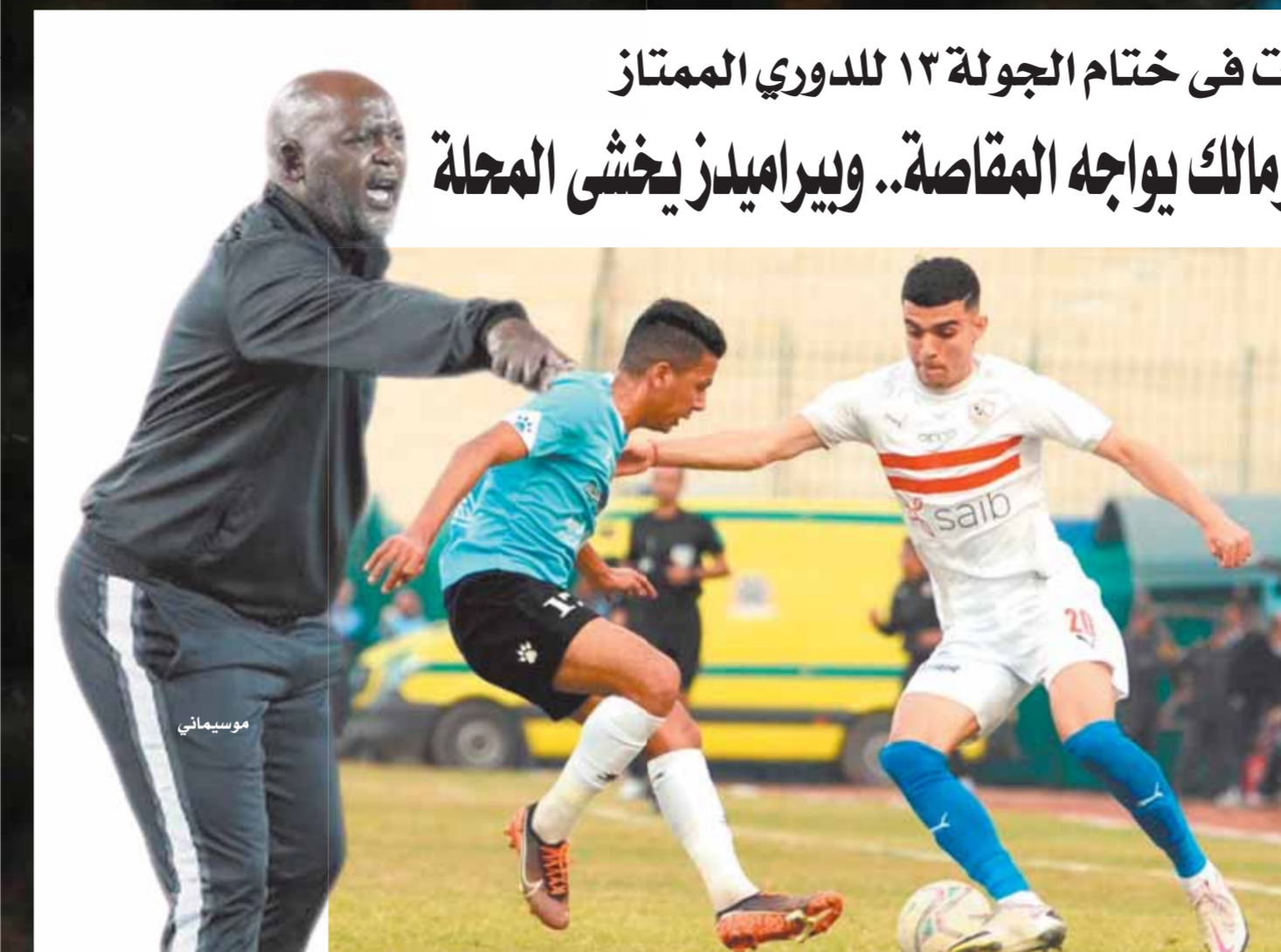
الزمالك يسعى لمواصلة الانتصارات امام المقاصة

لكن الجماعة المحظورة في ذلك تتبع سبيل العاجز الذي ليس بيده حيلة، خاصة والأمور كاشفة والمؤامرة على مقدرات الوطن كانت فاضحة، وأنا وأنت وملايين المصريين عايشنا يوماً بيوم هذه الأحداث المريرة، وكيف كانت شوارعنا ومرافقنا، وأمتنا واستقرارنا. وهذا هو القرار الرابع: قرارنا بالاصطفاء خلف قيادتنا الوطنية من أجل استكمال المسيرة، دون التسليم أو الثقافة لترهات والهات «السوشيال ميديا» والتسليم السواد للذئاب الإلكترونية للجماعة وكاتها، لا بد أن نعيش حالة من «الاصطفاء الوطني» من أجل مصلحة الوطن، الوطن الذي كنا على وشك أن نقدمه لولا القرار، والتذكير للجميع كيف كنا ما بعد ٢٠١١، وماذا نحن الآن... وانتهاء، لن تتبع جماعة وطناً ولن يهزم تنظيم شعبياً ودولة.