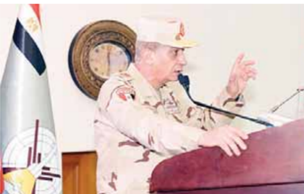
الفريق أول محمد زكى