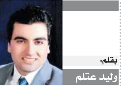
بقلم: وليد عتلم