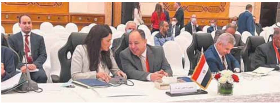
دعا الدكتور محمد معيط وزير المالية، مجلس وزراء المالية العرب، وصندوق النقد العربي، إلى تبني استراتيجية متكاملة للتحول العربي ضد الصدمات الاقتصادية الخارجية؛ فوجدتها واستدامة تسويق الرؤى والسياسات العربية تعد أكبر ضماناً للتعامل الإيجابي والمنم مع التداعيات الاقتصادية العالمية، على نحو يساهم في امتصاص الآثار السلبية للأزمات العالمية، وتخفيف حدتها على الاقتصادات العربية.

وأشار إلى حرص مصر بقيادةها السياسية الحكيمة على تعزيز التضامن العربي، وتعميق الوحدة؛ تحقيقاً للتكامل المنشود بين الأشقاء الذين يربطهم تاريخ راسخ، ويجمعهم مصير مشترك، ومستقبل واحد؛ بما يؤدي إلى تعظيم الاستغلال الأمثل للموارد العربية، وتحقيق المستهدفات المالية والاقتصادية والتنمية على نحو مستدام.