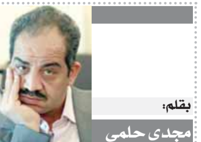
بقلم: مجدى حلمي