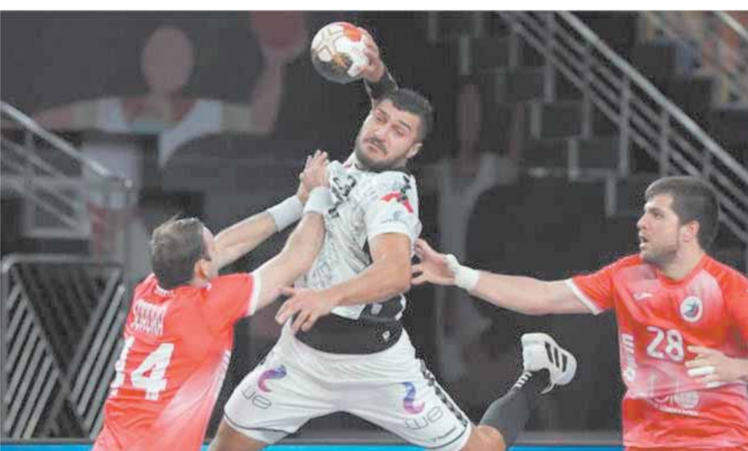
منتخب اليد حقق نجاحات على المستويين الأفريقي والدولي

و شدد الوزير على ثقة الاتحاد الدولي لكرة اليد بقيادة حسن مصطفى والاتحاد الأفريقي بقيادة منصور أريمو في قدرة مصر على استضافة منافسات الاتحاد القارية، وإسناد بطولتي أفريقيا نسخة ٢٠٢٢ و ٢٠٢٤ لصر هو تأكيد على زيادة مصر في تنظيم كبرى البطولات العربية والقارية والدولية، مشيراً إلى تكاتف وتشكيل اللجنة المنظمة للبطولة والبدء في اتخاذ الإجراءات الواجبة تبعاً بشأن الأمور اللوجستية الخاصة بالبطولة وتحديد الصالات المغطاة التي تستضيف البطولات التي تقام على أرض مصر.