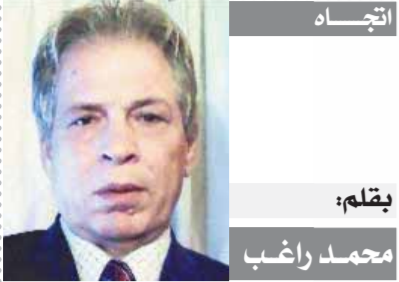
بقلم: محمد راغب

رفض البرتغالي فرييرا المدير الفني للزمالك منح لاعبيه راحة وادي اللاعبين مرانهم على ملعب عبدالمطيف أبو رجيلية قبل الإفطار، وانتظم الفريق في المعسكر المغلق أمس، حيث ركز الجهاز الفني على التدريبات الاستشفائية لعلاج الإرهاق، وطالب المدير الفني بضرورة الحفاظ على فرص المنافسة على درع الدوري، مشدداً على أن ضياع أي نقطة سيهدد الفريق إلى الوراء ويوسع الفارق مع الأهلي، شارحاً الأخطاء التي حدثت في اللقاء السابق وطالب بتدعيمها أمام الملأ، مؤكداً على التشكيل باستثناء ويتوقع ألا يجري المدير الفني أي تغييرات على التشكيل باستثناء