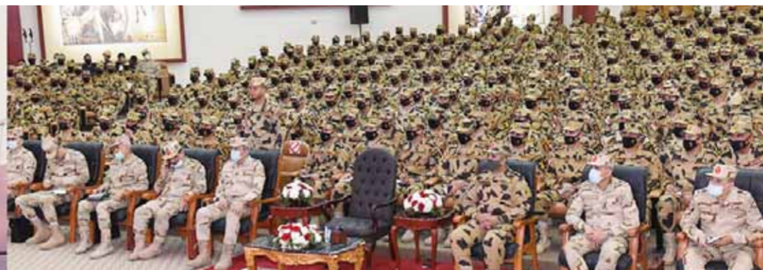
مقاتلو الصاعقة يستمعون لكلمة وزير الدفاع

مؤسسات الدولة للوقوف بالوطن في شتى المجالات، مطالباً رجال الصاعقة بالحفاظ على روحهم المعنوية العالية والإهتمام بالتدريب المستمر والمحافظة على الأسلحة والمعدات لتكون القوات المسلحة فى أعلى درجات الاستعداد القتالى لصون مقدرات الوطن. تناول خلاله تطورات الأوضاع فى المنطقة وتأثيرها على أمن مصر الثورات، كما استمع لأرائهم واستفساراتهم فى مختلف المجالات، حضر اللقاء عدد من قادة القوات المسلحة.