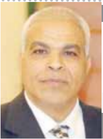
بقلم: محمد غلاب