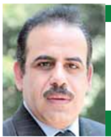
بقلم: عبدالعزيز الحجازى

● بدأت شرارة الثورة صباح الأحد ٩ مارس ١٩١٩ عندما علم طلبة الحقوق بجامعة القاهرة بنفى سعد زغلول، وسرعان ما عمت الثورة كل ربوع مصر، وعجزت بريطانيا عن مواجهة غضب ثورة المصريين واضطرت إلى إعادة سعد زغلول ورفاقه والبدء فى المفاوضات، وحققت الثورة كامل أهدافها وعلى رأسها اعتراف بريطانيا بأن مصر دولة مستقلة ذات سيادة، وصدر دستور ٢٣ مقررًا بسطة الشعب وحقه الشرى فى حكم نفسه بنفسه وحرية العمل السياسى وتشكيل الأحزاب وحرية الصحافة وصون الحريات العامة واستقلال القضاء وإلغاء الامتيازات الأجنبية، ورسخت الثورة لدولة المواطنة عندما قررت حرية المرأة المصرية وحقها فى التعليم والعمل والمشاركة السياسية، وإعلاء شعار الدين لله والوطن للجميع ودعم مشروع طلمت حرب فى إنشاء بنك مصر للنهوض بالاقتصاد المصرى، واطلقت الثورة الطاقات الشبية فى شتى المجالات لتخلق جيلا من الرواد فى السياسة والاقتصاد والصحافة والفن والثقافة والشعر والأدب، ولتكون نواة لنهضة علمية وثقافية واجتماعية أسست للدولة الوطنية والهوية المصرية التى يصعب تغييرها.. تلك الهوية التى حمت مصر فى الثلاثين من يونيو ٢٠١٢، عندما سطرت ثورة أهدت العالم من جديد فى أكبر تجمع بشرى عرفته البشرية، يعلن تمسك بالثورة الوطنية ويرفض كل أشكال التطرف والإرهاب.