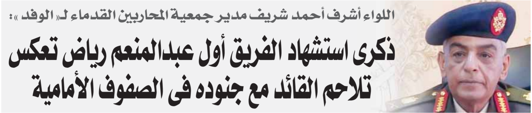
اللواء أشرف أحمد شريف مدير جمعية المحاربين القدماء لـ «الوفد»