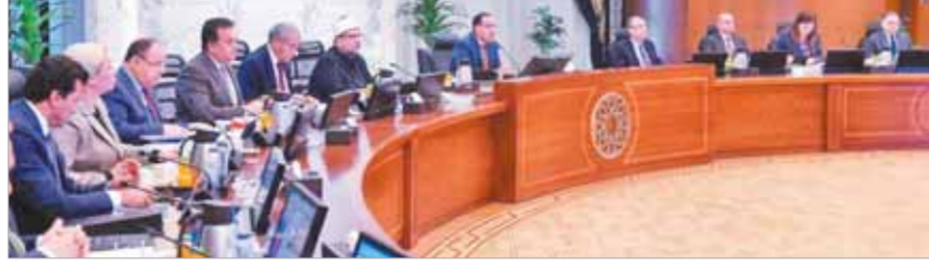
عبد الفتاح السيسي، رئيس الجمهورية، والذي شهد الشقيق، والحرس على مساندة العراق وتقديم الدعم للشعب العراقي على مختلف الأصعدة، بالإضافة

إلى مواصلة العمل في إطار آلية التعاون الثلاثي مع المملكة الأردنية، مشيراً أيضاً إلى نتائج جلسة المناقشات التي جمعتها بظهوره العراقي، وتم خلالها بحث فرص التعاون المشترك في عدة مجالات، من أجل تطوير العلاقات الاستراتيجية التي تجمع بين مصر والعراق. من ناحية أخرى، وجه رئيس الوزراء جميع الوزارات والجهات المعنية بسرعة اتخاذ الإجراءات اللازمة للبدء في رقمنة كل الأصول التابعة لها، سواء أراضى، أو عقارات أو خلافة، مؤكداً أن هذه الخطوة ضرورية، تحقق الحوكمة، وتضمن إدارة الأصول المملوكة للدولة بكفاءة، وسد منافذ محاولات التعدي عليها.