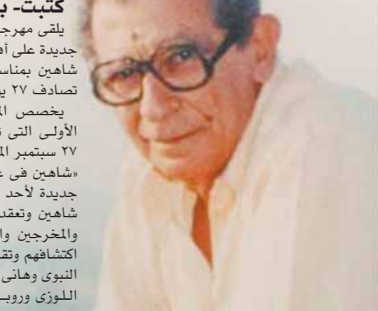
كتبت- بوسى عبدالجواد: يلقى مهرجان الفرقة لسينما الشباب نظرة جديدة على أفلام المخرج الكبير الراحل يوسف شاهين بمناسبة الذكرى الـ١٥٥ لرحيله والتي تصادف ٢٧ يوليو المقبل. يخصص المهرجان ضمن فعاليات دورته الأولى إلى تمام خلال الفترة من ٢١ وحتى ٢٧ سبتمبر المقبل احتفالية خاصة تحت عنوان «شاهين فى عيون الشباب» كما يصدر دراسة جديدة لأحد النقاد الشبان عن يوسف شاهين وتعد ندوة يشارك فيها كبار النجوم والمخرجين والمؤلفين الذين ساهم «جو» فى اكتشافهم وتقديمهم لل شاشة الكبيرة مثل خالد النبوى وهانى سلامة وعمرو عبدالجيل ويسرا اللوزى وروبي وخالد يوسف وخالد الحجر

وناصر عبدالرحمن وآخرين. وقال المنتج الكبير جابى خورى: إن «جو» كان يتمتع بروح شابة، فهو كان شديد الاقتراب من الشباب ويقول لنا دائما دائما إنهم يجددون من أفكاره شخصيا وأن يوسف شاهين رغم سنوات الرحيل الـ١٥٥ إلا أنه لا يزال هناك الكثير الذى لم يكتشف بعد فى مسيرته السينمائية الخالدة. وأشار إلى أن يوسف شاهين كان مؤسسة فنية تسير على الأرض، فهو منح الفرض لوجهه شابا جديدة فى كافة الفروع السينمائية من كتابة وتمثيل وإخراج كما منحها أيضاً لمخرجين كبار من أبنائه جيله كما هو الحال فى تجربة السقا مات للمخرج الكبير الراحل صلاح أبو سيف الذى أنتج بعدها خشى كثير من