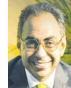
بقلم: د. هانى سرى الدين

إن درسا آخر مهما يمثّل فى ضرورة مشاركة المرأة فى العمل الوطنى، باعتبارها عنصرا أصيلا وحركيا ومشجعا للجماهير الضميم، ولا يترددون لحظة لمواجهة الباطنيين بالثورة متى لزم الأمر. ثانى الدروس المهمة، هو أن أى تحرك وطنى عظيم يحتاج إلى قائد استثنائى، شجاع، ناضج، متواضع، نزيه، ولديه استعداد دائم لتحمل المسئولية وخوض غمار الخطر فى أصعب الظروف، وهنا نقول بأن سعد باشا زغلول كان بمثابة شخصية استثنائية تادرة قادرة على الجمع بين الهيبة والحجة، والرفعة والتواضع، والقلائية والحماص فى أن واحد. وتعلم أيضا أن الثورة لايد أن تمتلك