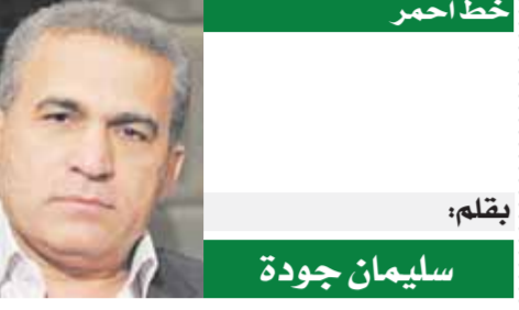
بقلم: سليمان جودة

● لا شك أن ثورة ١٩ تالتى كاعظم ثورة فى تاريخ البشرية بعد الثورة الفرنسية، لما تركته من آثار سياسية واجتماعية واقتصادية ليس فى مصر وحدها وإنما فى كثير من دول العالم التى سارت على درب الثورة المصرية للتحرك من الاستعمار، كما أكد الزعيم الهنذى غاندى عندما قال إن سعد زغلول هو أساتذى فى الوطنية وأساذ كل الحركات الوطنية الجديدة فى الشرق، وقد لقبث ثورة ١٩ فى الغرب باسم ثورة الشرق بسبب آثارها الممتدة إلى كل دول الشرق وتأثر الحركات الوطنية فى كل دول العالم بهذه الثورة، ولعل من أهم آثار ثورة ١٩، كان التأسيس للدولة الوطنية والهوية الوطنية فى مواجهة كل الثقافات الغربية والأجنبية، وهى بحق واحدة من عقربيات الزعيم سعد زغلول الذى بدأ نشاطه الثورى شابا متحمسا لحركة الزعيم أحمد عرابى ثم الزعيمين مصطفى كامل ومحمد فريد واستغل توليه مسئولية وزارة المعارف ثم الحفانية فى عملية التصير، وتدخل الحرب العالمية الأولى ١٩١٤ - ١٩١٨ وتزاد معاناة المصريين بسبب تجنيدهم اجباريا فى هذه الحرب ومصادرة أملاكهم من محاصيل زراعية وثروة حيوانية للجيش البريطانى، بخلاف التصيق السياسى ومنع العمل النقابى ومراقبة الصحف وتعطيل العمل فى الجمعية التشريعية «برلمان الشعب» ليبدأ سعد زغلول المدام. ● أدرك سعد زغلول وكيل الجمعية التشريعية أهمية مشاركة الشعب فى