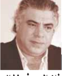
بقلم: محمد الشربيني