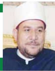
أ.د / محمد مختار جمعة

سيدنا عمر (رضي الله عنه) يقول: «لَا يَتَعَدُّ أَحَدُكُمْ عَمَلًا مِنْ غَيْرِ الرَّزْقِ يَقُولُ: اللَّهُمَّ ارْزُقْنِي، فَقَدْ عَلِمْتُمْ أَنَّ السَّمَاءَ لَا تَطْلُرُ ذَهَبًا وَلَا فِضَّةً». وعندما نتحدث عن العمل فإنه لا بد من التذكير بعدة أمور: أولها: مبدأ الحق والواجب، أو الحق مقابل الواجب، وهو أحد أهم المبادئ العادلة التي تسهم في إصلاح المجتمع، ومن ذلك حق العامل وحق العمل ممّا. والثابت: أن من أخذ الأجر حاسبه الله على العمل، وأن العقد شريعة المتعاقدين،