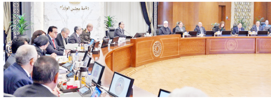
رئاسة مجلس الوزراء

وأشار إلى أنه قريباً، وعقب الانتهاء من المفاوضات مع المستثمرين، سيتم الإعلان عن كامل التفاصيل، مؤكداً أن هذه المشروعات الاستثمارية تسهم في تحقيق مستهدفات الدولة في التنمية، وتوفير مئات الآلاف من فرص العمل، وتشغيل الشركات المصرية، وانتعاش قطاع الموارد ضخمة من النقد الأجنبي.