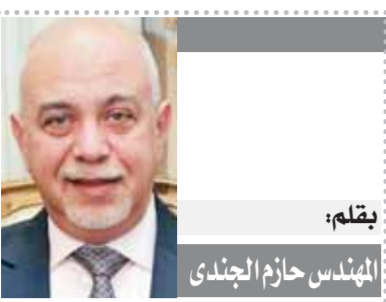
بقلم: المهندس حازم الجندى