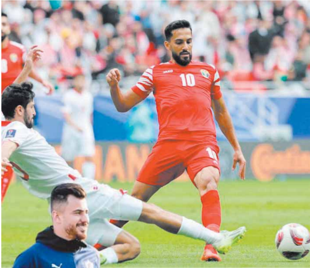
«التعمري، قاد منتخب الأردن إلى نهائي كأس آسيا