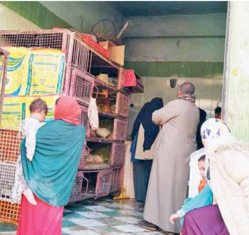
غول الأسعار يتلعب رواتب وجيوب المواطنين

كُلما ترجلت في شوارع المحروسة تجد وجوها مقتضية، تبدو متابع هذه القرارات يصاحبه دائماً موجة من ارتفاع الأسعار المشتعلة في الأساس، وهو ما يعني أن المواطن لن يشعر بهذه الزيادات، ولذلك فالأمر يتطلب جهوداً حكومية للسيطرة على الأسواق وتحجيم ارتفاع الأسعار الذي يتهافت على إجراءات حكومية لتخفيف عن كاهل المواطنين.