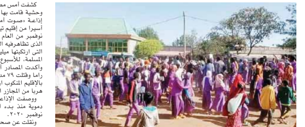
مظاهرات الطلاب ضد جرائم الحكومة الإثيوبية

ووقعت الهجمات فى وقت كانت فيه قوات تيجراى تتقدم باتجاه العاصمة الإثيوبية أديس أبابا. واعتبر أسرى آخرون نجواً من تلك المذبحة أن الهجمات اندلعت بسبب الخوف أو الرغبة فى الانتقام.