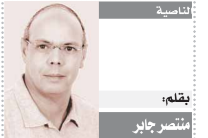
الناصية بقلم: منتصر جابر

● ظهور لافت للانتباه فى حملة اعلانية بارعة شخصيات، مختلفة وردود أفعال واسعة من الجمهور... ما تعليقك؟