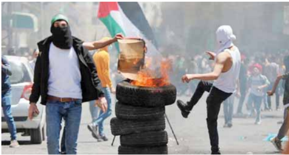
تصاعد عمليات المقاومة ضد الاحتلال بالضفة

وقالت سرايا القدس - كتبية نابلس، في بيان لها، إن مقاتليها تصدوا فجر اليوم لقوات وإليات الاحتلال وتعزيراته الكبيرة التي وصلت البلدة من أكثر من محور.