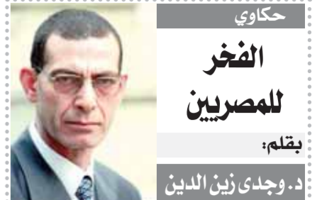
حكايو الفخر للمصريين

وأكد رئيس سلطة الطاقة الفلسطينية، خلال الاجتماع الثامن لوزراء منظمة منتدى غاز شرق المتوسط بالقاهرة أمس، أهمية ضمان حق فلسطين في إدارة وتنمية مواردها مثل باقي الدول، وهو ما كان هدف فلسطين من الانضمام للمنتدى، وأشار المهندس طارق الملا، وزير البترول والثروة المعدنية، إلى أن انطلاق العمل في تنمية حقل غاز غزة مارين، من خلال توقيع مذكرة تفاهم مصرية فلسطينية إحدى النتائج المبهرة لمنتدى غاز شرق المتوسط، حيث تمت هذه الخطوة تحت رعاية