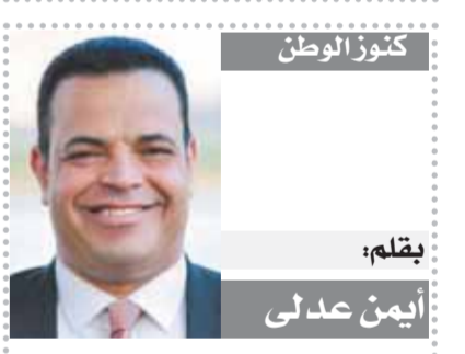
كنوز الوطن بقلم: أيمن عدلى

وعندما حاولت غرفة صناعة السينما فرض حصار بدون منع على هذه السينما الرخيصة أصدرت قرارا بمنع تصدير أى فيلم إلى الخارج فى شرائط فيديو كاسيت إلا بعد العرض فى إحدى دور السينما حتى ولو لمدة أسبوع واحد.. واعتقد أن هذا القرار كان من أسباب تراجع إنتاج أفلام المقاولات لزيادة تكلفتها.. خاصة مع بداية ظهور الفضائيات والذش. وفى مطلع التسعينيات بدأت الفضائيات بث إرسالها عبر الاستاليت، وكان عددها لا يتجاوز الثلاثين قناة.. بل إن فى العالم العربى هناك آلاف القنوات، بل إن الجهات الحكومية والهيئات الرسمية أطلقت الفضائيات الخاصة بها.. ورغم أن ظهور هذه الفضائيات كان يمكن أن يشجع منتجى أفلام المقاولات بزيادة إنتاجهم ولكن لم يحدث، واعتقد أن السبب هو رفض مالكي هذه الفضائيات وخضوعها من الجهات الحكومية تحويلها إلى شاشات للتسلي.. وكان للكثير منها له توجهات سياسية سواء للداخل أو للخارج فأضمدت على الإنتاج السينمائي الرسمى.. أو بمعنى آخر الذى سبق عرضه فى دور السينما وشاهده جمهور كبير.