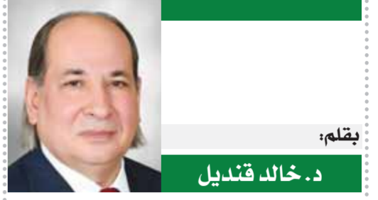
د. خالد قنديل

وهذه هي المرة الأولى التي يفوز فيها مصري وعربي بهذا المنصب. سيق أن شغل منصب رئيس منطقة الشرق الأوسط وشمال إفريقيا بالاتحاد الدولي لسكر. ثم عضواً بلجنة الحكام بالاتحاد، ورئيس الجمعية الأفروآسيوية لسكر، وهو أيضاً رئيس جمعية صعيد مصر لسكر ورئيس التحالف المصري للأمراض غير السارية.