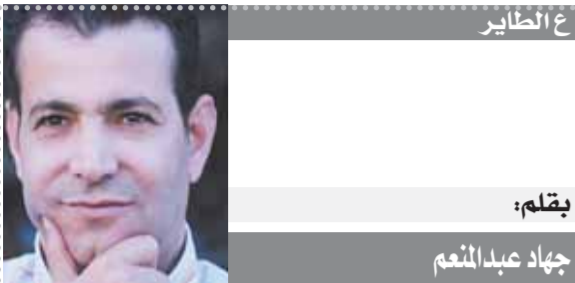
بِقلم: جهاد عبد المنعم

نظم مركز تقييم واعتماد هندسة البرمجيات التابع لهيئة تنمية صناعة تكنولوجيا المعلومات (إيتيدا) ندوة توعوية حول الدكاء الاصطناعي التوليدي من منظور آخر لاكتشاف تقنية التزييف العميق، بمركز إيداع مصر الرقمية بالجيزة، ضمن سلسلة الندوات التوعوية SECC Tech Nights. ناقشت الندوة كيف يستخدّم المزوّنون الدكاء الاصطناعي التوليدي لإنشاء مقاطع فيديو مُزيّفة، وناقشت أيضاً كيفية الاستفادة من تقنية الدكاء الاصطناعي لاكتشاف مقاطع الفيديو المُزيّفة هذه، وذلك لأنّ الدكاء الاصطناعي التطبيقي يمكن تطبيقه في مجالات مختلفة بخلاف إنشاء نصوص. كما سلّطت الندوة الضوء على آلية عمل الدكاء الاصطناعي التوليدي ونطاقاته، وكذلك عمل تقنيات مختلفة لاكتشاف المحتوى الذي يتم إنشاؤه بواسطة أدوات