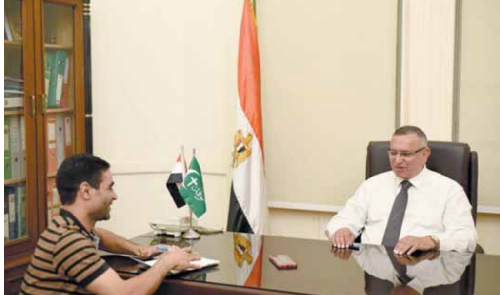
الدكتور عبدالسند يمامة في حوار مع « فبتو »

اليوم.. عبدالسند يمامة في حوار على شاشة ( mbc مصر ) كتب - كريم مطر: يلتقي المرشح الرئاسي الدكتور عبدالسند يمامة اليوم في حواره السياسي على شاشة « mbc مصر » ببرنامج « يحدث في مصر » مع الإعلامي الكبير شريف عامر . تذاع الحلقة في تمام العاشرة مساء اليوم الأربعاء.