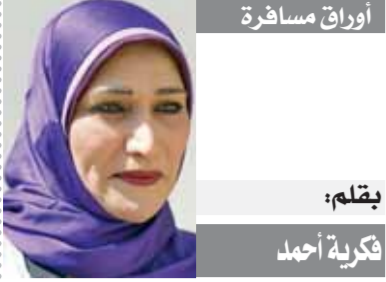
أوراق مسافرة يقلم: نكزية أحمد

طوفان الطوفان وزير التراث الإسرائيلي الياهو يطالب بدك غزة بالقنبلة النووية رغم كل هذا الدمار الذي أحدثته الاحتلال حتى الآن. دكت غزة حوالي ٣٠ طن متخزينات بينما القنبلة النووية وزنها ٤ أطنان فقط.. ومازالت الحياة والقائمة هي غزة تسطر أروع البطولات.. بعيدا عن كل المؤامرات.. ما زال الإعلام العربي يركز على الدمار والشهداء في غزة، حيث لم يحقق الاحتلال سوى قتل النساء والأطفال والمبنيين وهو مدعم بأقوى قوى في العالم من الأمريكان تلك القوى التي أرسلت جيشها على استحياء تخشى أن تدخل المعركة بجندونها حتى لا تكشف أمام العالم أنها مهما تساحت بأقوى وأهنت الأسلحة تفقد قوة العقيدة والإيمان الذي يعطي عدوه غناية من الله فيتهزم الجيوش أمام تلك الإرادة، بينما يفر هؤلاء ويقطنون شر قنلة..