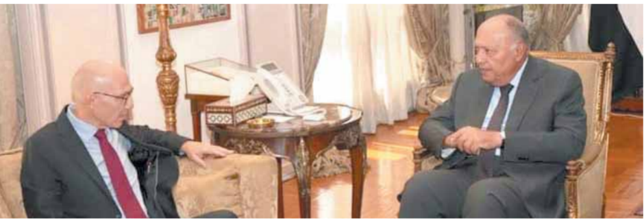
الوزير سامح شكري في اجتماع مع مسؤولين دوليين.

أن إدخال المساعدات لا ينبغي أن يثنى بعض الأطراف الدولية عن دعم الؤف الفوري لإطلاق النار. من ناحية أخرى أكد وزير الخارجية سامح شكري، التزام مصر الراسخ تجاه مواصلة تقديم أوجه الدعم اللازم للسلطة الفلسطينية وبأنه الشعب الفلسطيني في خضم هذه الأزمة، عربياً عن الرفض لازدواجية المعايير التي تنتهها بعض الأطراف الدولية في ظل عدم الاتفاق على وضع الأمور في نصابها الصحيح لإنهاء هذه الكارثة الإنسانية، ووقف الانتهاكات والاعتداءات الإسرائيلية وتحتيهاها بمسمايتها بعيداً عن أي مبررات مغلوطة تحت غطاء حق الدفاع عن النفس أو مكافحة الإرهاب.