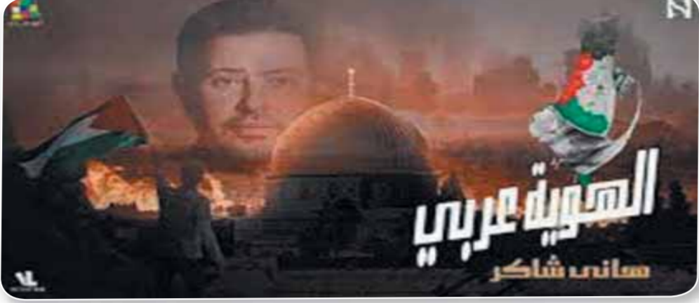
العنوية عربي ساند شاكر

حوار آخر مع إيليس (٣) الم ترو بعد من كل تلك الدماء الذكية للأطفال الأبرياء والنساء وكل المدنيين العزل، أتم تكثف نيرانك من الحرائق الوحشية التي التهمت البيوت والأجساد بقنابل أعوانك وكهنة عهدهك الملوثة التي تارهم بوقف المحرقة في غزة، وتوجه أتون شرورك وحقدك إلى هؤلاء الذين يعيشون في الأرض هزادا ويريدونها عجا وظلما وظلاما؟