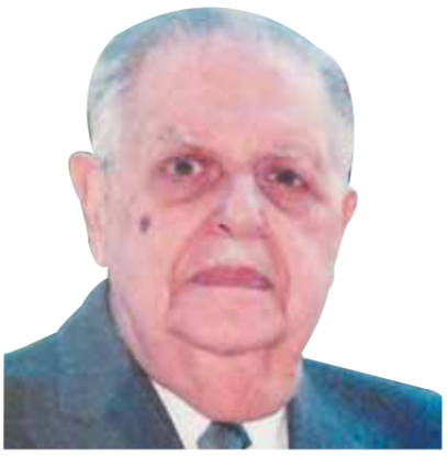
فؤاد سراج الدين