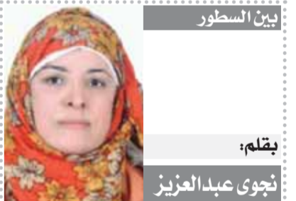
يقلم: نجوى عبدالعزيز