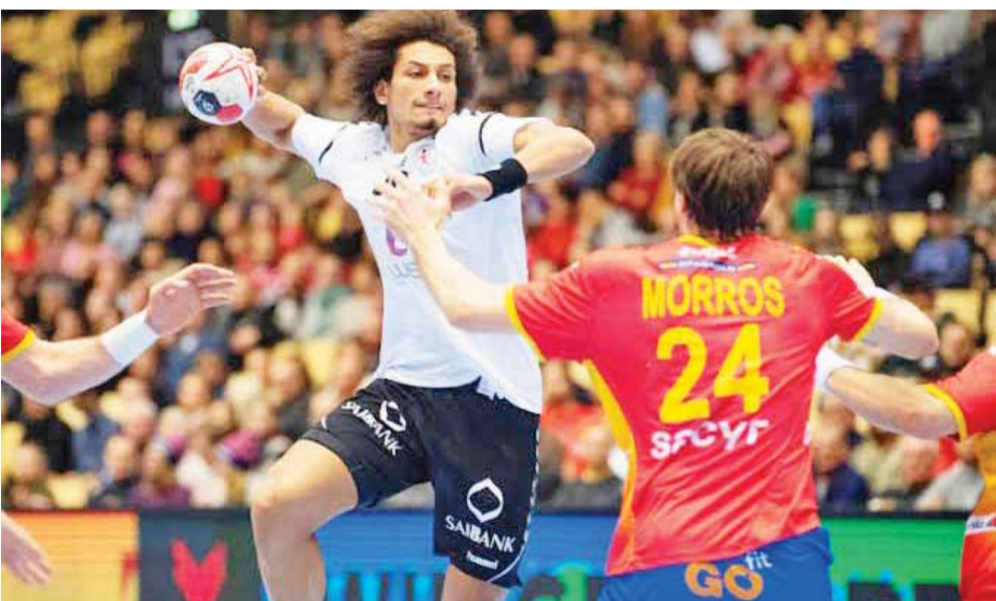
المنتخب خسر أمام إسبانيا في نهائى دورة المتوسط