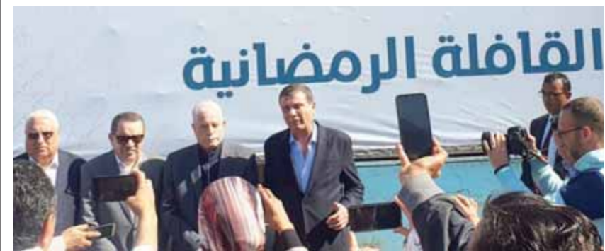
«الزراعى» يطلق قوافل الخير خلال شهر رمضان

المناطق المحرومة والتانية في المحافظات الحدودية وصولاً لأصغر قرية في محافظات الصعيد والدلتا، مع التركيز على القرى المشمولة بمبادرة حياة كريمة تفعيلاً لمبدأ التكافل الاجتماعى وتنفيذاً لتوجهات فخامة الرئيس عبدالفتاح السيسى رئيس الجمهورية بضرورة أن تعمل كل مؤسسات الدولة جنباً إلى جنب بهدف تحسين مستوى معيشة المصريين وتوفير حياة كريمة للأسر الأولى بالرعاية في كافة أنحاء الجمهورية.