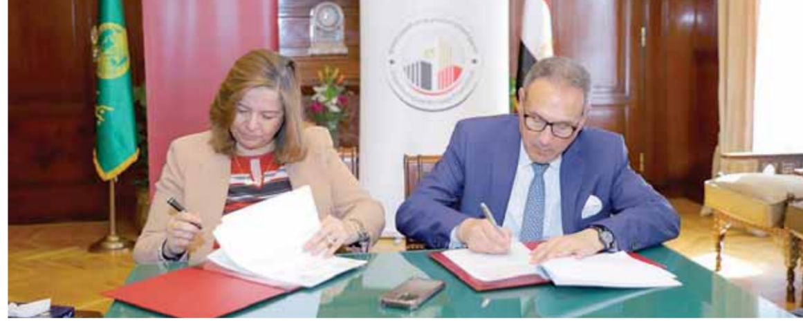
«الإترى، ومي»، خلال توقيع البروتوكول

وأشاد بالدور الفعال الذي قام به الصندوق والذي أدى إلى تحقيق هذه الأهداف من خلال الوصول إلى قاعدة كبيرة من العملاء وصلت إلى ما يقرب من ١٣٥ الف عميل غالبيتهم من