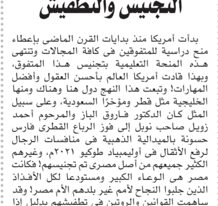
بقلم: محمد دياب