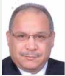
بقلم: حسين حلمي