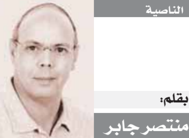
تلك قضية.. كاريوكي!