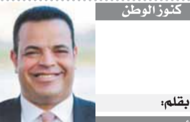
بمقلم: أيمن عدلى