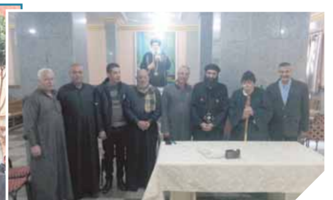
وفد المنوفية يهنئ الأشقاء