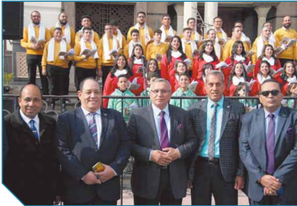
رئيس الوفد ولجنة المواطنة بالحزب يهنئون بعيد الميلاد