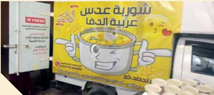
العربة المخصصة للتوزيع

ويتم توزيعها من الساعة الثالثة عصراً على طلاب الجامعة، وبلغت نسبة توزيع الوجبات ٢٠٠ وجبة في اليوم.