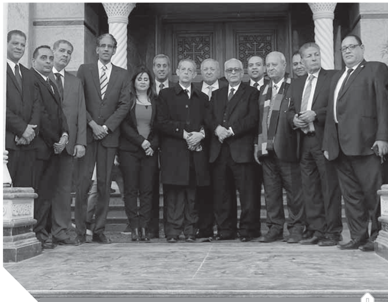
قيادات الوفد يقدمون التهنئة للبابا تواضروس الثانى

دور العبادة لم تفرق بين عنصرى الأمة فى ثورة ١٩١٩