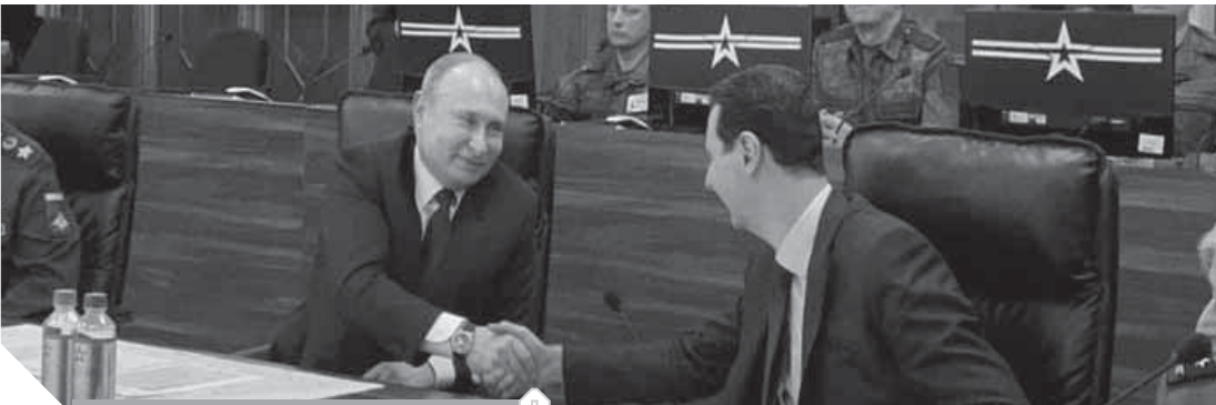
«الأسد»، وبوتين خلال جلسة المباحثات الثنائية بدمشق

وذكر أن الأسد بدوره شكر بوتين على الزيارة وأعرب عن تقديره لمساعدة روسيا والجيش الروسى فى الحرب ضد الإرهاب واستعادة الحياة السلمية فى سوريا.