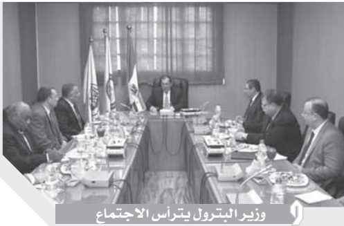
وزير البترول يتراس الاجتماع

ما يتم من خطط وبرامج ليتعرفوا عليها كجزء من المشاركة فى اتخاذ القرار وانعكاس ذلك على سرعة ونجاح التنفيذ فى التوقيتات المطلوبة، وأشار الملا إلى اهتمام الدولة بنشاط التعدين وتعيين نائب لشئون الثروة المعدنية ورويتها بما يتوافق مع الاستراتيجية الموضوعية، وأكد أهمية رفع مستوى الأداء والكفاءة والأخلاص والحماس فى العمل ودعم التعاون بين الإدارات المختلفة بما يحقق فى النهاية صالح العمل وأن تكون القيادات قدوة للعاملين. واستمع الوزير خلال اللقاء إلى آراء واستفسارات القيادات حول طبيعة عمل المرحلة القادمة.