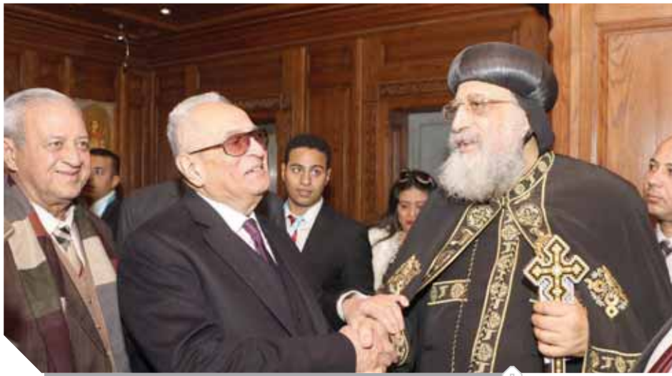
أبوشقة يهتئ البابا تواضروس بعيد الميلاذ المجيد وإلى جواره سفير نور

«السيسى» للمصريين: لا تقلقوا ولا تسمحوا لأحد يدخل بيننا