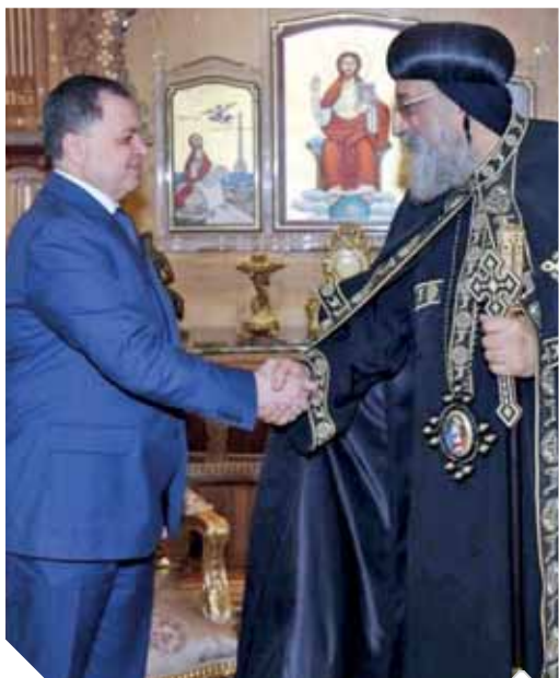
وزير الداخلية يقدم التهنئة للبابا تواضروس