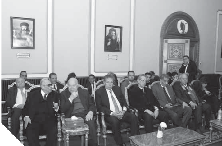
«أبوشقة»، وقيادات الوفد خلال تقديم التهنئة

رئيس الوفد وقيادات الحزب يهنئون البابا تواضروس والأقباط بعيد الميلاد المجيد