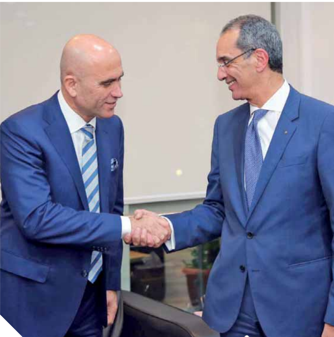
وزير الاتصالات يلتقي رئيس شركة أفيا العالمية

التقى الدكتور عمرو طلعت وزير الاتصالات وتكنولوجيا المعلومات مع نضال أبو لطيف رئيس شركة أفيا العالمية؛ تناول اللقاء بحث التعاون في مجالات تأهيل وتدريب الكوادر البشرية واستخدام منصات برمجيات الشركة الذكية لتقديم أفضل الحلول التكنولوجية لدعم التحول الرقمي وتحفيز الابتكار وتنمية المهارات المصرية من أجل تعزيز تنافسيتها على الصعيد العالمي وتحسين جودة الخدمات؛ حيث تم الاتفاق على إطلاق مركز عالمي لتطوير وتحديث برمجيات شركة أفيا العالمية في مصر، ويقدم خدماته لكل دول العالم التي تعمل بها الشركة، وسيتمثل بيئة مناسبة لدعم الابتكار وتوطين الإبداع في البحث والتطوير للتقنيات الذكية والبرمجيات والحلول القائمة على الحوسبة السحابية ورفع كفاءة المهارات البشرية.