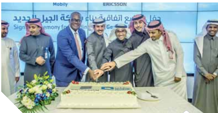
جانب من الاحتفال بتوقيع الاتفاقية المشتركة

وستمكن منتجات نظام إريكسون الراديوي مشتركة موبايلي من تعزيز أصول الطيف وتحسين تجارب العملاء والكفاءات التشغيلية. كما ستقوم إريكسون أيضاً بتوفير ودمج الجيل التالي من العمليات، لتعزيز تجارب عملاء موبايلي واقتناص فرص جديدة وزيادة كفاءة الأعمال، إلى جانب تقديم خدمات الاتصالات من الجيل التالي