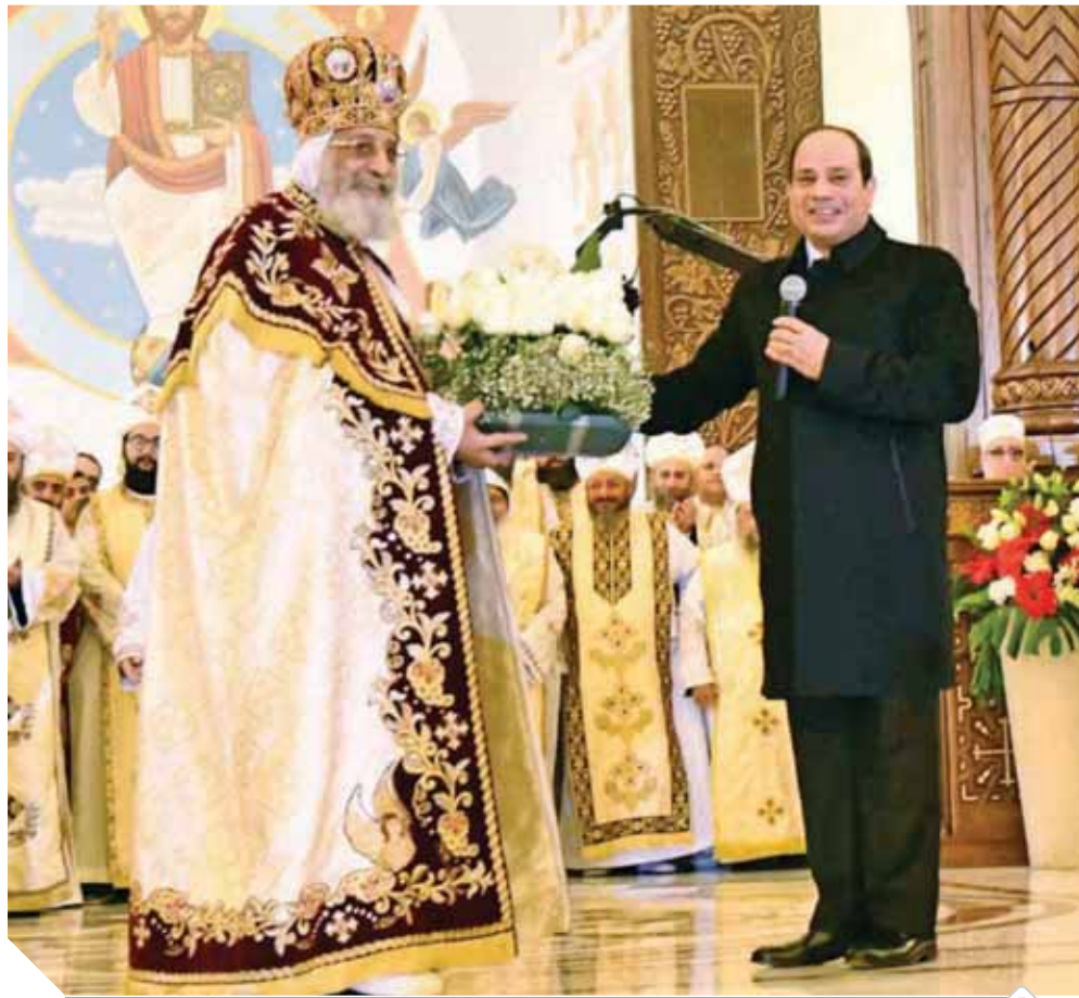
السيسى يهتئ البابا تواضروس الثانى بعيد الميلاذ المجيد