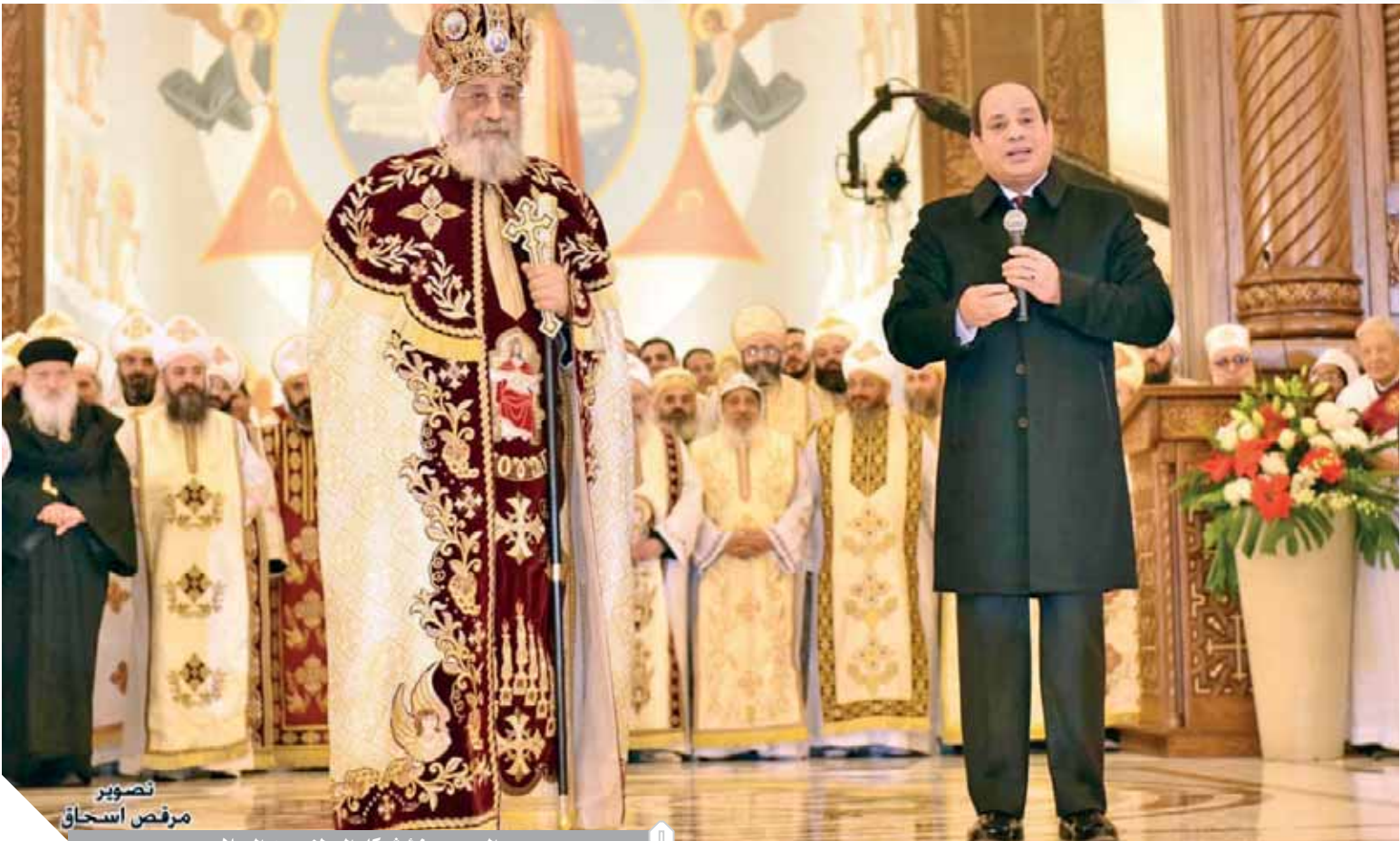
السيس يهنئ شركاء الوطن بعيد الميلاد

واختتم الرئيس كلمته بإهداء البابا تواضروس الثاني «باقة ورد» معرباً عن آمانياته في أن يكون عاماً جديداً مليئاً بالخير، والسلام.