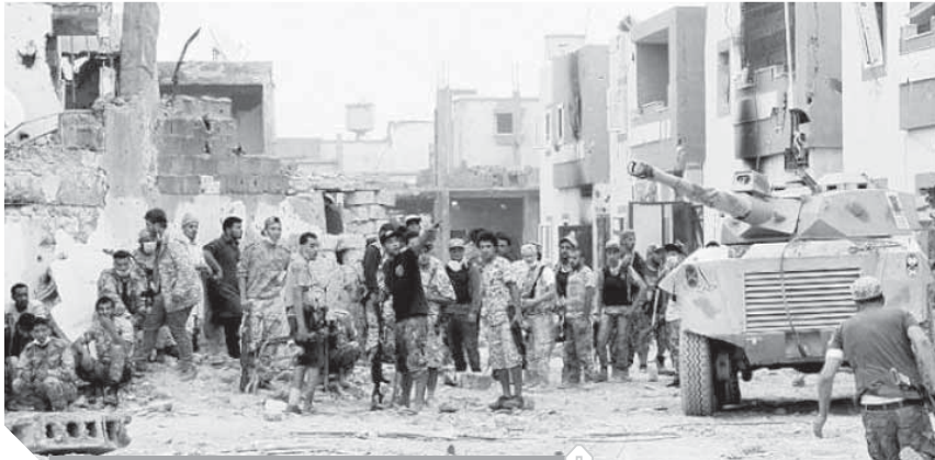
المخططات التركية الخبيثة تسمى لتمكين التنظيمات الإرهابية

ودعا المرصد إلى الوقوف بحزم أمام هذه المخططات الشيطانية التى تغذي الإرهاب وتشر الفساد فى الأرض والتصدي للأطماع التركية الماحدودة التى تندر بالتصعيد الإقليمي، وإدخال المنطقة فى صراعات مريرة وموجة جديدة من الفوضى والعنف والإرهاب.