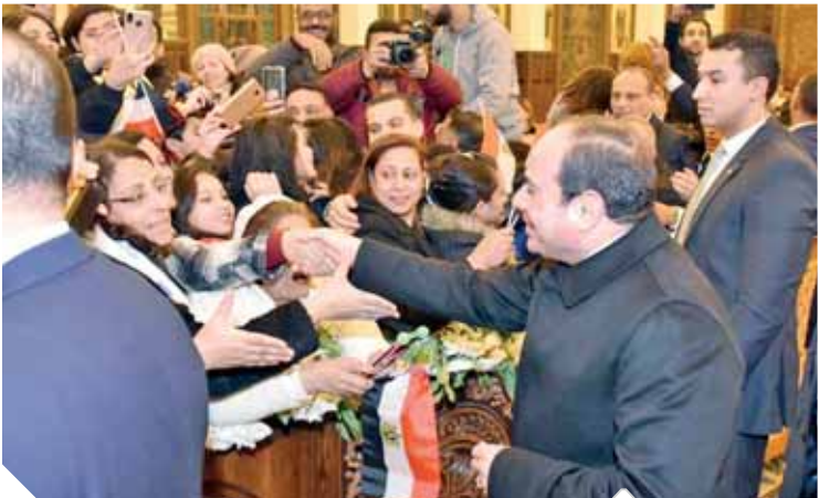
الرئيس خلال مصافحته عددا من الحضور لتهنئتهم بالعيد

على زيارته للكاتدرائية، وحضوره، وتهنئته للأقباط، مؤكداً أن زيارته تسبب فرحاً كبيراً.