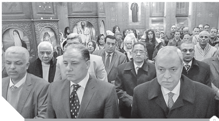
قيادات القليوبية يهنئون

وقدم أباطة التهنئة للأبنا تيموثاوس، أسقف إيبارشية الزقازيق ومنيا القمح، كما قدم تهنئة المستشار بهاء أبوشقة للإخوة الأقباط، مؤكداً أن المصريين شعب واحد ونسيج واحد يجمعهم وطن واحد ولن تستطيع المؤامرات التي تحاك للوحدة بيننا ومن هنا تأتي قوة الدولة المصرية. وأعرب الأبنا تيموثاوس عن سعادته لحضور قيادات وأعضاء حزب الوفد، وطلب بحضوره الحفاظ على وحدة المصريين وتماسكهم وأن تظل المحبة والسلام الدرع الواقى للوطن. وحرص أعضاء لجنة حزب الوفد