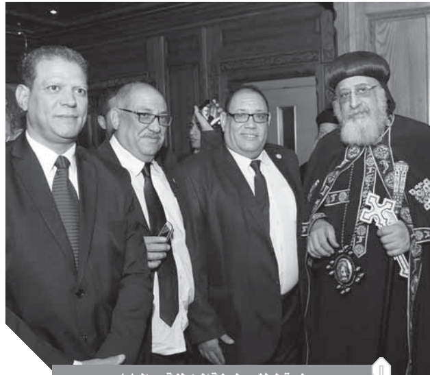
صوت لطفى ولجنة المواطنة مع البابا