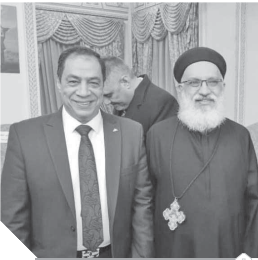
حسنى حافظ يهنئ