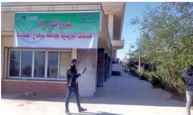
مشروع إنشاء مركز الخدمات البريدية بجامعة سوهاج الجديدة

قرر الدكتور عمرو طلعت وزير الاتصالات وتكنولوجيا المعلومات البدء في إقامة مركز الخدمات البريدية بمقر جامعة سوهاج الجديد لتقديم كافة الخدمات البريدية والمالية والمجتمعية المتكاملة للطلاب، والعاملين وأعضاء هيئة التدريس والمتفردين على الجامعة. وذلك كاستجابة سريعة وإفاء بوعد الدكتور عمرو طلعت، للواء طارق الفتحي محافظ سوهاج، والدكتور أحمد عزيز رئيس جامعة سوهاج، أثناء زيارته مقر جامعة سوهاج الجديد في الأسبوع الماضي.