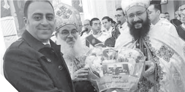
النائب الوفدي محمد خليفة يشارك في الاحتفال بالعيد بكنائرية الشهيد مارجرس بطنطا

شاركت اللجنة العامة لحزب الوفد في محافظة الغربية، الإخوة الأقباط احتفالات عيد الميلاد المجيد، في كاتدرائية الشهيد مارجرس والشهداء الأبرار في طنطا. وقدمت اللجنة خالص التهاني والتبريكات للإخوة الأقباط، حيث نقل النائب الوفدي الدكتور محمد خليفة، سكرتير عام اللجنة تهنة المستشار بهاء الدين أبوشقة، رئيس حزب الوفد، الذي أكد حرص بيت الأمة على مشاركة شركاء الوطن في احتفالاتهم وأعيادهم وجميع مناسباتهم، وذلك تنفيذاً لثوابت ومبادئ حزب الوفد الذي يحمل شعار الهلال الذي يعنض الصليب، وأن الشعب المصري نسيج واحد، سيظل في رباط إلى يوم الدين.