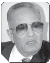
بهاء الدين أبوشقة