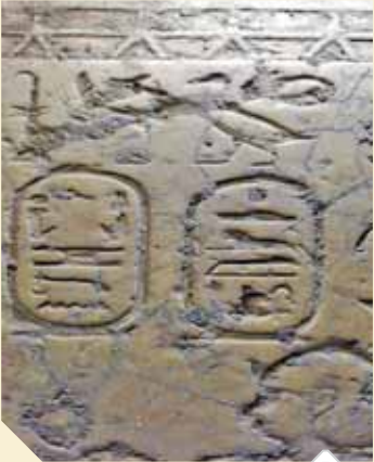
جانب منالكشف الأثري