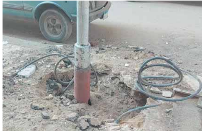
كابلات الكهرباء تصعق المواطنين بالزاوية الحمراء