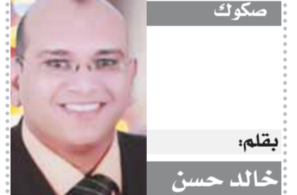
بقلم: خالد حسن

إن مصر العظيمة كما نرى في مزيج من التاريخ والجغرافيا، فالتاريخ يقول إنها حافظت على هويتها على مر العصور رغم تعدد الغزاة وكانت دائما تسبب داخل ذاتها وتحافظ على كيانها وهويتها وتقوام الغزاة حتى تدرهمه ويبنوا الجبابة أما الجغرافيا فإن شعبها العظيم أخذ العمق من بحرهما شرقًا وشمالًا وأخذ الصلابة والقوة من جبالها وأخذ الصبر من صحرائها وأخذ الخير والعطاء، ونيلها وأخذ التواصل مع العالم من قنالها، إنها مصر حقا مزيج من التاريخ والجغرافيا وهي دائما حصن حصين بإرادة الله ثم عطمة شعبها وجيشها مهما علا الضجيج وشارت الرياح وهاجت البحار فهي مصر القوية وسوف تستمر الأكت تدق على باب مصر تعجبا وتوددا.