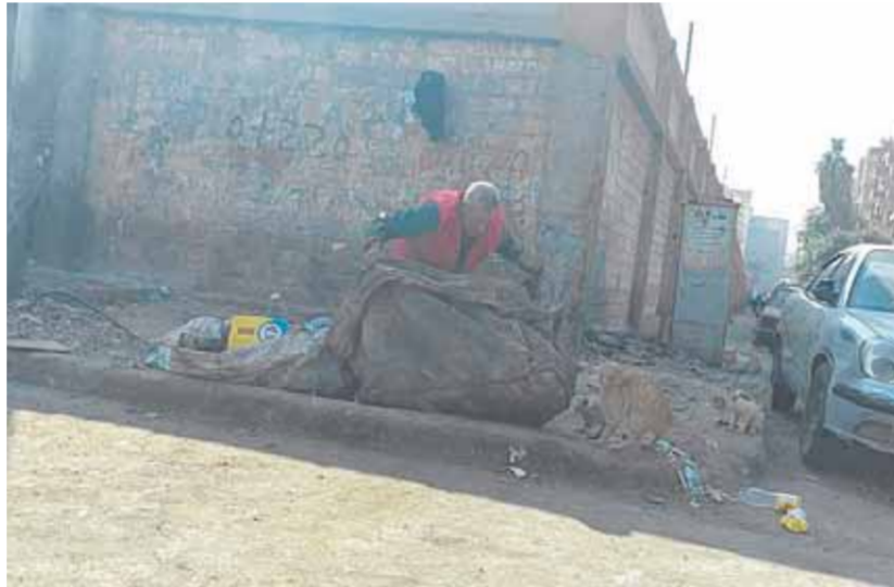
غياب تام لصناديق القمامة بحى حدائق القبة