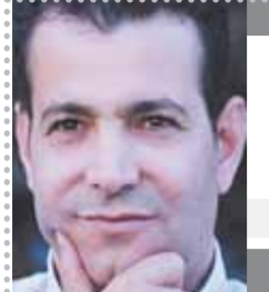
إشراف: جهاد عبد المنعم