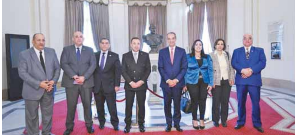
الوزير عمرو طلعت مع وفد من أعضاء المجلس القومي لتنظيم الاتصالات برئاسة الدكتور أحمد الظاهر، في مقر المجلس.