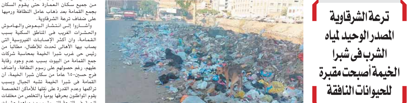
الكلاب والقمامة على ضفاف ترعة الشراوية بشبرا الخيمة