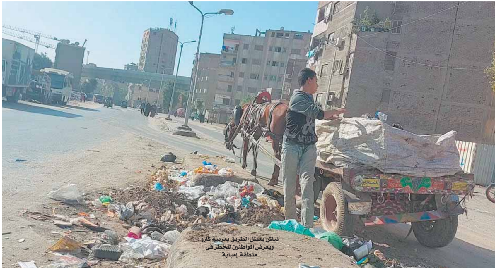
تباثن يفصل الطريق بعربية كارو ويعرض المواطنين للخطر فى منطقة إمبابية