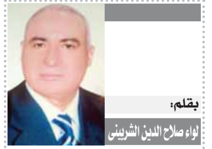
بقلم: لواء صلاح الدين الشريفي