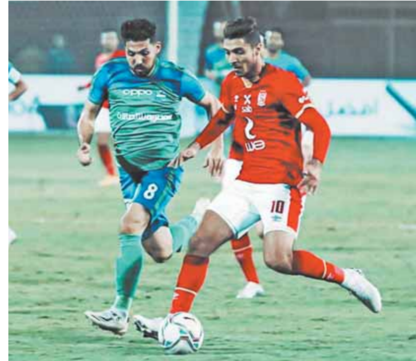
الأهلى رفض التتريط في شريف