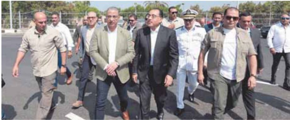
مصر زاد في ٨ سنوات ١٨ مليون نسمة ومع ذلك انخفضت نسبة البطالة. وأوضح رئيس الوزراء أن هناك مشروع لاستخلاص الأملاح من بحيرة قارون وتوسعات في شمال البحيرة

لاستخراج ملح نقي وبدء طرح زريعة الأسماك ببحيرة قارون قريبا. وقال رئيس الوزراء، أن الدولة قطعت شوطا كبيرا في تطوير وتطهير البحيرات المصرية تنفيذاً لتكليفات رئيس الجمهورية، موضحاً أنه تم رفع كفاءة مصرف بحر يوسف في القيوم لمنع تسرب مياه الصرف لبحيرة قارون، موضحاً أن بحيرة قارون مساحتها ٥٥ ألف فدان وتم العودة لتسريب المياه الطبيعي لها بعد حل الأزمة، مؤكداً أن السمك بدأ في التواجد في البحيرة وتزايد أعداد الطيور التي تتواجد. وأشار إلى أنه بالرغم من الأزمة العالمية فإن نسب البطالة في مصر في أدنى مستوياتها، مؤكداً أن الدولة تحتاج لهذه المشروعات في الوقت الحالي. كما أشار رئيس الوزراء، إلى اتخاذ الحكومة إجراءات خلال الفترة الماضية من شأنها تخفيف جزء من الاعباء والزيادات العالمية التي حدثت للأسعار، وأضاف أن أي زيادات في الأسعار تحملها الدول الأخرى على المواطن ولكن الدولة المصرية قررت تحمل الجزء الأكبر في ظل الأزمات العالمية.