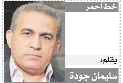
حظ احمر بقلم: سليمان جودة