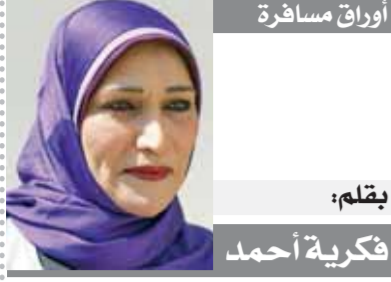
بقلم: فكرية أحمد